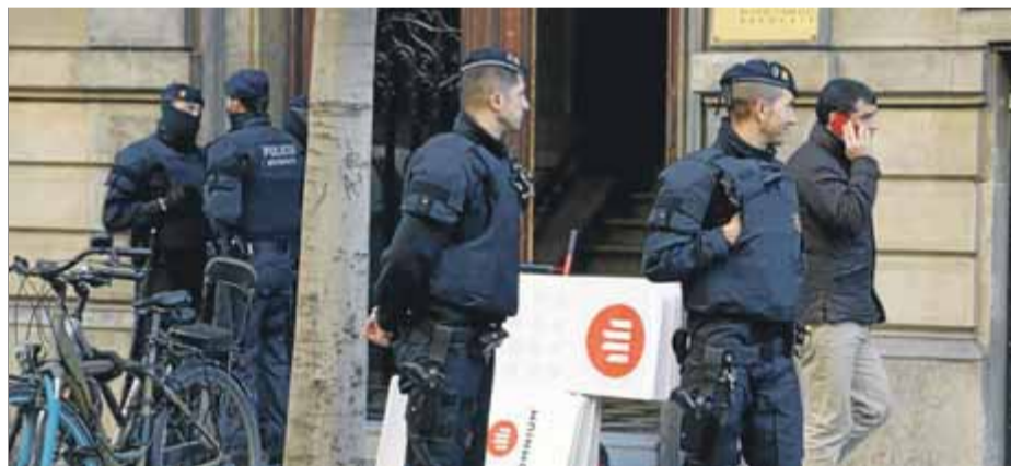
Mossos custodiant la seu d'Òmnium, escorcollada el gener i març passats