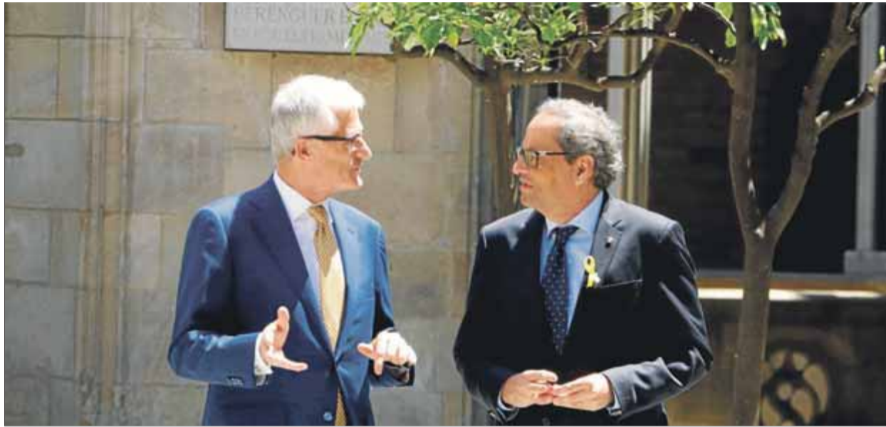
El president Quim Torra es va reunir ahir al Palau de la Generalitat amb el president de Flandes, Geert Bourgeois

El Tribunal Constitucional va admetre ahir per unanimitat el primer recurs d'inconstitucionalitat presentat pel govern de Pedro Sánchez, amb l'aval del Consell d'Estat, contra una moció del Parlament, concretament la que ratificava, el 5 de juliol passat, els objectius polítics per "culminar democràticament la independència de Catalunya", aprovada a instàncies de la CUP amb els vots a favor de Junts per Catalunya i ERC. L'admissió a tràmit n'implica la suspensió cautelar automàtica, però no entra en el fons de la qüestió. L'alt tribunal ja va anul·lar i suspendre la resolució del 9 de novembre del 2015 en el mateix sentit que ha dut l'expresidenta del Parlament, Carme Forcadell, a la presó. El Parlament disposa de vint dies per personar-se i formular les alegacions que