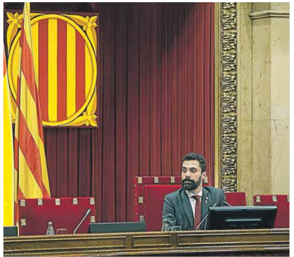
Roger Torrent, que avui haurà de decidir, durant el ple ordinari iniciat ahir

Amb tot, la qüestió clau serà la posició de JxCat, que ahir va evitar fer comentaris, i que es debat sobre si insisteix en el discurs dels últims dies, que no hi ha motius per a la suspensió i és el ple qui ha de tenir l'última paraula tot seguint l'article 25 del reglament —l'informe admet en aquest punt un conflicte de legitimitats amb la llei estatal, però no es mulla sobre què preval—, o si accepta la solució proposada pels lletrats, fet que suposaria implícitament que accepta la suspensió judicial. Una suspensió, això sí, que en la pràctica no suposaria ni la renúncia a l'acta i als drets polítics dels diputats ni l'alteració de les majories, les línies vermelles que posaven els independentistes. De fet, tot i que l'informe no ho esmenta, l'únic efecte pràctic llavors seria