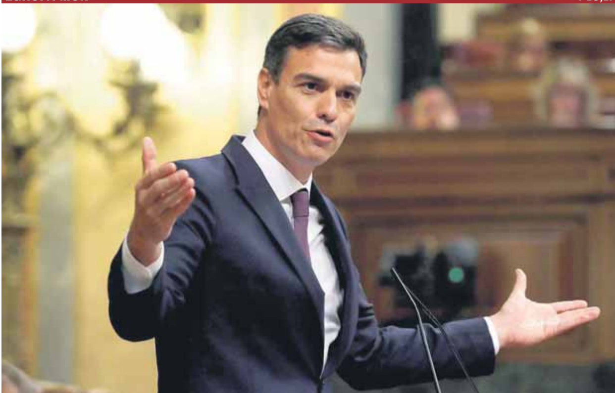
Pedro Sánchez, en un moment del seu discurs d'ahir al matí al Congrés dels Diputats