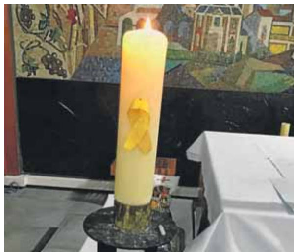
El llaç groc que hi ha al ciri de l'altar, i que el rector s'ha compromès a retirar a petició d'un grup de feligresos ■ ACN

a través de l'Arquebisbat de Tarragona, que el llaç no li ha posat ell allà i s'ha compromès a retirar-lo per evitar la polèmica.