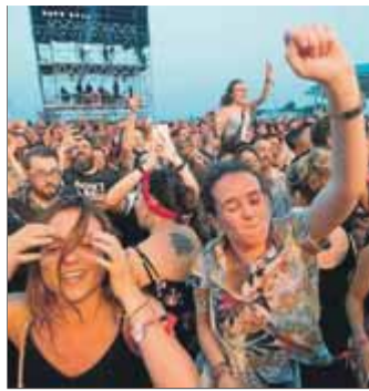
Públic al festival Cruïlla

El sector va facturar 200 milions d'euros el 2017, sobretot gràcies als seus dos motors: concerts i festivals