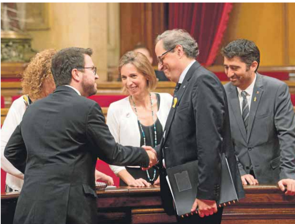
El vicepresident Aragonès, d'ERC, i el president Torra, de JxCat, saludant-se ahir a la cambra

OPOSAT • JxCat assegura que hi havia un pacte verbal mentre que Esquerra ho nega, i Maragall diu que l'incident no afectarà el govern