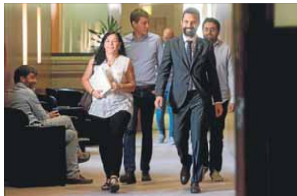
Els membres d'ERC de la mesa, ahir al Parlament

que les intervencions de Campdepadrós en la mesa havien estat favorables a la proposta –ho explicaven per una suposada divisió interna a JxCat–, i els va sorprendre que en l'últim moment s'abstingués, fet que atribuïen a suposades pressions internes. “La discrepància principal