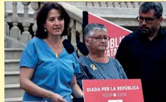
Presentació dels actes de la Diada