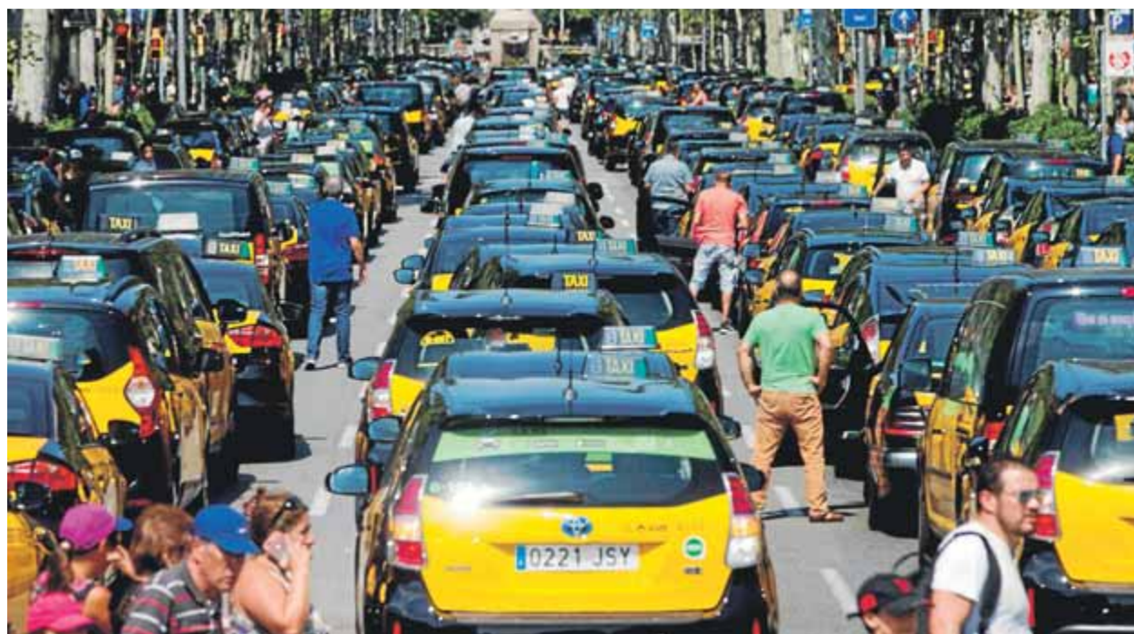
La Gran Via de Barcelona plena de taxis en la mobilització d'ahir del sector que va col·lapsar el centre de la ciutat

DECISIÓ JUDICIAL • El TSJC manté la suspensió cautelar del reglament metropolità que regula les VTC, i els taxistes provoquen el caos al centre de Barcelona i es declaren en vaga indefinida