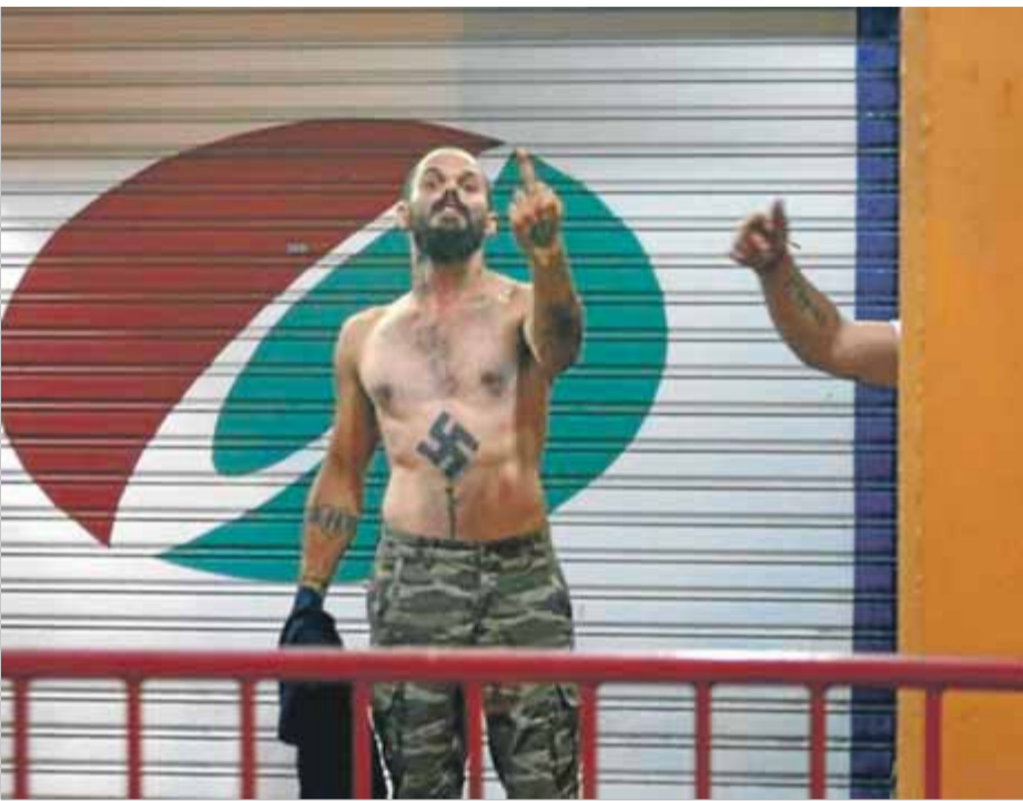
Un dels presumptes agressors de Nou Barris