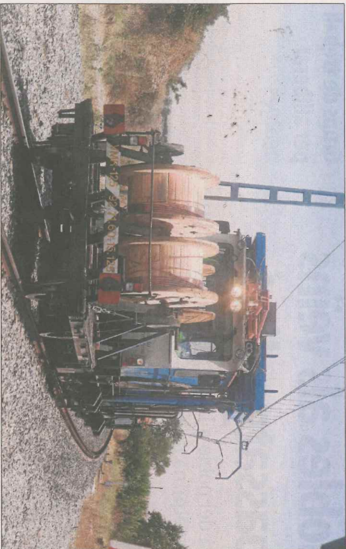
Maquinària utilitzada ahir per revisar la línia al seu pas per Bellpuig.