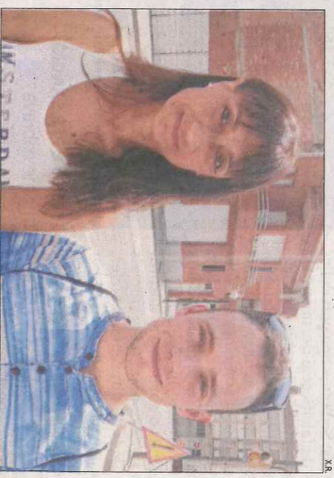
EN PRIMERA PERSONA

D'altra banda, aquesta disminució del trànsit ha perjudicat les gasolineres d'Alguaire i Almenar. En aquest sentit, una treballadora d'Alguaire va assenyalar que durant la temporada d'esquí "era un no parar de clients" i que ara s'ha reduït el volum de negoci. No obstant, els alcaldes consultats van assegurar que els comerços locals no s'han vist afectats per la reducció del trànsit, perquè "no depenen del negoci que genera el transport".