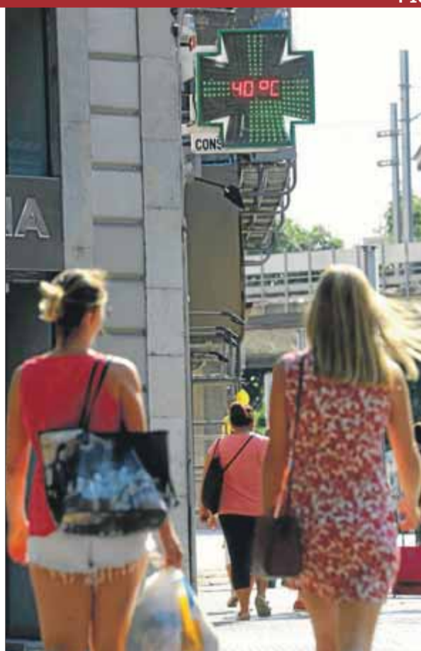
Els termòmetres van vorejar els 40 graus arreu ■ QUIM PUIG

Un estudi revela l'augment de la mortalitat les nits en què el termòmetre no baixa dels 23 graus