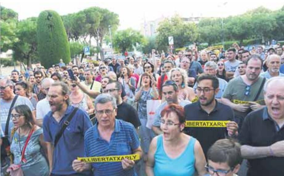
La concentració que es va fer ahir a Palafrugell en suport del detingut