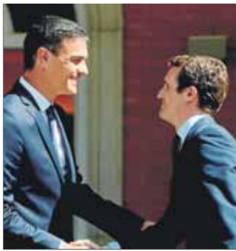
Sánchez rebent Casado, ahir

Casado li demana que no cedeixi amb l'acostament dels presos d'ETA i l'avis que pensa explotar la migració