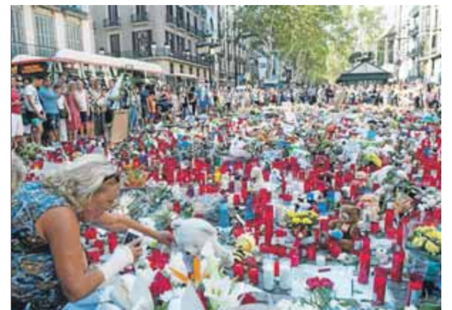
La Rambla de Barcelona es va omplir de flors i espelmes els dies posteriors als fets com a homenatge

Des de la seu de la CUP a la del PDeCAT, al carrer Provença, els activistes s'hi van desplaçar en manifestació i en arribar al lloc es van trobar amb dos furgons dels Mossos d'Esquadra i diversos agents de la brigada mòbil formats davant l'entrada principal, circumstància que va impedir que s'hi pengés cap pancarta amb el lema "desobediència". Alguns dels concentrats van cremar fotos del jutge Llarena i el rei Felip VI. ■