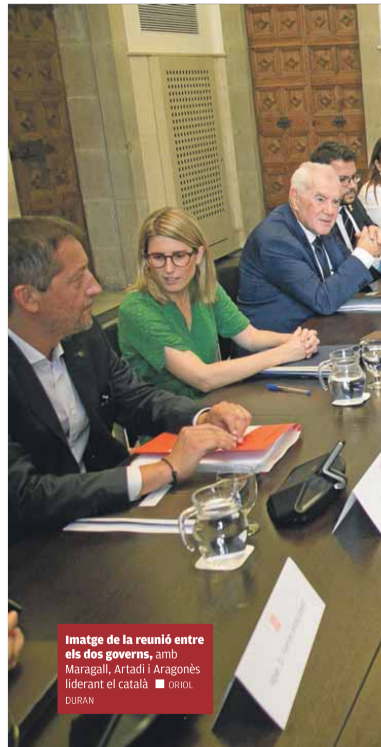
Imatge de la reunió entre els dos governs, amb Maragall, Artadi i Aragonés liderant el català

Finalment, la menys sorpresa pel resultat de la bilateral era la CUP. "Són fum", advertia el diputat Vidal Aragonés. "No hi haurà cap reconeixement d'autodeterminació", i va recriminar al govern de Quim Torra que "el que va obrir per sota el poble de Catalunya l'1 d'octubre es vulgui tancar ara per dalt, des dels despatxos", va sentenciar. ■