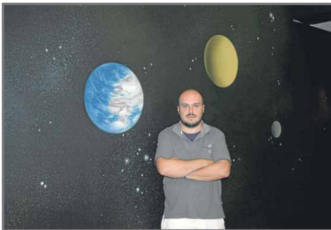
Ribas assenyala que cal corregir la contaminació lumínica, que perjudica els ecosistemes ■ PAM

● El parc del Montsec divulga i contribueix a preservar un dels millors cels del món per a l'observació astronòmica. Rep milers de visitants cada any, que són un revulsiu per al territori