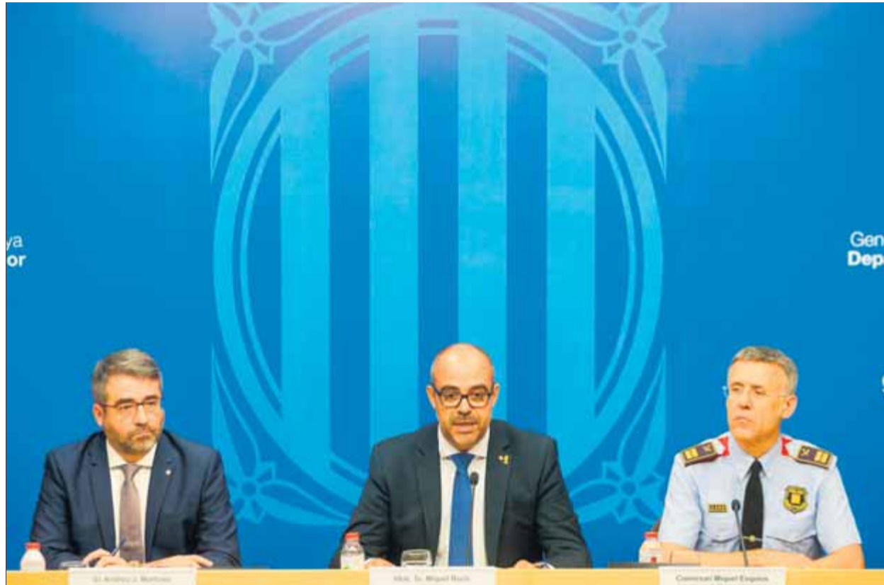
Martínez, Buch i Esquius, exposant ahir la seva posició

De seguida la CUP va sortir al pas per denunciar