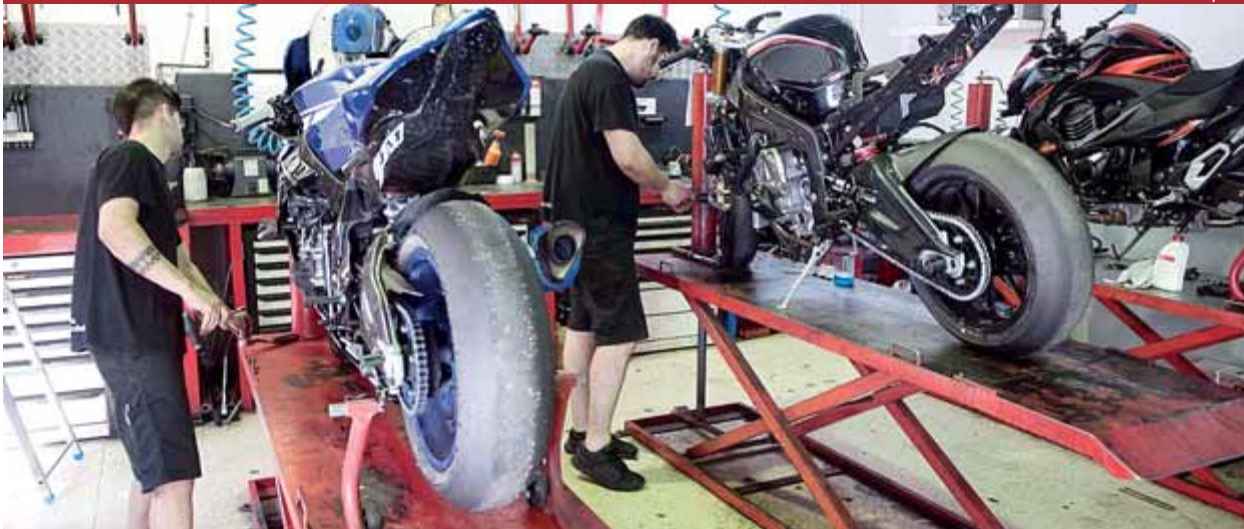
Dos mecànics de motocicletes de gran cilindrada a Muro Motoservei, a Badalona