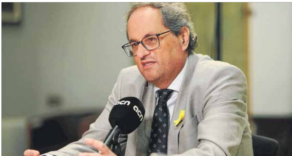
El president Quim Torra durant l'entrevista al Palau de la Generalitat