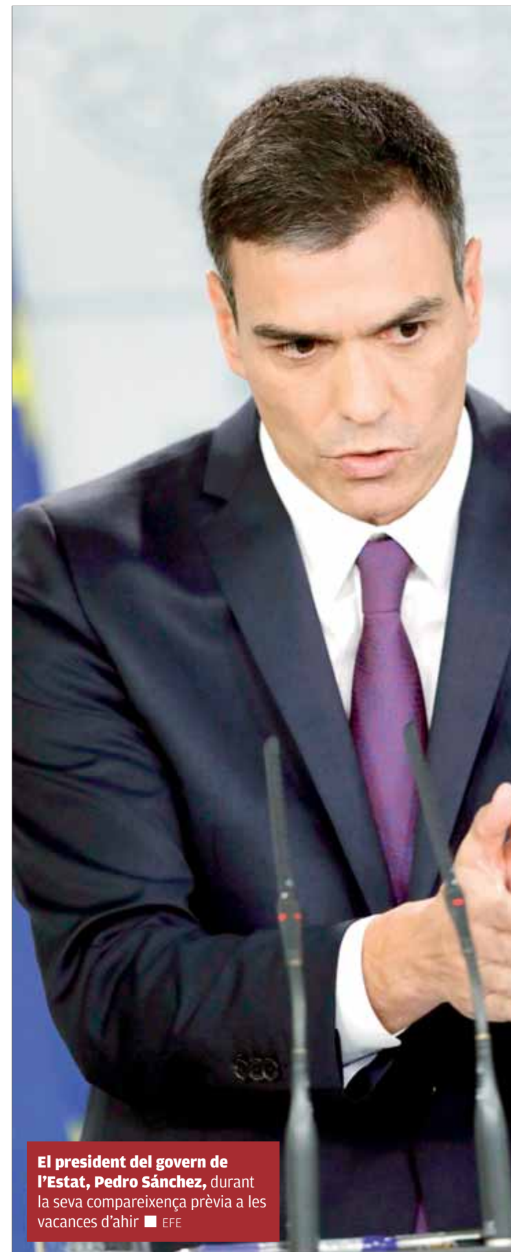
El president del govern de l'Estat, Pedro Sánchez, durant la seva compareixença prèvia a les vacances d'ahir

Acceptat el suport a una mesura extrema com el 155 que hauria de passar pel Senat controlat pel PP, Sánchez va reclamar a Casado la “lleialtat” que ell va tenir amb Rajoy i que no demani portar al Codi Penal la prohibició de celebrar referèndums que existia amb José María Aznar i que Rajoy no va recuperar. “El greuge territorial i la confrontació no són projectes que sumin”, va etzibar a un líder del PP a qui li veu opinions “extremistes”. ■