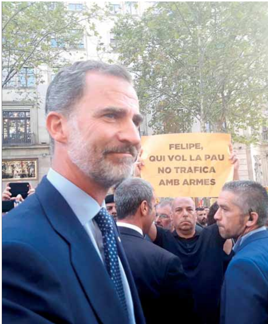
El rei espanyol, Felip VI, durant la manifestació de l'any passat

L'homenatge l'organitzen la Generalitat, l'Ajuntament de Barcelona i la delegació del govern espanyol, però l'executiu de Quim Torra no hi ha convidat el rei: ha trencat relacions amb Felip VI en espera que demani disculpes pel seu discurs aporellista del 3-O. S'ha previst una commemoració sense parlaments institucionals amb un acte breu a la plaça de Catalunya en què el protagonista en tinguin les víctimes i els seus familiars, sota el lema Barcelo-