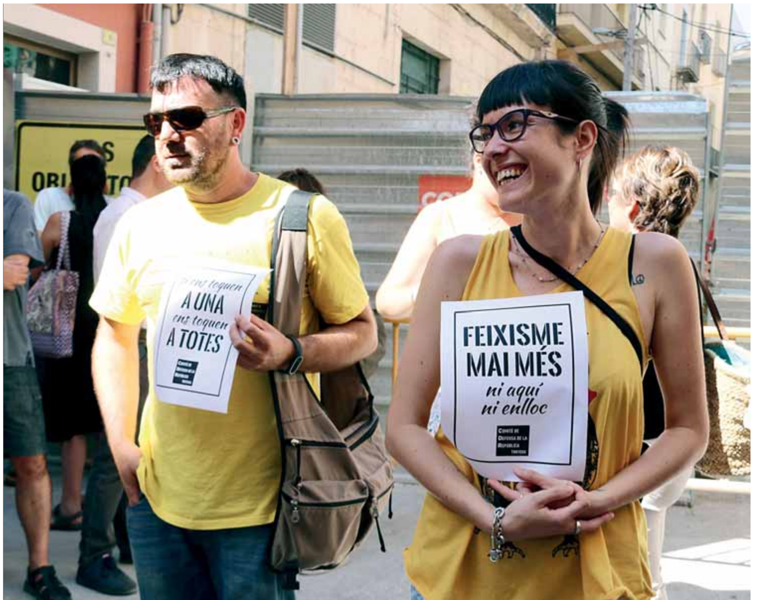
Dues persones van acompanyar una dona de Tortosa a un judici contra un agressor que la va colpejar quan posava llaços grocs

La policia catalana ha de fer la seva feina. No l'hem de situar al centre del debat polític. Ni convé ni és l'estratègia intel·ligent si realment es vol que actuï amb eficàcia. Però certament, la seva actuació davant d'aquests brots ha d'incloure mesures preventives i de detecció precoç i mesures actives quan es produeix una agressió. S'ha d'evitar absolutament que aquests individus emmascarats, violents i intolerants puguin tenir cap sensació d'impunitat. I per això cal sobretot que la justícia actuï i prengui aquesta qüestió com una prioritat de primer nivell.