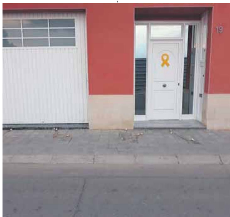
Un dels habitatges on els brètols van llançar ous durant la nit de dijous a divendres, a Vallfogona de Balaguer

Les tres vegades els veïns afectats ho han denunciat als Mossos d'Esquadra. Però fins ara les