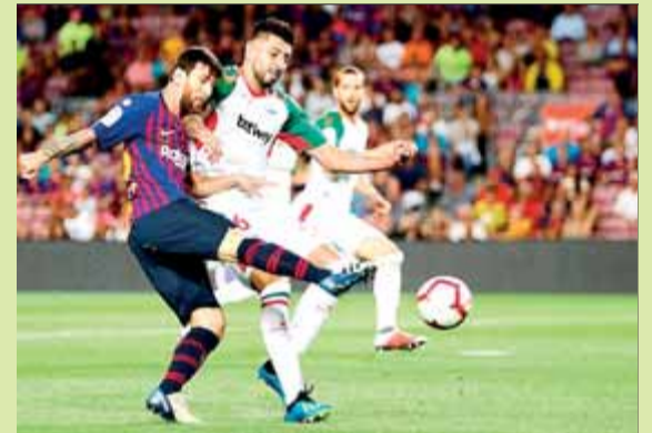
Messi en una acció del partit