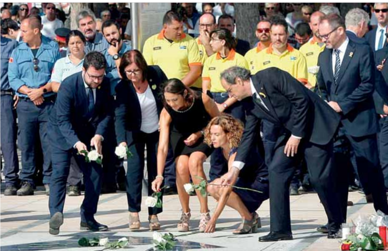
Les autoritats dipositen una rosa blanca en el memorial obert ahir a Cambrils

REACCIONS • Aplaudiments per al president Torra i xiulets per la presència dels líders del PP