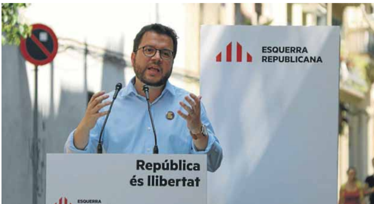
Pere Aragonès, ahir, durant un acte al barri de Gràcia de Barcelona; a la dreta, un dels mapes que duïen els grups que retiraven estelades i llaços grocs