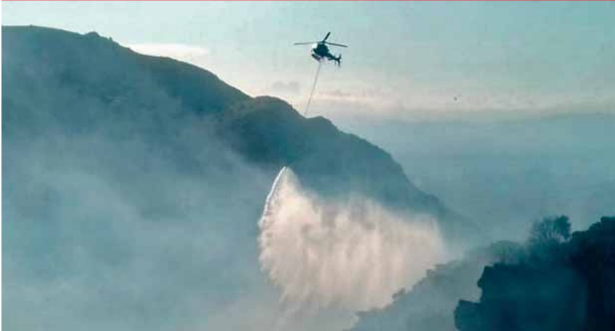
Un helicòpter intervé en les tasques d'extinció del foc, ahir a la tarda

RETRET • Paluzie lamenta, en el mateix acte a l'UCE, que a l'octubre no es pressionés al carrer per tirar endavant la DUI