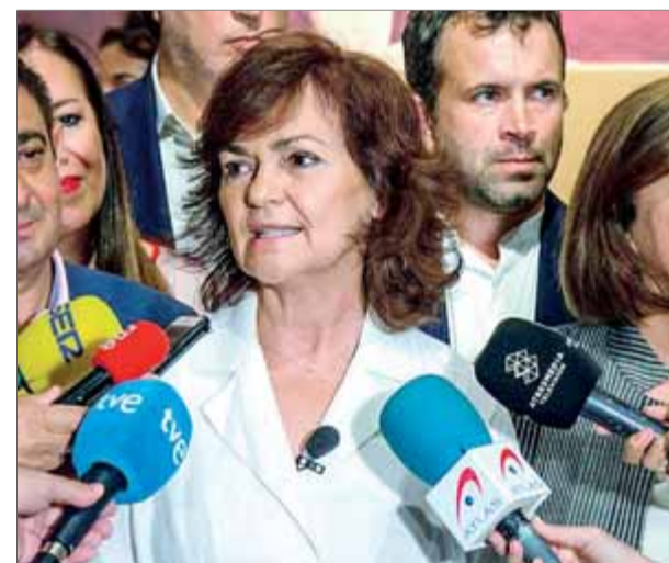
Carmen Calvo, vicepresidenta del govern espanyol, atenant la premsa, en un acte a Jaén

D'altra banda, el president de Cs, Albert Rivera, va acusar Quim Torra d'utilitzar els Mossos com a "policia política", després que la nit de dijous a divendres van identificar a la Ribera d'Ebre 14 persones per haver retirat llaços grocs, entre les quals hi hauria un guàrdia civil. ■