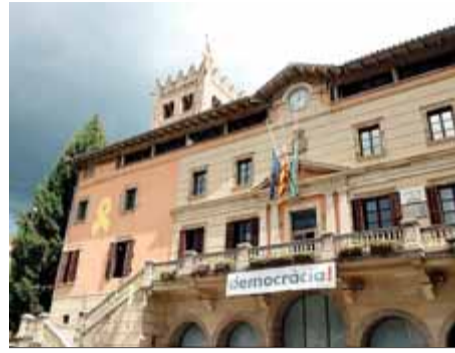
Banderes a mig pal el dia 17 passat

Recupera el pols després del xoc de saber que eren del poble els terroristes del 17-A