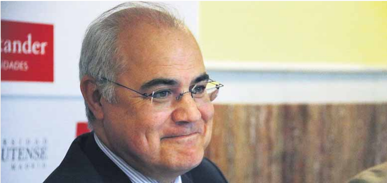
El jutge Pablo Llarena rebrà l'escalf oficial, del rei Felip VI a la cúpula judicial, en l'obertura del curs judicial 2018/19 el 10 de setembre a Madrid

■ Sánchez fitxa el bufet Liedekerke a càrrec del contribuent contra Puigdemont ■ L'obertura del curs judicial amb Felip VI es fixa la vigília de la Diada per enaltir el jutge que no obté les euroordres