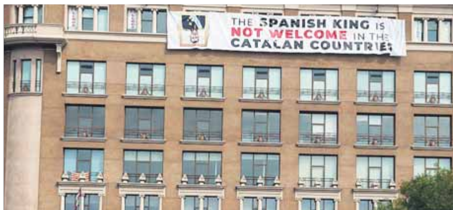
La pancarta contra el rei, penjada a la plaça Catalunya de Barcelona la nit abans dels actes del 17-A, deia “El rei espanyol no és benvingut als Països Catalans”

Fonts del Departament d'Interior van aclarir ahir que els Mossos només han “informat”, i no pas denunciat, a la fiscalia aquesta acció reivindicativa, i afegeixen que “ho fan sempre” quan té a veure