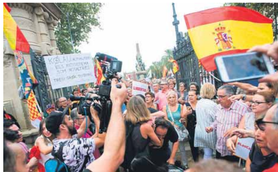
El càmera de Telemadrid agredit en la manifestació de Ciutadans

■ Les associacions de periodistes condemnen els fets i els consideren una vulneració de la llibertat d'informació