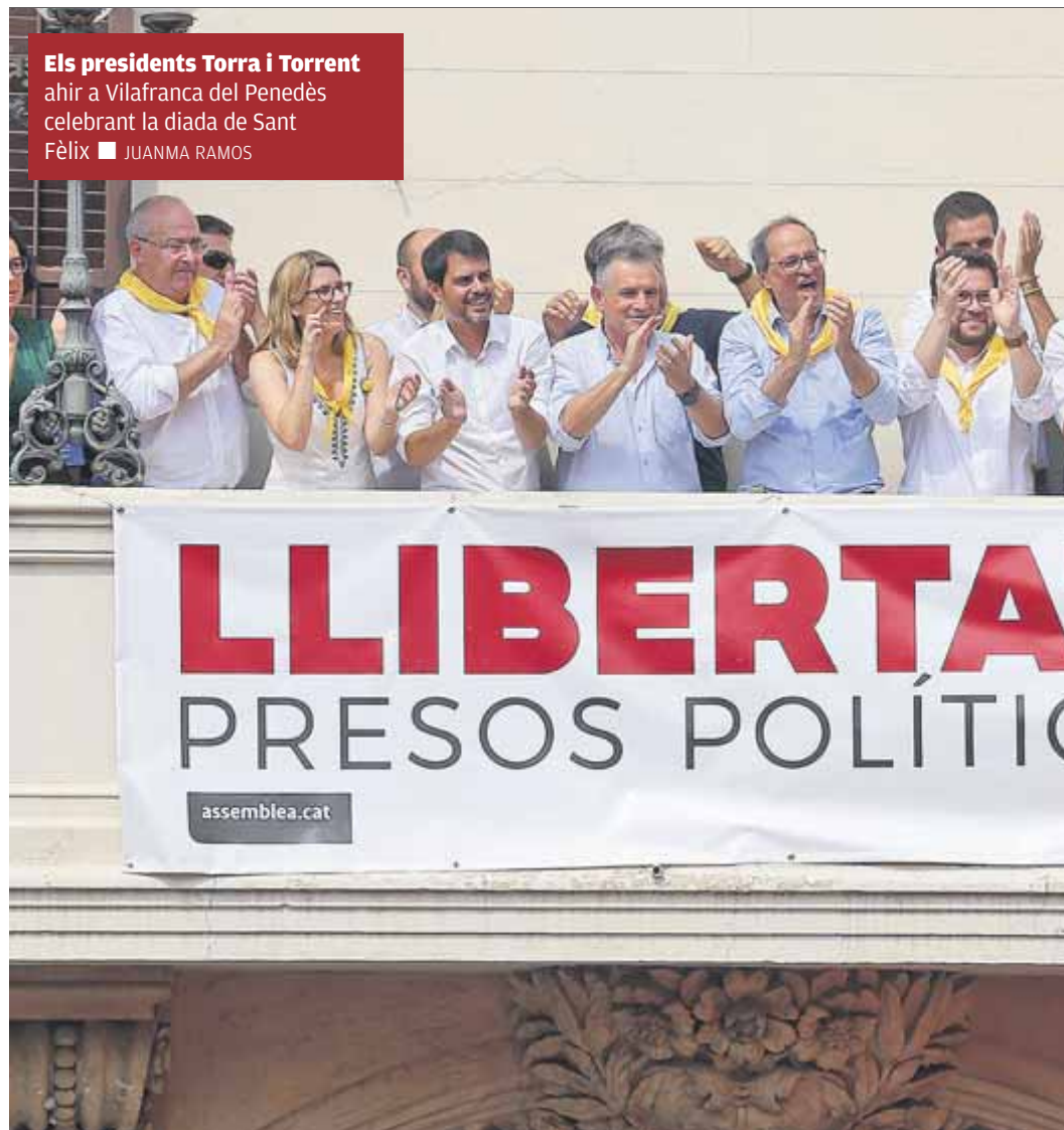
Els presidents Torra i Torrent ahir a Vilafranca del Penedès celebrant la diada de Sant Fèlix

El també adjunt a la presidència d'ERC va defensar que, a parer dels republicans, cal “deixar espai a la política” per “no traslladar als carrers una tensió política que es pot produir entre partits”. En aquest sentit, Aragonès va demanar “un compromís comú de totes les forces polítiques per garantir els drets de tots els ciutadans”.