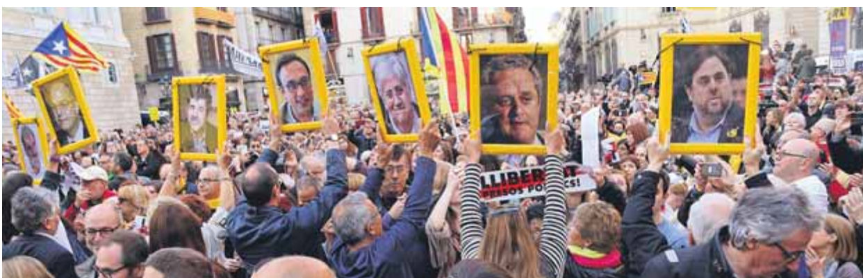
Manifestació en suport dels presos polítics i dels exiliats, a la plaça Sant Jaume, el maig passat ■ JUANMA RAMOS