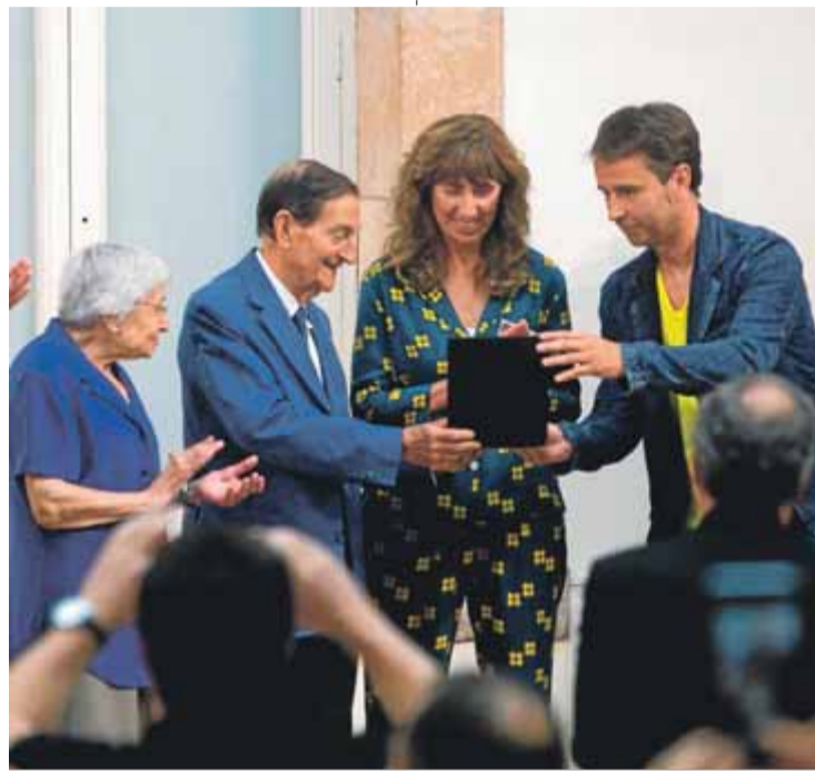
Els representants de l'associació Rosa Sensat amb la medalla que van rebre de mans del president del Parlament, Roger Torrent