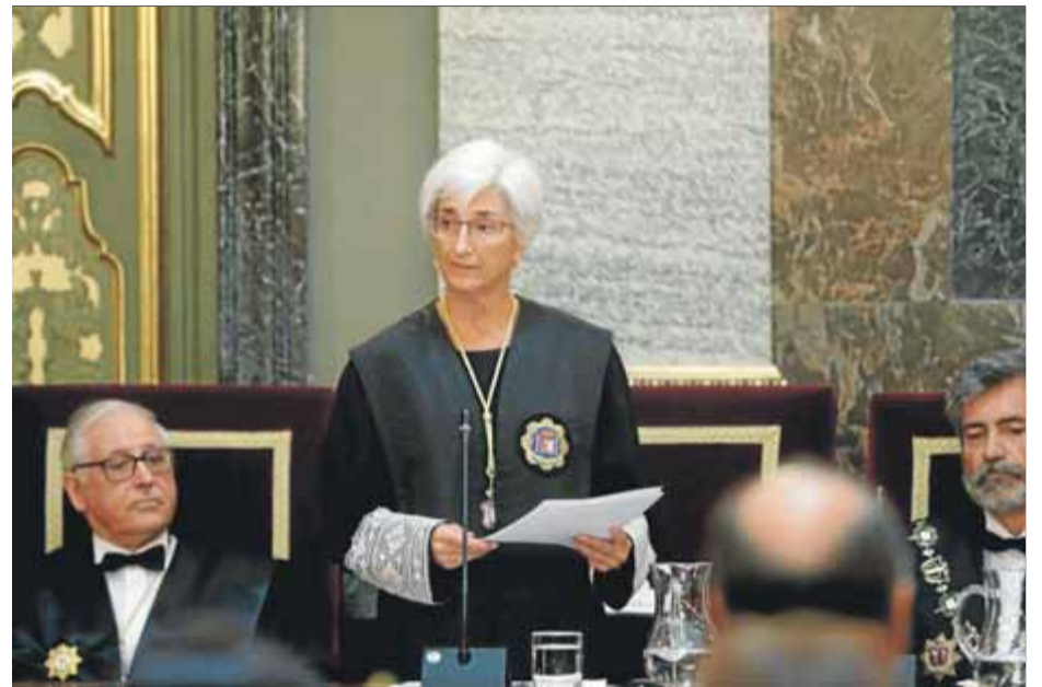
La fiscal general de l'Estat, María José Segarra, ahir, durant el seu discurs al Suprem

Alhora, també va voler deixar clar que compartia l'actuació de la fiscalia després de l'1-O entenent que la resposta que va donar forma part del seu "inequívoc compromís amb el principi de legalitat". Finalment va dir que les aspiracions d'un part de la societat catalana han de canalitzar-se per mitjà de l'ordenament jurídic. "No hi pot haver excepcions a aquesta regla, perquè el contrari