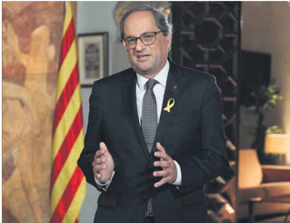
El president Torra, en el tradicional missatge institucional de la Diada

Fent gala dels seus coneixements d'història, el president va partir de