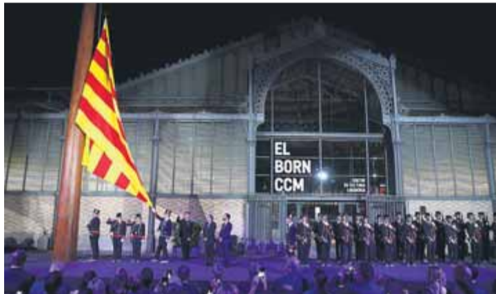
La marxa fins al Palau amb Torra i Colau, la hissada de bandera a la plaça d'El Born i el final de l'espectacle sobre la façana del Palau