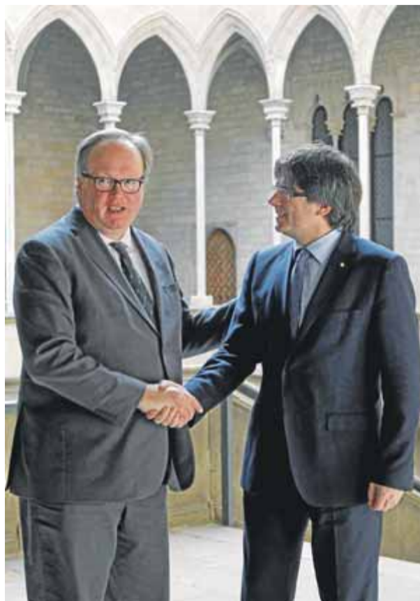
Hans van Baalen, president de l'ALDE, saluant Carles Puigdemont al Palau de la Generalitat l'any 2016

Segons les fonts consultades, una resposta "insatisfactòria" no implicaria l'expulsió directa, però "molt probablement" comportaria que la junta enviaria una "posició ne-