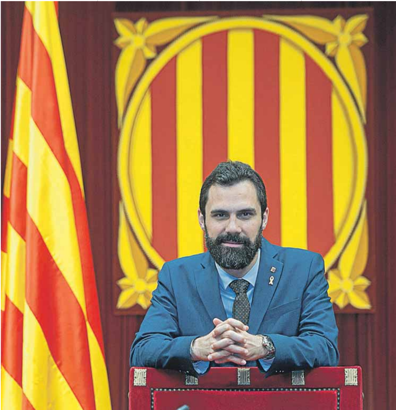
El president Torrent ahir, abans de començar l'entrevista, darrere de la cadira que ocupa a la sala de plens de la cambra catalana ■ JOSEP LOSADA

tègic que explica quina és la nostra proposta de cara al futur més immediat. Hi ha una plena sintonia entre el que plantejava ERC aquest estiu i el president Torra a la conferència. Ara hem de ser capaços tots plegats, i segur que el Parlament és l'espai propici per fer-ho, de fer aterrar aquests plantejaments en el terreny de les mesures concretes.