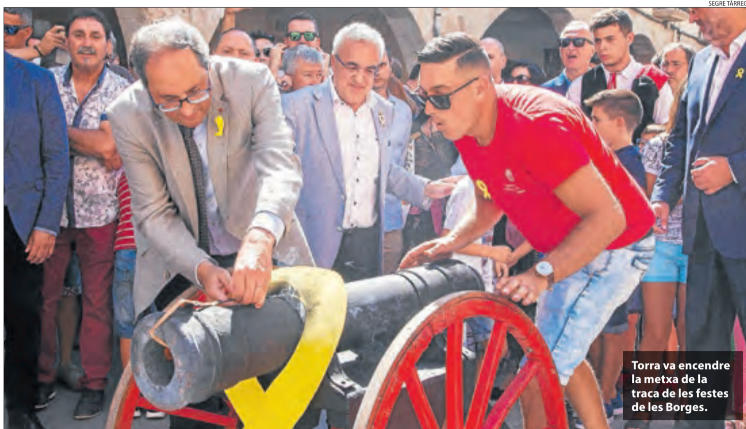
Torra va encendre la metxa de la traca de les festes de les Borges.