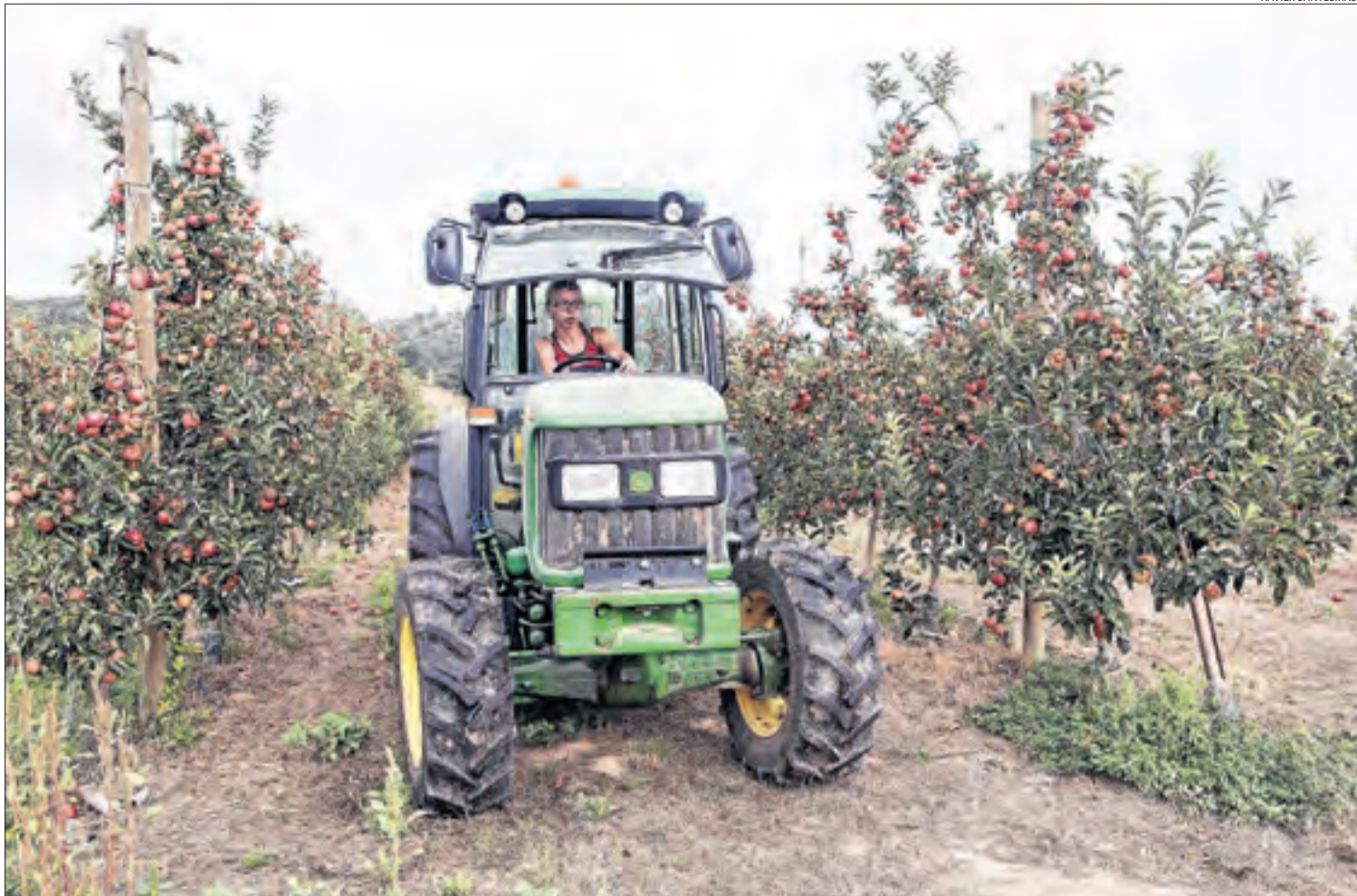
La finca està destinada a la producció de la varietat gala roja.