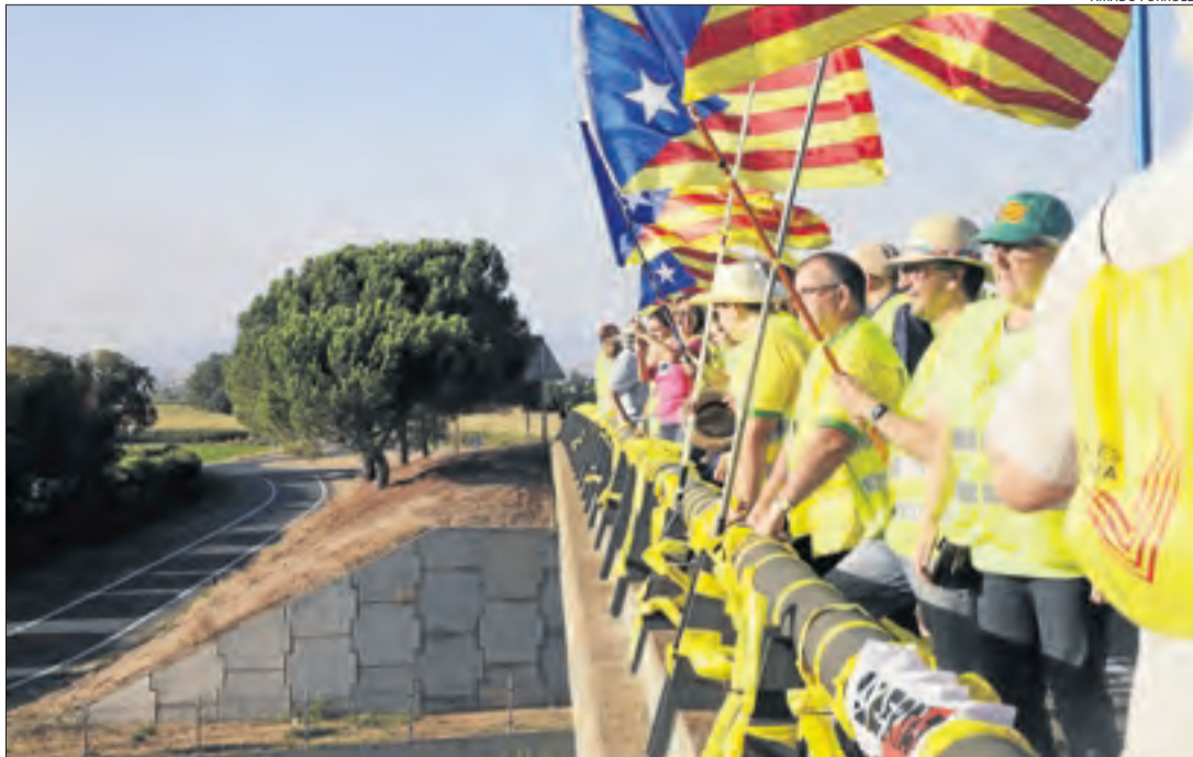
Alguns dels participants a la protesta a l'A-2 al seu pas per Mollerussa.