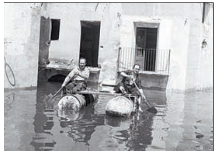
Una de les imatges que el fotògraf ha donat a l'arxiu

El cap de setmana, Montgai s'omplirà de màgia amb les actuacions en 12 escenaris distribuïts pel poble de mig centenar de mags amateurs procedents de diferents punts de Catalunya, de l'Estat espanyol i de l'estranger, com en el cas d'uns professionals vinguts d'Argentina.