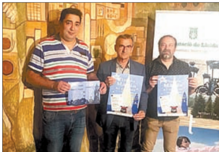
La presentació del certamen d'enguany va ser ahir