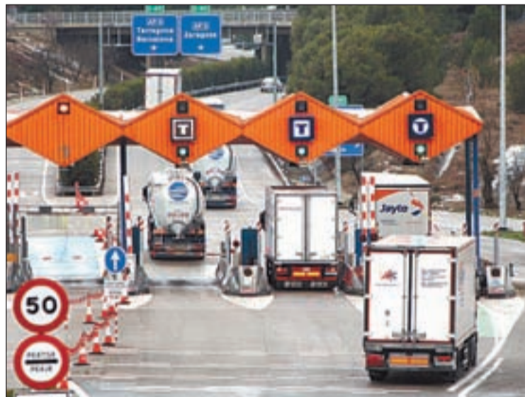
Camions entrant a l'AP-2 a l'altura de les Borges

Les associacions de transportistes també han criticat que les bonificacions que reben els camions per circular per l'AP-7 i l'AP-2 són "reduïdes". Cal recordar que el govern espanyol va aprovar bonificacions d'un 42,53% per als camions en trànsit i d'un 50%