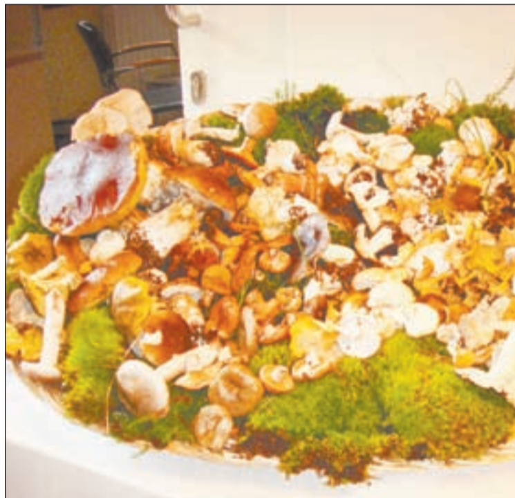
Alta Ribagorça / Set restaurants participen en la mostra culinària.

L'Alta Ribagorça torna a ser referència de la cuina del bolet quan arriba la tardor i aquest any la mostra gastronòmica celebra la seva 24a edició, com sempre, tots els caps de setmana d'octubre. Set restaurants ofereixen uns menús amb apetitoses propostes que es mouen entre la tradicional cuina de xup-xup i les elaboracions més creatives.