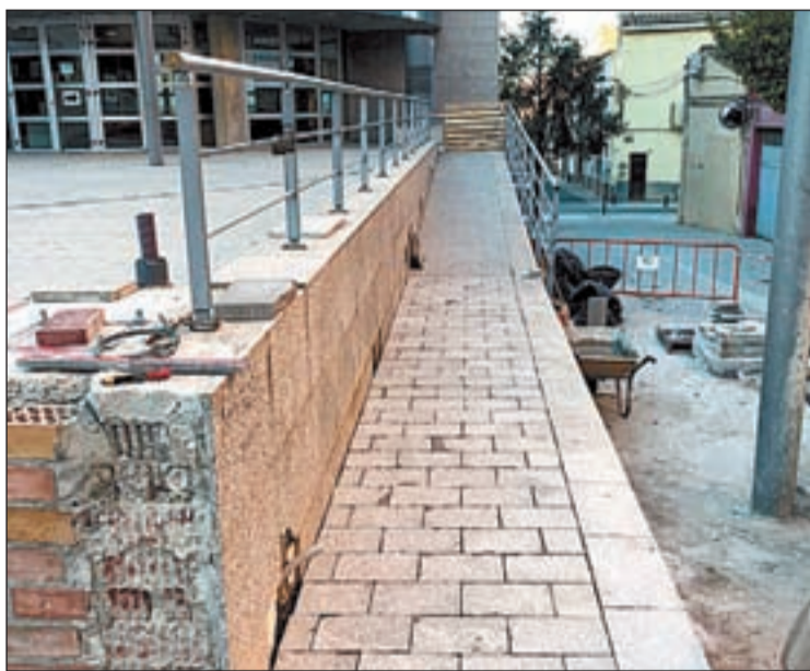
Els treballs que s'estan realitzant a la plaça del Casal

La millora de l'antiga rampa, que tenia accés pel carrer Batlle Simó, l'adapta a persones mobilitat reduïda, ja que té una pendent més suau i dona accés a la