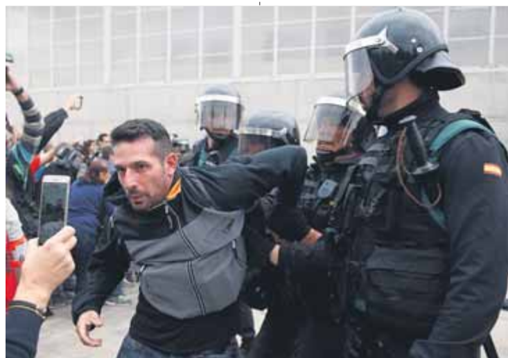
Un agent, retorçant el braç a una persona que anava a votar

La Guàrdia Civil va anar traient la gent i va rebentar la porta del pavelló a cops de mall i amb unes cisalles en van obrir una altra. Un cop a dins, van