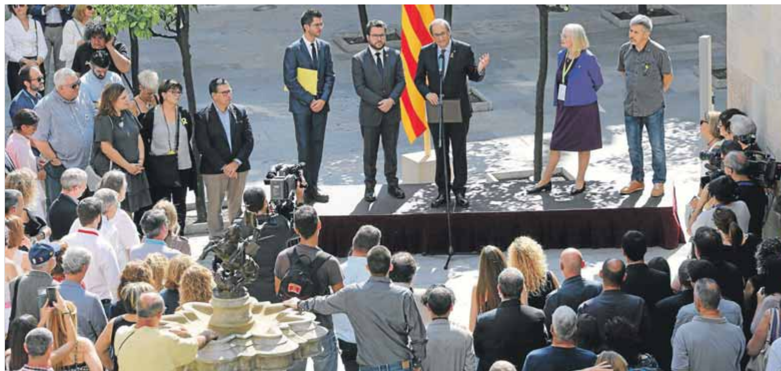
El president Torra i el vicepresident Aragonès, ahir, en l'acte d'homenatge a les víctimes de l'1-O

El president homenatja els afectats per les càrregues policials de fa un any i anima a recuperar l'esperit de l'1-O per fer la república ■ Descarta demanar la dimissió del conseller d'Interior