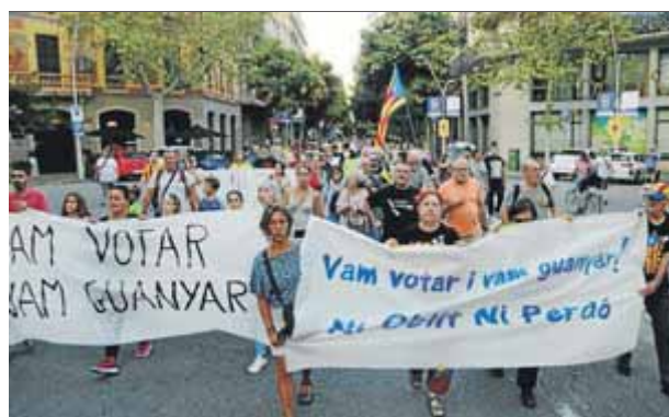
Un moment de la rua de l'1-O, ahir a Barcelona

una furgoneta i van marxar retrocedint a poc a poc mentre la gent els cantava "Passi-ho bé". Per la seva banda, el govern havia declarat el cens universal, decisió que va permetre que tothom que ho volgués pogués anar a votar a qualsevol col·legi electoral, si al seu la policia havia intervingut urnes i paperetes. Aquesta opció va ser usada pel president Puigdemont. Va sortir de casa per anar al col·legi de Sant Julià de Ramis, però sota un pont de l'autopista AP-7 va canviar de cotxe per despitjar els helicòpters policials que el seguien, i va anar a votar al municipi proper de Cornellà del Terri. Posteriorment, al migdia, el president va anar a Sant Julià de Ramis on, enmig d'aplaudiments i mostres de suport, va dir que la brutalitat policial avergonyiria "per sempre" els que l'estaven justificant.