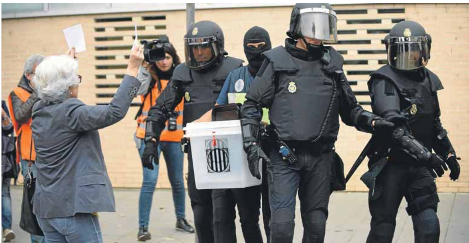
Agents de la policia requisant urnes a l'alberg de Sant Anastasi de Lleida, davant la protesta d'alguns ciutadans que van anar a votar