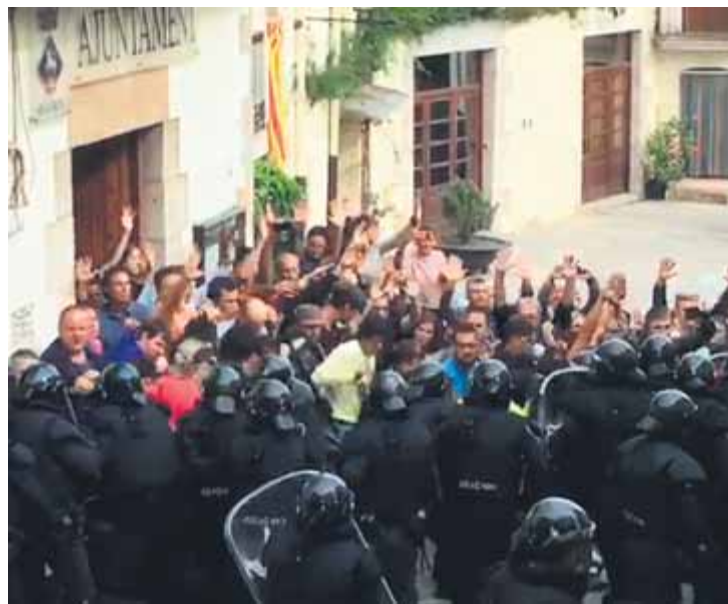
Els veïns d'Aiguaviva , amb les mans enlaire, en el moment que la policia espanyola entrava a la plaça

Els agents van entrar a la plaça parapetats amb els cascos i escuts per enfrontar-se als veïns, que, veient-los apropar-se, es van posar davant l'entrada del consistori amb les mans alçades per oferir una resistència pacífica. Tan pacífica com agressiva va ser la resposta policial: per apartar la gent, els agents de seguida van començar a repartir cops de porra i empentes i van arribar a ruixar alguns dels defensors de l'ajuntament amb un esprai de gas pebre. La Guàrdia Civil va tardar poc més de dos minuts a fer-