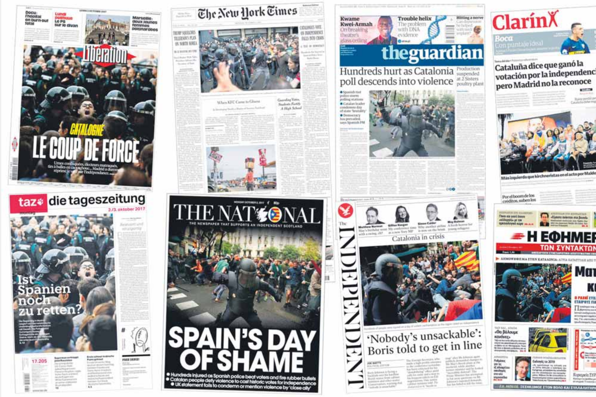
Portades de diferents diaris internacionals l'endemà de l'1-O on apareix destacada la informació sobre el referèndum català