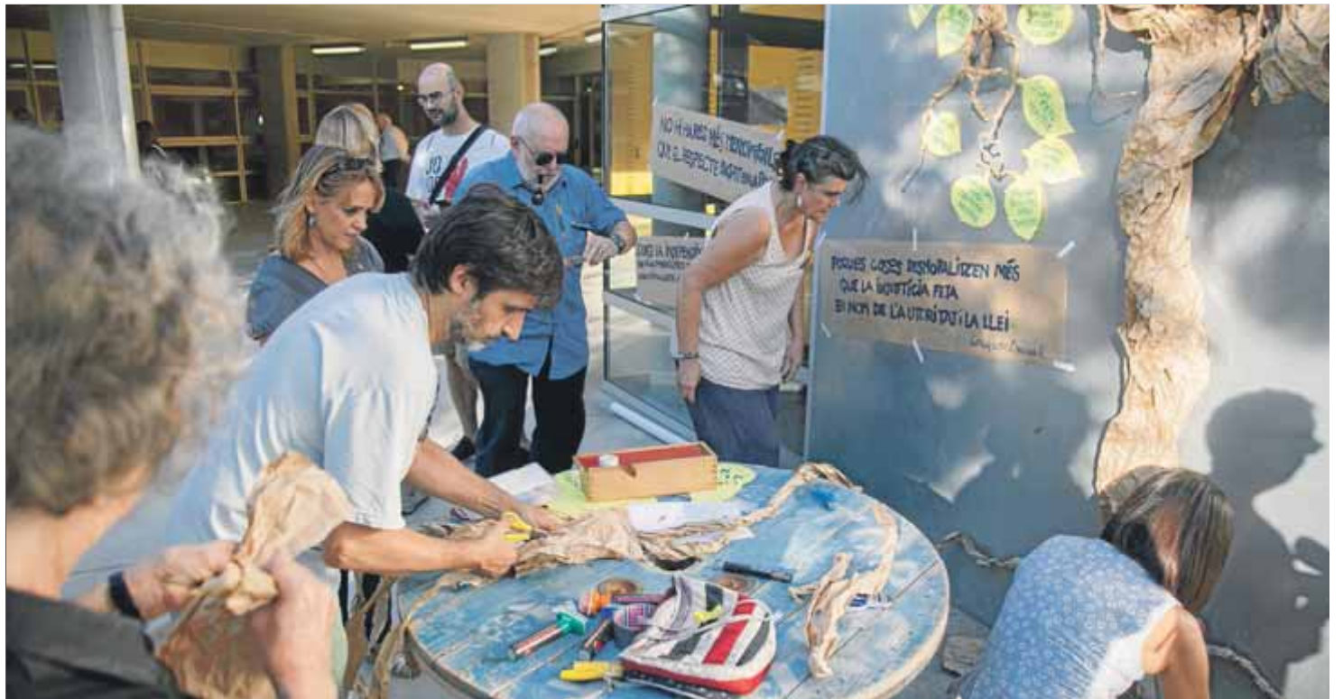
Un moment de les activitats que ahir es van organitzar a l'escola Mediterrània amb motiu del primer aniversari del referèndum

L'INS Jaume Balmes, a l'Eixample, va ser un dels primers de la ciutat on es van veure les imatges dels antiavalots actuant amb fúria per retirar les urnes. El seu equip recorre explica, des de la confidencialitat, que la del referèndum ha estat una qüestió que en cap moment s'ha tractat de manera oficial en reunions del claustre. Ni abans ni després. A les aules, però, i entre el professorat sí que es va comentar el que havia succeït en els dies immediatament posteriors —“A classe, i al conjunt del centre, es pot parlar del que es vulgui i per aquelles dates es van sentir molts plors i va haver-hi moltes abraçades”—, tot i que, amb el pas del temps, aquell record s'ha anat desdibuixant progressivament. En aquest context, la direcció ha fet seva la tesi que si hi havia d'haver algun acte com-