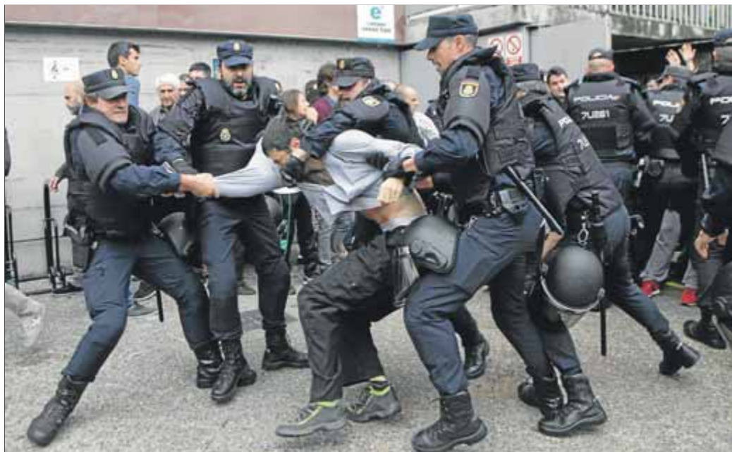
Cinc agents de la Policia Nacional, reduint un votant a les portes del col·legi Bruguera, de Girona

El primer a rebre als pocs minuts d'obrir a les nou del matí va ser el col·legi Bruguera de Girona. Fins allí es van desplaçar un grup