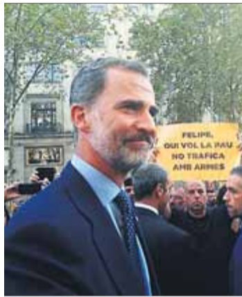
Felip VI