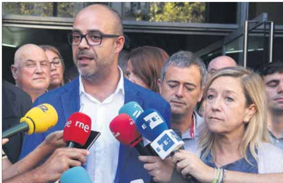
Buch i Lloveras, el setembre passat ■ ACN

L'alcaldessa de Vilanova i la Geltrú va insistir ahir, per mitjà d'un missatge a la xarxa social Twitter, que es tracta d'una "querella per fer po-