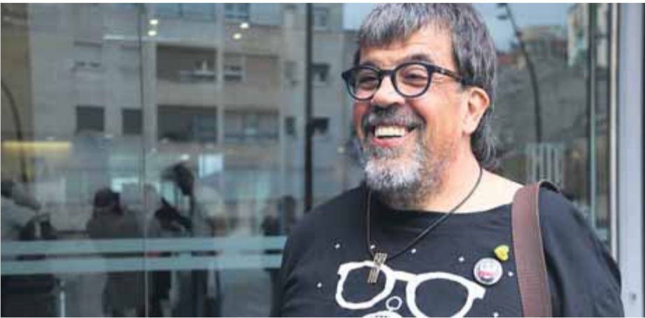
Pesarrodonna sortint de declarar del jutjat de Manresa dimecres passat