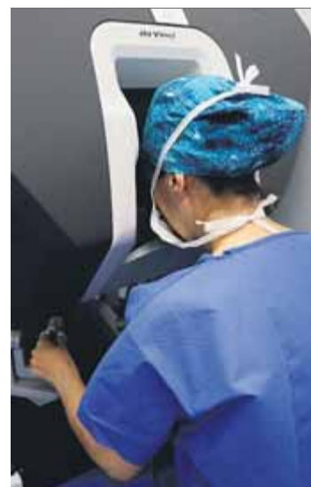
El robot 'Leonardo' per operar, a la Vall d'Hebron

Va ser il·lusionant que volguessin col·laborar amb nosaltres, que som un instrument al servei del sistema de salut català. La