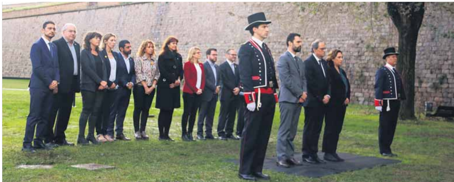
Torra, Torrent, Colau i membres del govern, ahir, al Fossar de Santa Eulàlia del castell de Montjuïc, on van afusellar Companys el 15 d'octubre del 1940

■ El president recorda que ni la monarquia ni cap govern espanyol han condemnat l'assassinat de fa 78 anys ■ El cap de l'executiu promet lluitar "amb totes les conseqüències" pels ideals de l'afusellat