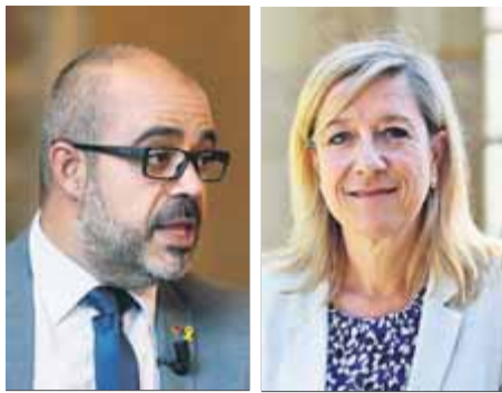
Buch i Lloveras, en fotografies d'arxiu

El TSJC estudia el conseller d'Interior i l'expresidenta de l'AMI per haver promogut el referèndum