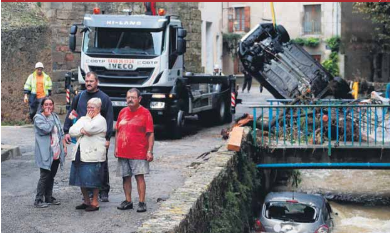
Uns veïns observen els bombers durant les operacions de rescat al municipi occità de Villegailhenc

MENTIDA • Les defenses volen evidenciar les falsedats de les proves aportades per la Guàrdia Civil i presentar-ho al judici