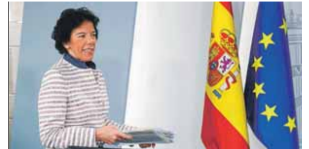
La portaveu Celaá, al final del Consell de Ministres que va enviar el quadre pressupostari a Brussel·les

Deslliga els comptes de la “població reclusa” La fiscal vol que la deixin fer