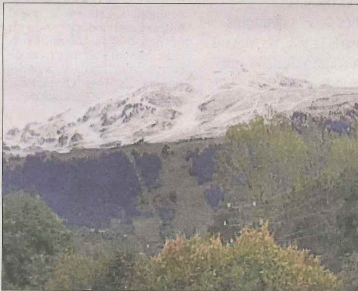
A Baqueira els cims van quedar coberts per la neu.

LEIDA | Dissabte a la matinada i diumenge van arribar les primeres precipitacions que van tenir de neu les cotes altes de les comarques del Pirineu. Des de diumenge, la baixada de les temperatures va ser general a tot Catalunya i a les comarques de muntanya es va traduir en diversos centímetres de neu. La nevada va ser escassa i va deixar entre mig centímetre i dos centímetres i mig de neu com és el cas de Certascan, on es van acumular fins a 2,6 centímetres. A la Bonaigua es van registrar fins a 3,1 centímetres i a Salòria, a 2.400 metres, fins a 4,2 centímetres de neu. Ahir