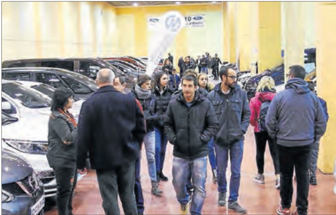
La Fira Autotardor de Mollerussa va tancar ahir el certamen amb bons pronòstics.