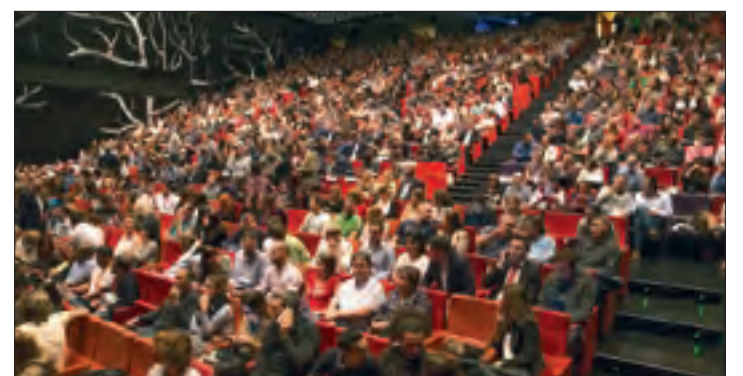
Conferència de Victor Küppers a l'Auditori de Lleida.

passant per pimes i despatxos professionals que encara han de professionalitzar recursos i digitalitzar entorns, sense oblidar-nos de l'Administració Pública, on en ajuntaments, hospitals i altres entitats, que mouen molta documentació i informació als qual es destinen molts recursos, han de disposar dels instruments necessaris per tal de portar un millor control. És indispensable que la societat en el seu conjunt adopti els mecanismes de la transformació digital per millorar els fluxos d'informació i aconseguir que l'activitat sigui més rendible, sostenible i eficient."