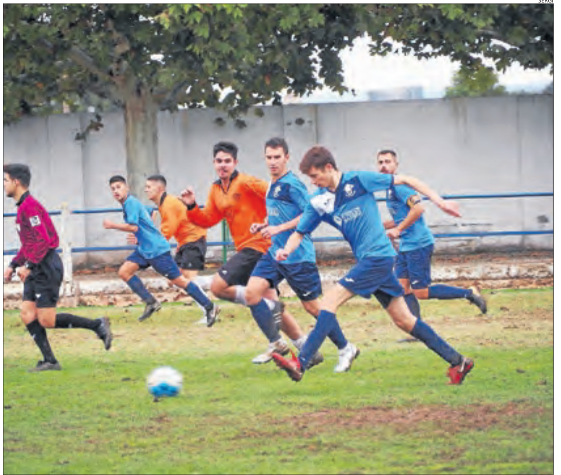
Una jugada del partit d'ahir entre l'Ivars d'Urgell i la Seu d'Urgell.

JAUME GIRIBERT | La Seu d'Urgell va derrotar l'Ivars d'Urgell al seu camp per 1-2. Colell va obrir la llauna tot just començar el matx, agafant desprevingut el conjunt local. Abans d'arribar al final dels primers quaranta-cinc minuts, Del Àguila anotava el segon gol al minut 39. Després del descans, a la segona part l'Ivars d'Urgell va buscar la rèplica creant moltes ocasions de gol però la diana no va arribar fins al minut 77, obra de Xes. Els locals van buscar posar contra les cordes la Seu, i ho van aconseguir obtenint un penal en els últims compassos del partit. L'Ivars va errar la pena màxima i va desapropiar l'oportunitat d'empatar el derbi en el tram final.