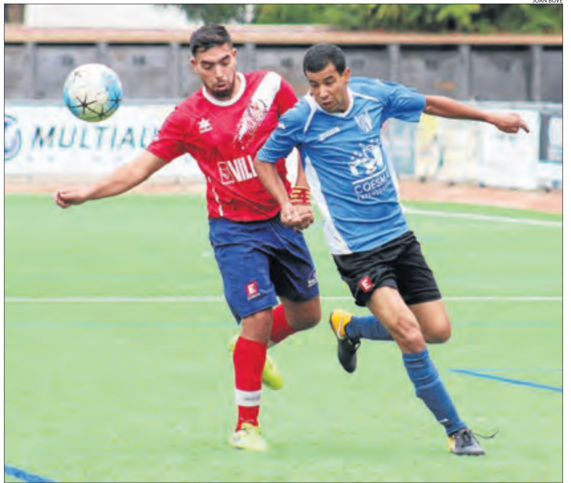
Una jugada del partit que van disputar ahir el Balaguer B i el Sant Guim.

JOAN BOVÉ | BALAGUER | El Balaguer B i el Sant Guim van disputar un duel molt igualat i amb poques ocasions de gol que va acabar en empat 0-0. Gran part del partit es va jugar al centre del camp i els dos van intentar sorprendre al contraatac sense tenir sort. A la primera part va dominar el Balaguer B, que va estar molt ferm en defensa i va controlar la pressió del Sant Guim al centre del camp. A la segona meitat, els visitants es van relaxar, però l'equip local no va saber aprofitar-ho i no va aconseguir anotar cap gol. Després de l'encontre, el Balaguer B baixa a la quarta posició de la classificació i, el Sant Guim es manté a la cinquena.