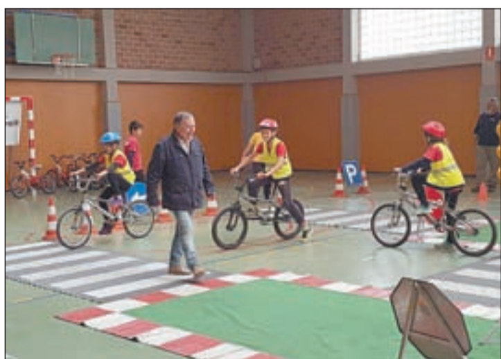
Els nens aprenen a conduir de forma responsable

Per contra, també hi ha sis municipis que retenen menys de la meitat dels nens i nenes, els quals són Teià, Alpocat, Sarrià de Ter, Tiana, Santa Cristina d'Aro i Sant Antoni de Vilamajor.