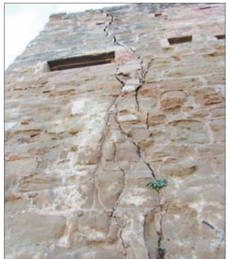
La grieta recorre todo el muro

El portal se estrenará el primer trimestre del próximo año y se podrá utilizar la moneda virtual 'molleuro'