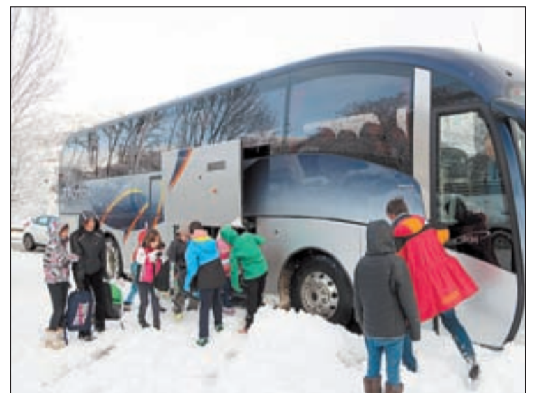
Imatge d'arxiu del transport escolar a Llessui-Sort

Per entendre aquestes dades pertanyents a les Terres de Lleida, cal fer una mirada global a la situació escolar actual de tot Catalunya. En el darrer curs, els centres educatius catalans han rebut un total de 1.218.873 alumnes.