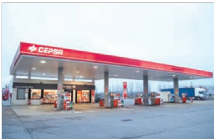
El preu de la benzina va disparar l'IPC d'octubre

Els preus van pujar l'1,1% a l'octubre a Lleida en relació amb al setembre i van enfilars la inflació anual fins al 2,9%, dues dècimes més que al setembre, la més alta d'aquest any a la demarcació de Ponent i la més alta a tot l'Estat, segons dades facilitades ahir per l'Institut Nacional d'Estadística (INE). A Catalunya, els preus van pujar nou dècimes i van deixar la inflació en el 2,4%, una dècima més que al setembre. Els preus a l'octubre van estar marcats sobretot per l'alça de les gasolines, que van pujar més que el mateix mes de l'any passat, i la cistella d'oci i cultura, on els paquets