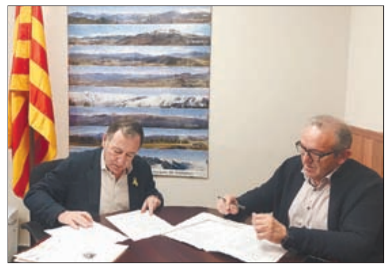
Moment en què es va signar, de nou, el conveni

Aquests productes s'adrecen als nens i nenes escolaritzats i als veïns amb més de tres anys d'empadronament. Així mateix, es posen a la seva disposició a preus bonificats amb l'objectiu