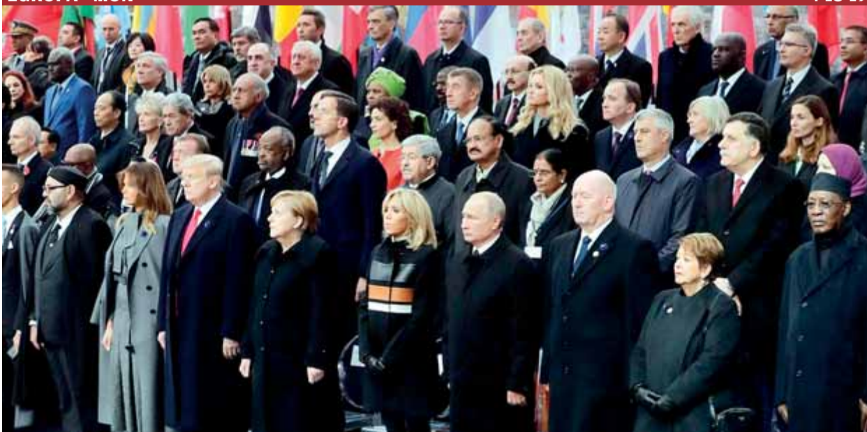
Els dignataris internacionals reunits ahir a París per commemorar el centenari de l'armistici