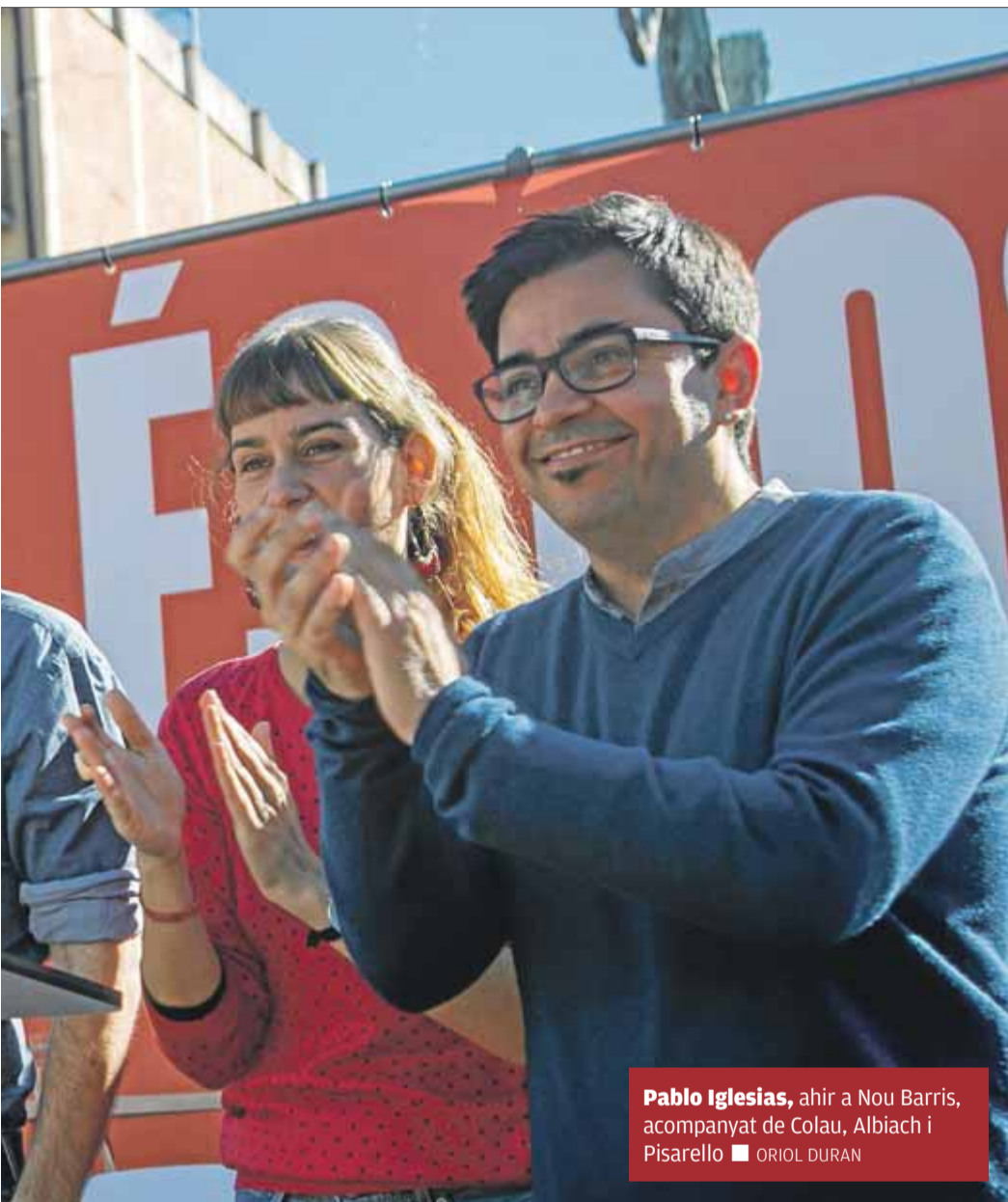
Pablo Iglesias, ahir a Nou Barris, acompanyat de Colau, Albiach i Pisarello

PDeCAT que no doni suport als comptes estatals i alhora "mantingui reunions bilaterals" per treballar la reforma laboral i posar-se d'acord per apro-