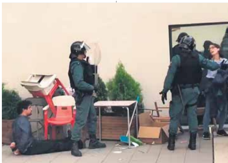
El jove emmanillat a Fonollosa per l'1-0