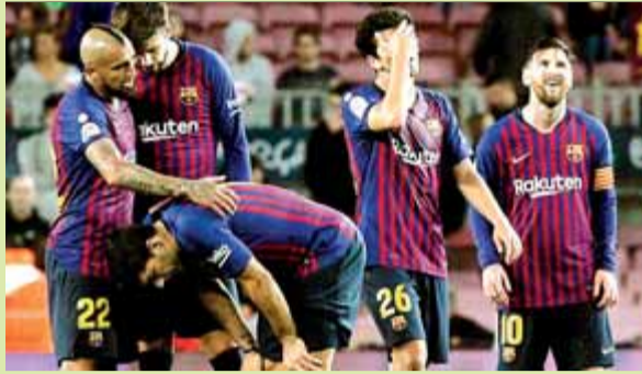
Una expressiva imatge del final del partit

L'Espanyol es deixa remuntar al camp del Sevilla (2-1) i no pot atrapar el Barça