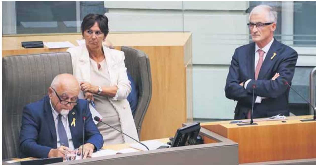
Jan Peumans, president del Parlament flamenc, i el president de Flandes, Geert Bourgeois (dreta), el 17 d'octubre