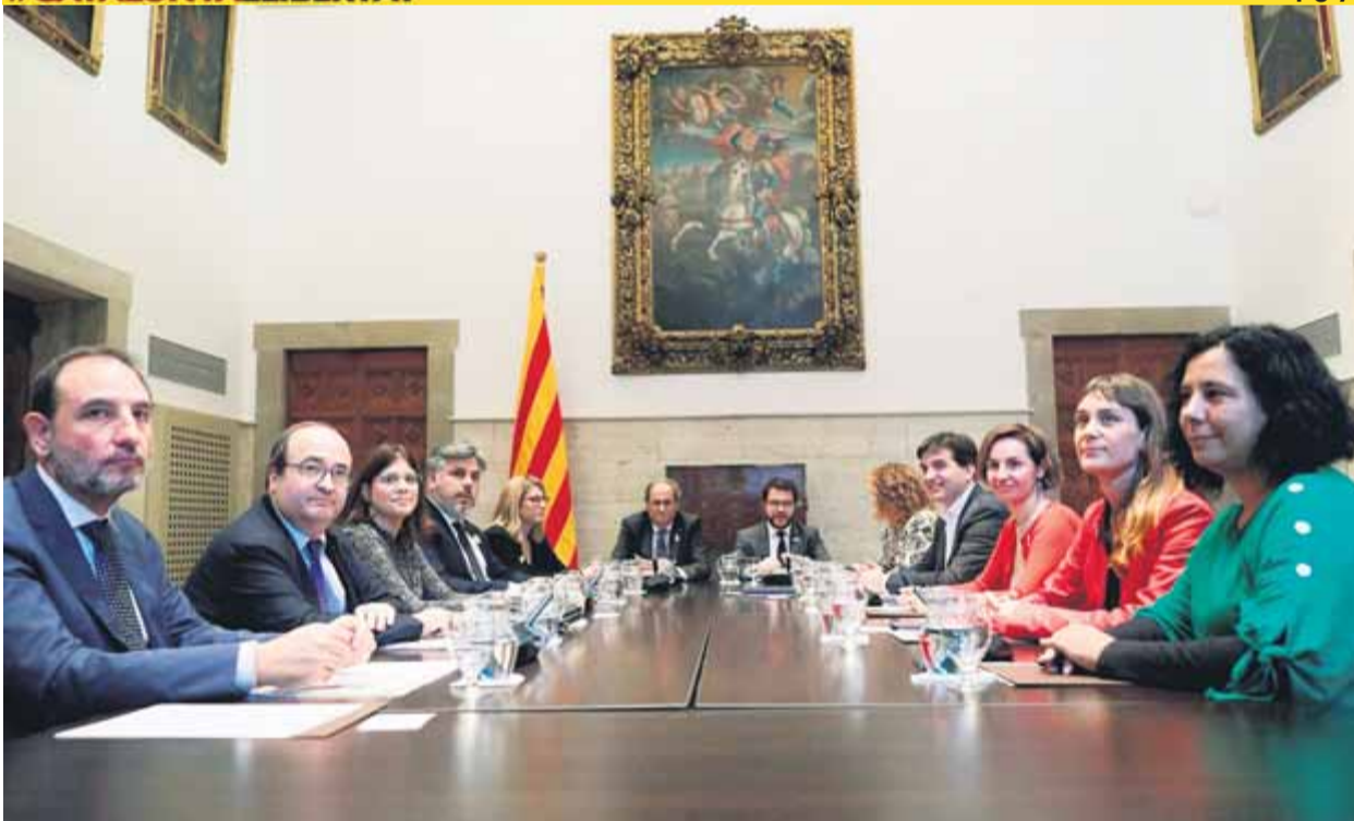
Els participants en la reunió d'ahir, moments abans que comencés