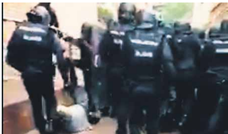
Agents de la policia espanyola donen cops i puntades de peu a un veí de Nou Barris -fins i tot quan cau a terra- que volia votar l'1-O a l'escola Àgora ■

L'inspector en cap i responsable d'actuar en set locals va detallar al titular del jutjat d'instrucció 7 de Barcelona que els van donar la llista dies abans i