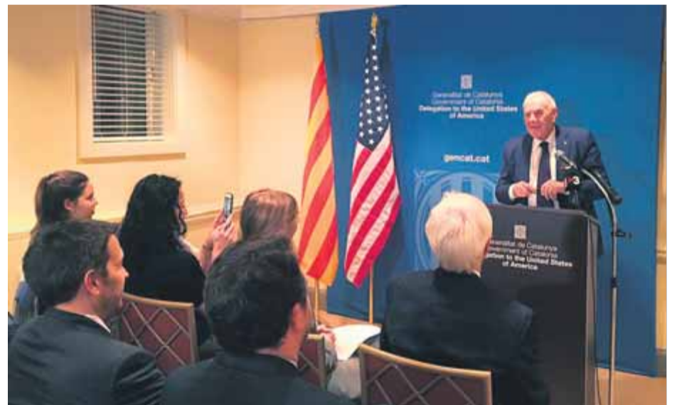
Maragall durant la reobertura de la delegació als Estats Units

ra a Washington, és exactament la mateixa que l'agenda de Barcelona (...) No ens resignem a cap tipus de silenci", va afegir-hi. Maragall va explicar que aquesta agenda es basa en aquests moments en conceptes com "democràcia i llibertat" i que una de les funcions de la delegació serà difondre la situació dels polítics independentistes que estan en presó. "Aquesta situació afecta de ple les institucions i la societat catalana i seria absurd que això no estigués present en la nostra manera de representar la societat catalana", va afirmar. També va assegurar que la delegació