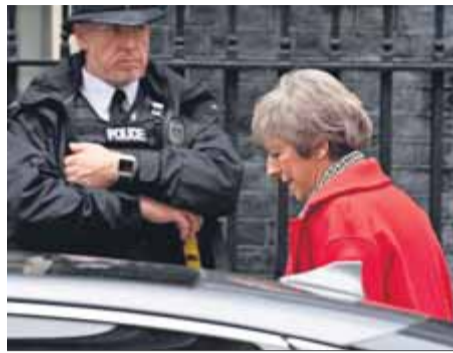
May, ahir a Downing Street

La primera ministra nomena dues persones de confiança per reemplaçar els dimissionaris