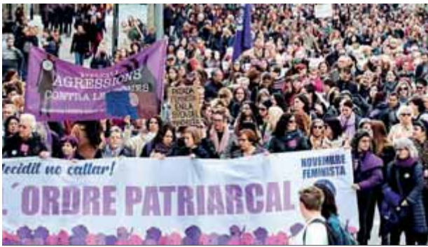
La manifestació d'ahir a Barcelona