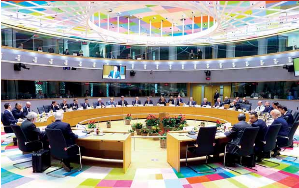
Els 27 caps d'estat i de govern de la UE, ahir a la seu del Consell Europeu de Brussel·les per aprovar l'acord del 'Brexit'

DIÀLEG • El govern manté els pressupostos oberts, mentre negocia amb tots els sectors