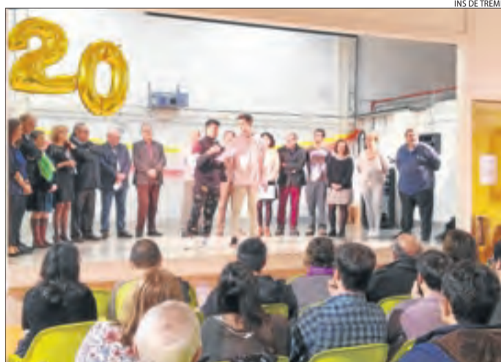
Un moment de la celebració a l'institut de la capital del Jussà.