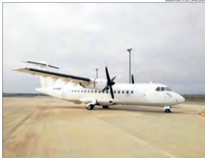
El primer avió de la companyia portuguesa ahir a Alguaire.

Es tracta de la primera vegada a la història d'aquesta infraestructura lleidatana (que es va estrenar l'any 2010) que una aerolínia decideix aparcar avions i comercialitzar-los des d'Alguaire. Aquesta activitat es podria anar consolidant i se suma a les que ja acull actual-