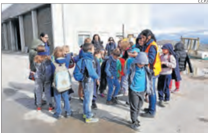
Alumnes del Jussà visiten l'abocador ■ Alumnes de les escoles de la Vall Fosca i de Salàs van visitar l'abocador comarcal per prendre consciència de la importància del reciclatge.

S'ha de recordar que la intervenció s'ha demorat en diverses ocasions, l'última, per l'augment del cabal del riu arran de les intenses pluges. Els treballs van començar a l'estiu amb la intenció de tenir-los llestos per a primers d'octubre, encara que el termini s'ha anat retardant per diverses causes, principalment les intenses pluges.