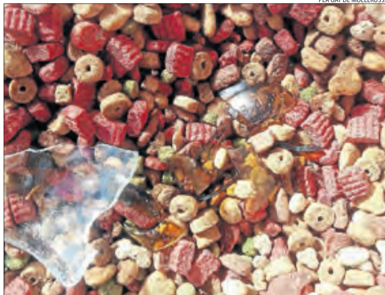
Imatges amb els vidres dipositats a l'interior de les menjadores per als gats.