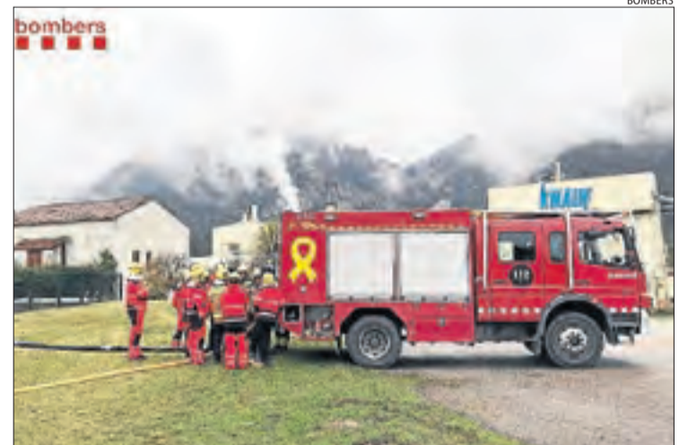
L'activitat va tenir lloc ahir al matí a Guixers.