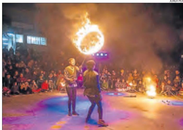
Un dels espectacles que es van poder veure ahir a Talarn.