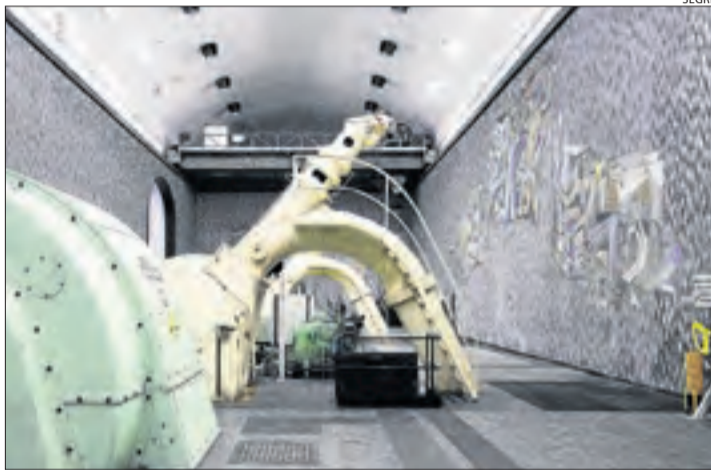
Imatge d'arxiu de l'interior de la central de Llavorsí.

El consell compta amb una partida de 333.781 euros que distribuirà en funció de les inversions que faci cada ajuntament i la quantia de les obres que vulgui dur a terme. Sub-