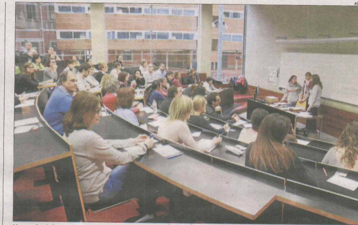
Una aula del campus de la Ciutadella de la UPF amb metges que s'examinen.

nució de la càrrega assistencial, i limitar a 28 les visites diàries per consulta -ara són fins a quaranta-, la reposició de 920 professionals i la recuperació del poder adquisitiu, que xifra prop d'un 30 per cent. A més, avui a les 11.00 hores hi ha convocada una manifestació a Barcelona, a la qual acudirán metges de Lleida. Cal recordar que la sobrecàrrega laboral a