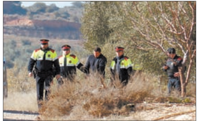
L'acusat, el dia de la reconstrucció dels fets a Aspa

El lletrat de les famílies dels dos agents rurals va demanar fa uns dies a l'Audiència de Lleida que se celebrés aquesta compareixença, prevista pel dia 21, per demanar aquesta mesura. I és que explica que la presó provisional està prevista per un màxim de dos anys, prorrogable en algunes circumstàncies. I que precisament el dia que començarà el judici (el 21) és la data en la que