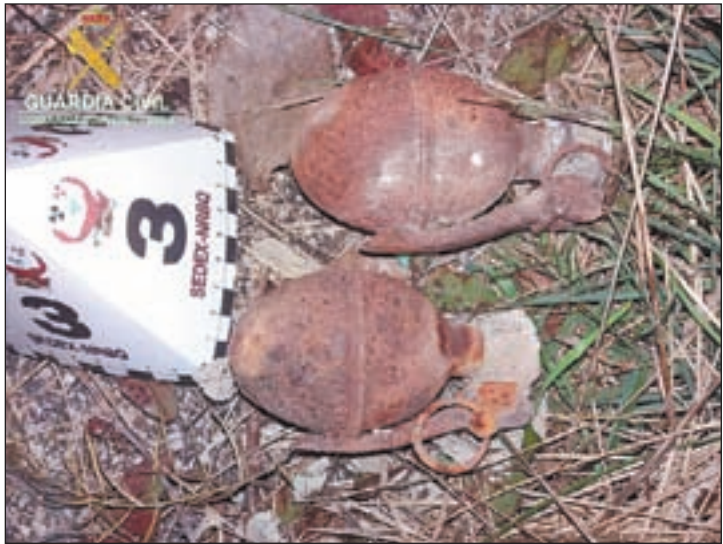
Les granades eren suposadament de la Guerra Civil