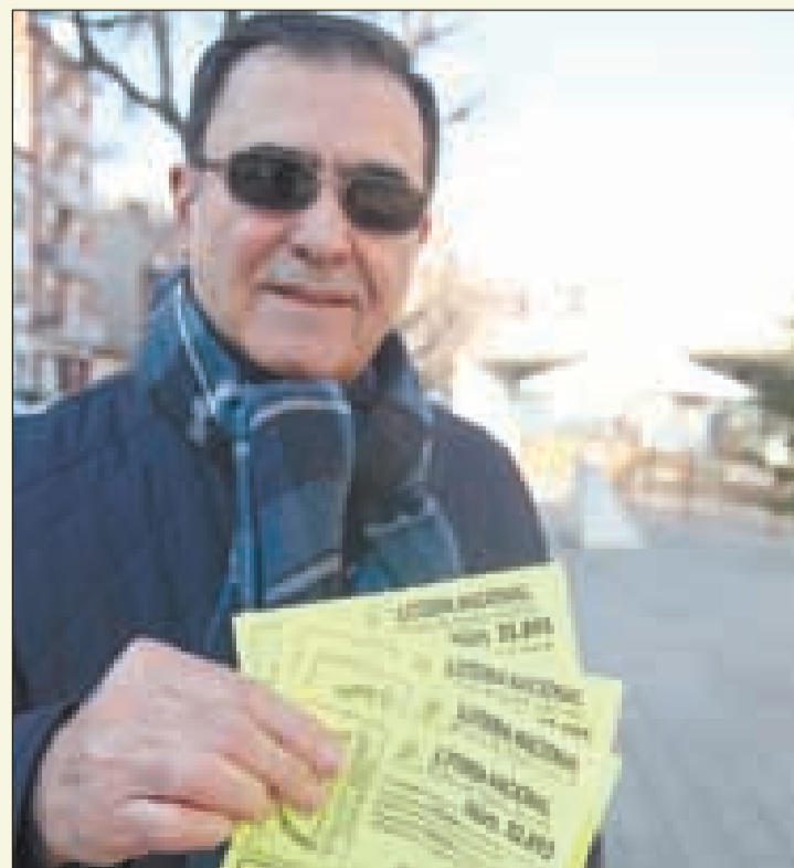
L'associació de veïns va repartir la participació

A Catalunya la xifra és inferior, per sota dels 13 euros, una despesa semblant a la d'Extremadura.