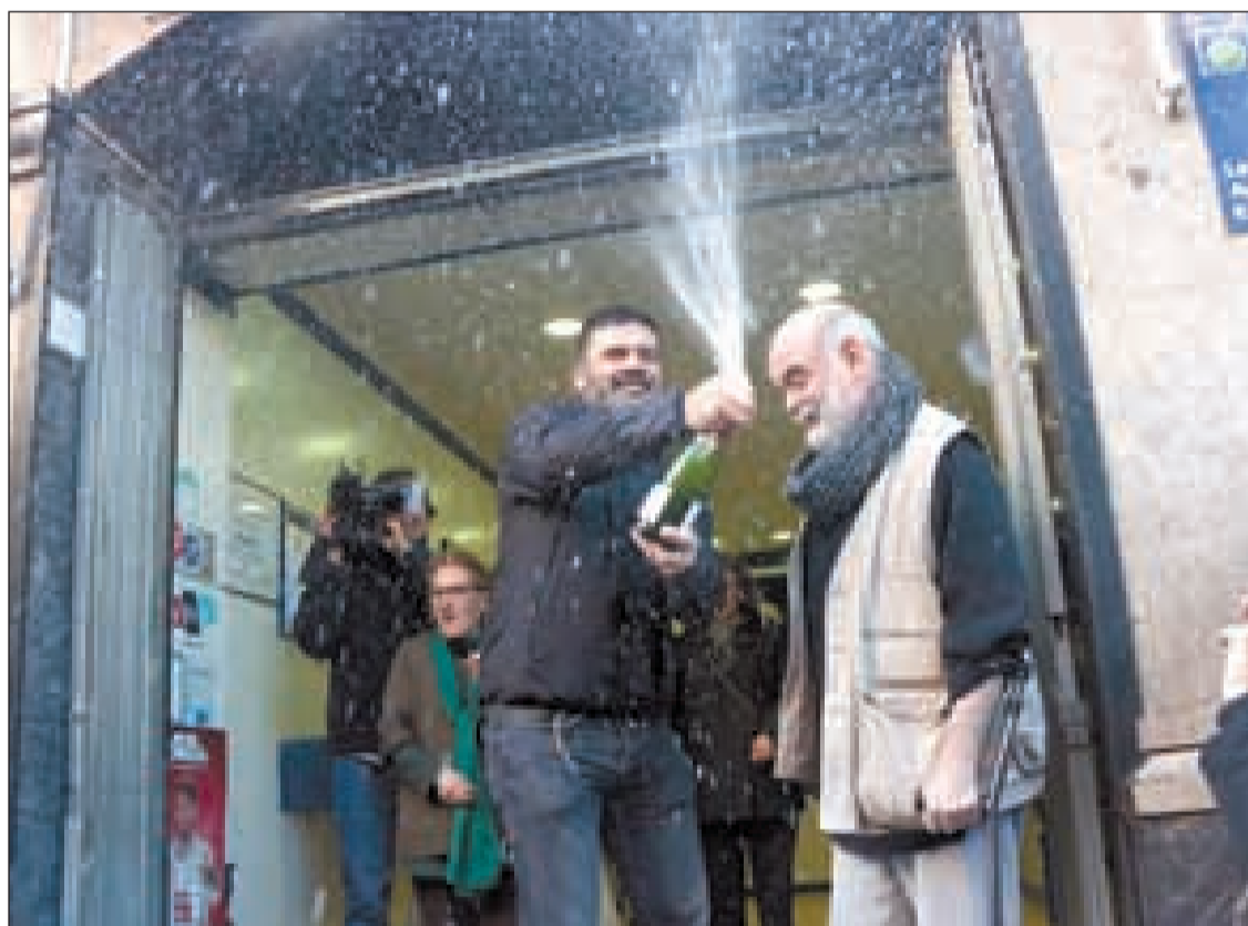
Dos homes celebrant ahir el primer premi que va recaure a la ciutat de Barcelona

I de moment la darrera vegada que va recaure el primer premi a terres lleidatanes va ser l'any