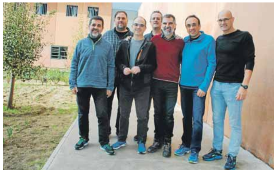
Els set presos tancats a Lledoners que seran traslladats a una presó de Madrid ■ ÒMNIMUM