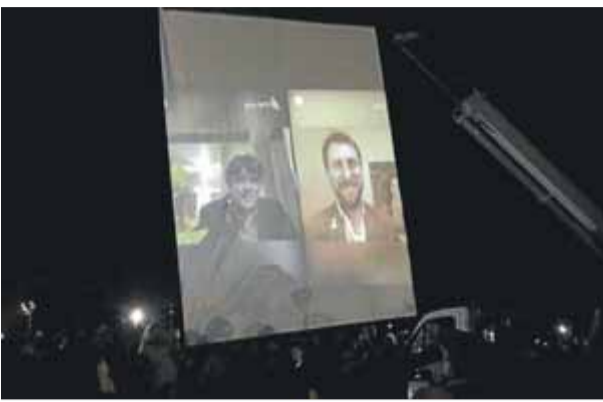
L'esplanada de Lledoners es va omplir per centenars de persones que van escoltar Puigdemont i Comín ■ JUNTSXCAT