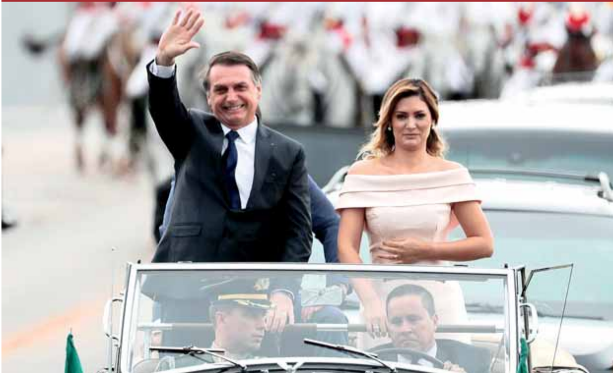
Bolsonaro, amb Michele (la seva esposa), saludant la gent mentre es dirigeix al palau presidencial, a Brasília