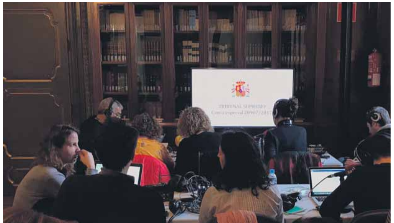
Periodistes de ràdio segueixen la vista prèvia del judici contra els independentistes catalans a través de pantalles instal·lades a la biblioteca del Suprem

PRECEDENT • El primer judici retransmès va ser el dels vestits de Camps