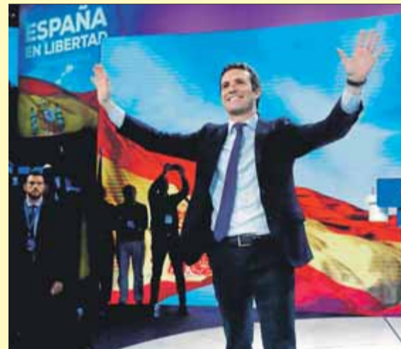
El líder del PP aclamat en la convenció del partit