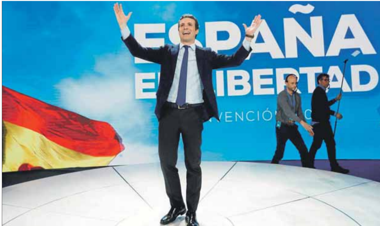
Pablo Casado va cloure la convenció del PP ahir al pavelló d’Ifema amb un discurs dur sobre Catalunya

Amb José María Aznar present a la primera fila i amb Mariano Rajoy absent en compliment del seu règim d’incompatibilitat i com a prova que el