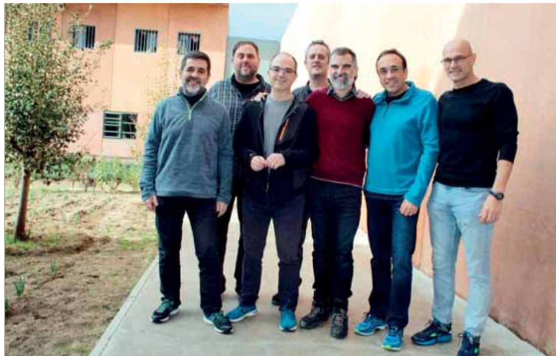
Imatge dels presos polítics homes a la presó de Lledoners

Ara que aviat deixarem la presó de Lledoners, ara que deixarem la nostra estimada terra per anar durant força temps a una nova presó de Madrid i d'allà al judici, ara que no sé quan podré tornar a fer un escrit d'opinió, no me'n puc estar, d'expressar i abocar tot el cúmul de gratitud i compromís vers tantíssimes persones per defensar tant i arreu tot allò que ens ha portat a la presó. Necessito deixar testimoni per escrit del sentiment de gratitud infinita a tantes i tantes persones de tota mena de condició, edat, origen i pensament per ser-hi aquests mesos. Per enviar-nos milers de cartes d'escalf i de suport. Per venir aquí a fora, a l'esplanada de Lledoners. Per cantar. Pels vostres clams. Per desitjar-nos cada dia, sens falta, una càlida bona nit. Per fer-nos companyia en les dates més asenyalades de Nadal. Per pujar cims, per córrer quilòmetres, per fer llargues caminades, motorades, per interpretar melodies a peu de carrer, per fer trobades castelleres, per fer hores de ràdio, per organitzar dejunis, per organitzar infinitat de sopars grocs, per portar i penjar llaços grocs. Per ser regularment a les places de tots els racons de Catalunya. Per no deixar-nos, ni per un minut, sentir-nos sols. Gratitud infinita per unes famílies, les nostres, que hauríem de tornar a néixer molts cops per tenir temps d'atrapar-les en la serenor i la fortalesa demostrada. Gratitud per fer, no per desfer, tantes i tantes coses, immenses o simbòliques, multitudinàries o en petits grups,