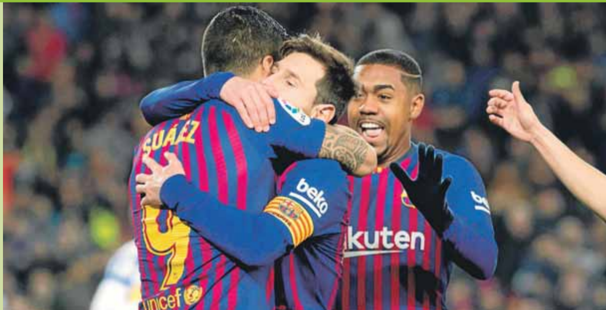
Messi i Suárez s'abracen després de protagonitzar el 2-1 que decantava el marcador del partit, ahir al Camp Nou