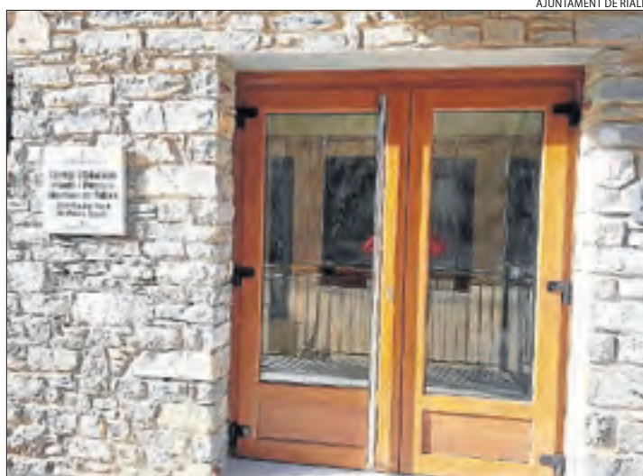
S'ha canviat la porta de l'entrada al centre.