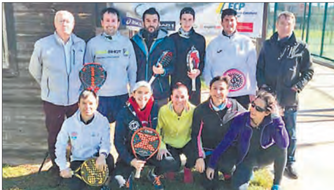
El Master Provincial de Lleida se disputó en formato de liguilla