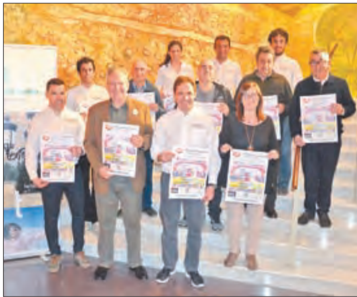
La organización presentó los números de esta temporada

En ajedrez, a la espera de la celebración de la fase territorial en Bellvís el día 6 de abril, se celebran diferentes encuentros en las categorías de juvenil, cadete,