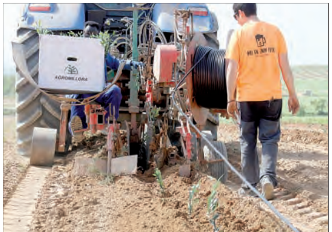
Procés de plantació d'olivers en una finca d'Alfés de l'àrea del Segarra-Garrigues

va ahir que la DOP "ha de créixer ja que som molt petits i si ens volem internacionalitzar i obrir nous mercats ho hem de fer".