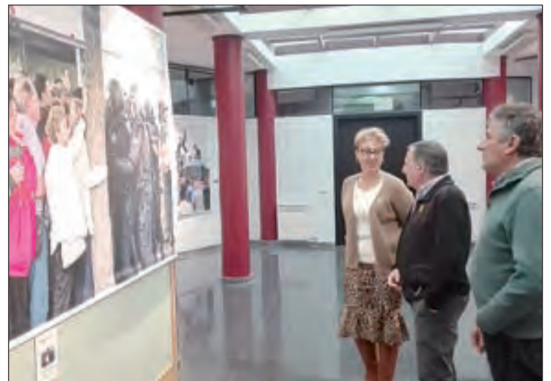
L'equip de govern visitant ahir l'exposició

togràfica sobre els fets de l'1 d'Octubre, després del seu pas per la UdL on no va estar exempta de certa polèmica. A l'Epicentre es podran veure fins el 28 de febrer 14 de les fotografies de gran format que integren l'exposició i que volen ser una mostra dels aconteixements de l'1 d'Octubre sota la mirada de 14 fotoperiodistes de mitjans de Lleida.