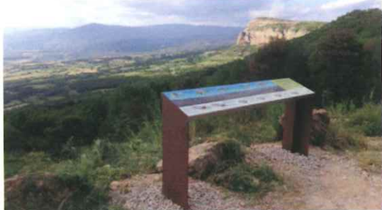
Exemple de faristol interpretatiu ubicat al coll de Comiols. Mirador als estanys de Basturs