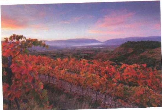
Vinyes de la conca de Tremp

Del 18 al 22 de novembre, l'Espai Provença de Ferrocarrils de la Generalitat de Catalunya (ubicat al carrer Rosselló 219 de Barcelona) acollirà una exposició sobre el Pallars Jussà on es mostraran els principals atractius turístics de la comarca. Durant la setmana també es podrà veure in situ com treballa una restauradora amb les recents troballes dels jaciments paleontològics de la Conca de Tremp, i