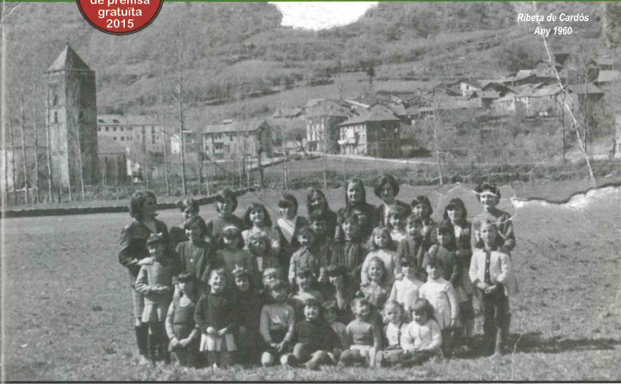
Ribera de Cardós Any 1960