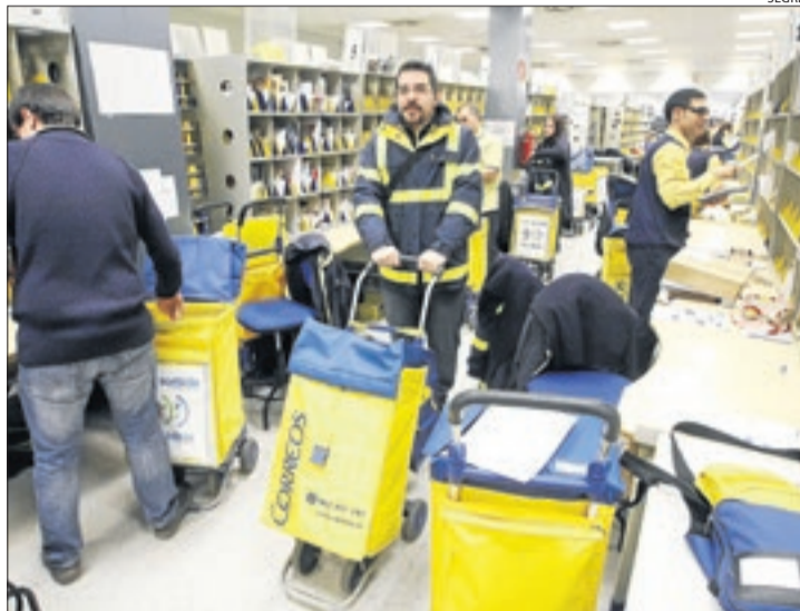
Imatge d'arxiu de l'oficina de Correus de Pardiniyes.

Segons el sindicat, el ministeri de Foment va finançar l'any passat l'empresa amb 52