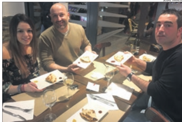
Tres persones degustant tapes del concurs a Agramunt.

Per la seua part, l'ajuntament de Tremp ha decidit ampliar el nombre d'agents de seguretat