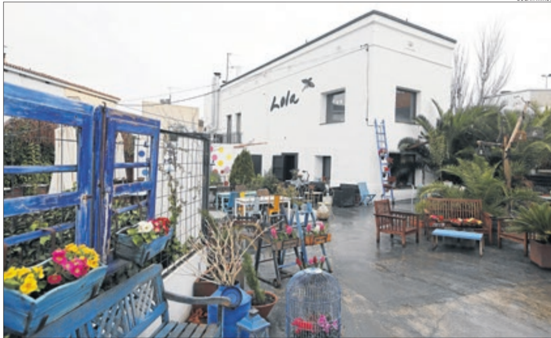
Imatge de l'edifici del Lola Más Sabores que ha comprat el Col·legi de Metges de Lleida.

Mur va assenyalar que l'objectiu principal "és estar a prop del col·legiat i de la ciutadania de Lleida" i, a més, "que l'estudiant de Medicina ens conegui des de primer curs".