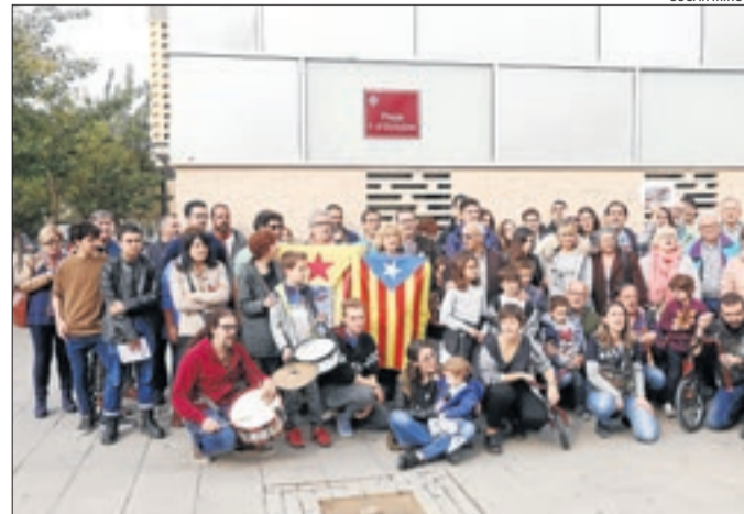
El CDR de Cappont ja va rebatejar la plaça al novembre.