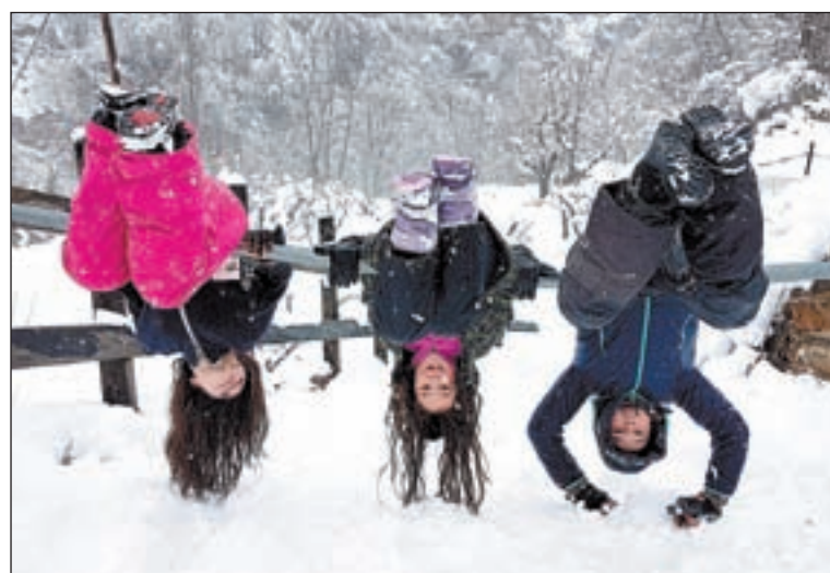
Escolars jugant. Alguns ahir no varen anar a l'escola