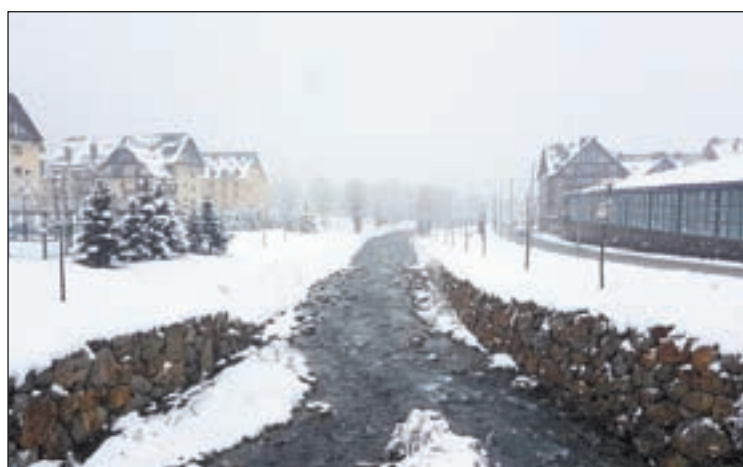
Vielha també va rebre una nevada important