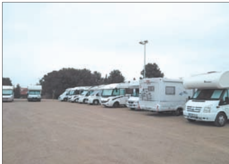
L'aparcament d'autocaravanes el cap de setmana

de les comarques de Girona i Barcelona, tot i que en menor mesura també n'hi havia de les de Lleida i Tarragona; i van arribar dissabte al matí i van marxar diumenge a la tarda. Durant la seva estada, entre altres, han visitat el nou Centre d'Interpretació del Memorial Democràtic de la Guerra Civil, "Antic Molí de Cal Gineret", l'Espai Macià, entre d'altres.