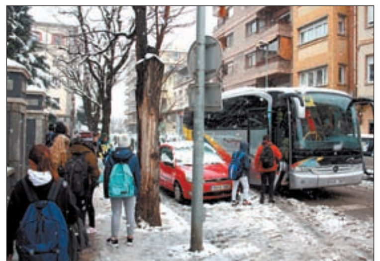
Un autocar recollint alumnes del Joan Brudieu ahir

hi va haver centres sense subministrament elèctric. En canvi, a la Val d'Aran es va registrar normalitat absoluta. En total, ahir al matí, més de 160 alumnes es van veure afectats per les escoles tancades i 652 per la cancel·lació d'un total de 66 rutes. La forta nevada