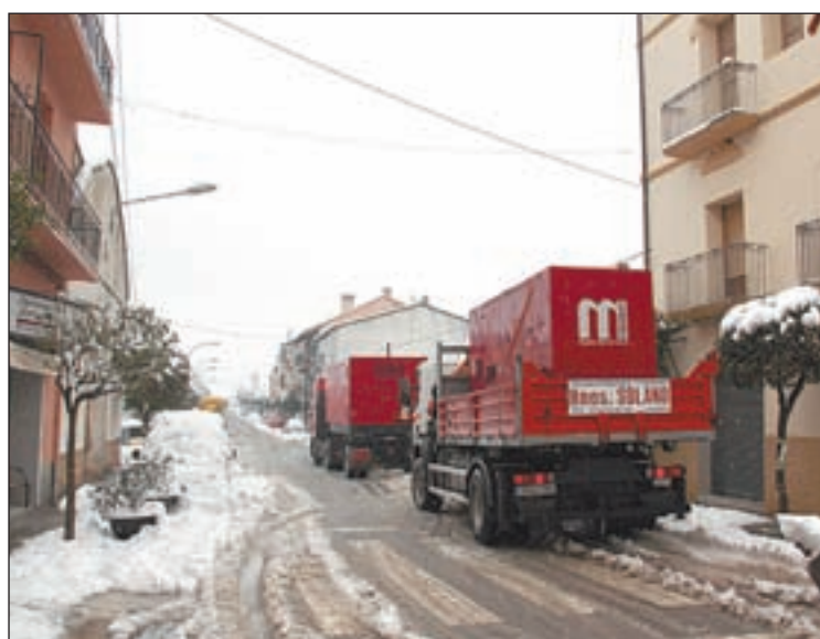
Coll de Nargó va necessitar generadors d'energia elèctrica