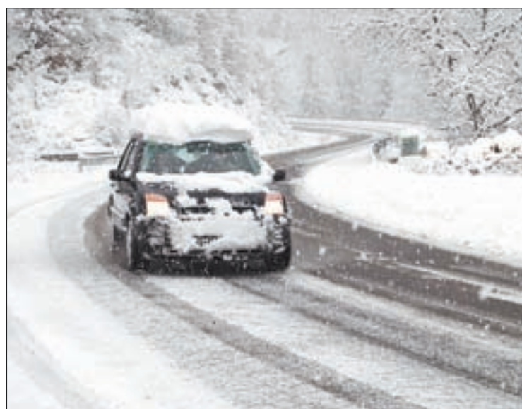
La carretera d'accés a la Vall de Boí, ahir