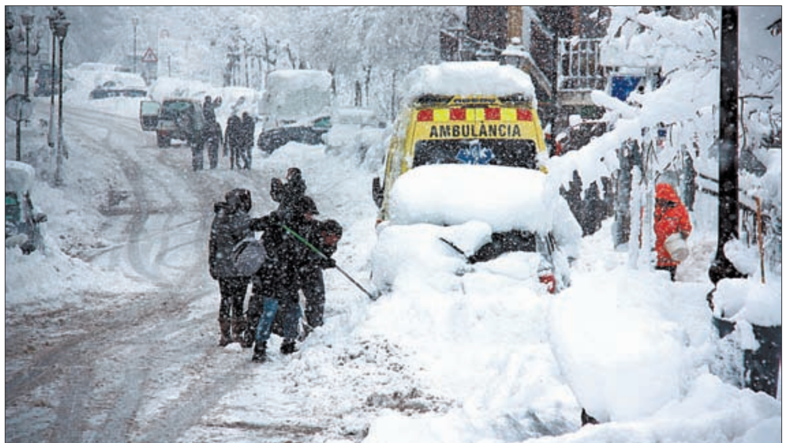
La mobilitat ahir a Bellver de Cerdanya va ser complicada per la neu, que va caure de forma copiosa

A Vielha van caure 20 centímetres de neu nova; a Espot, 53 centímetres; a Boí, 38, i a Llesp, 30. La perturbació està previst que s'allunyi aquest dimecres, si bé l'ambient que quedarà serà molt fresc. El temporal de neu que va afectar al Pirineu i Prepirineu va obligar ahir a tancar algunes escoles i a cancel·lar rutes escolars. Segons va informar ahir l'ACN, a les comarques de Lleida, van quedar anul·lats tots els transports escolars a l'Alta Ribagorça i es van veure afectades 66 rutes escolars. A més, un accident a Coll de Nargó (Alt Urgell) va complicar molt el viatge a molts mestres fins a les escoles de l'Alt Urgell, on també