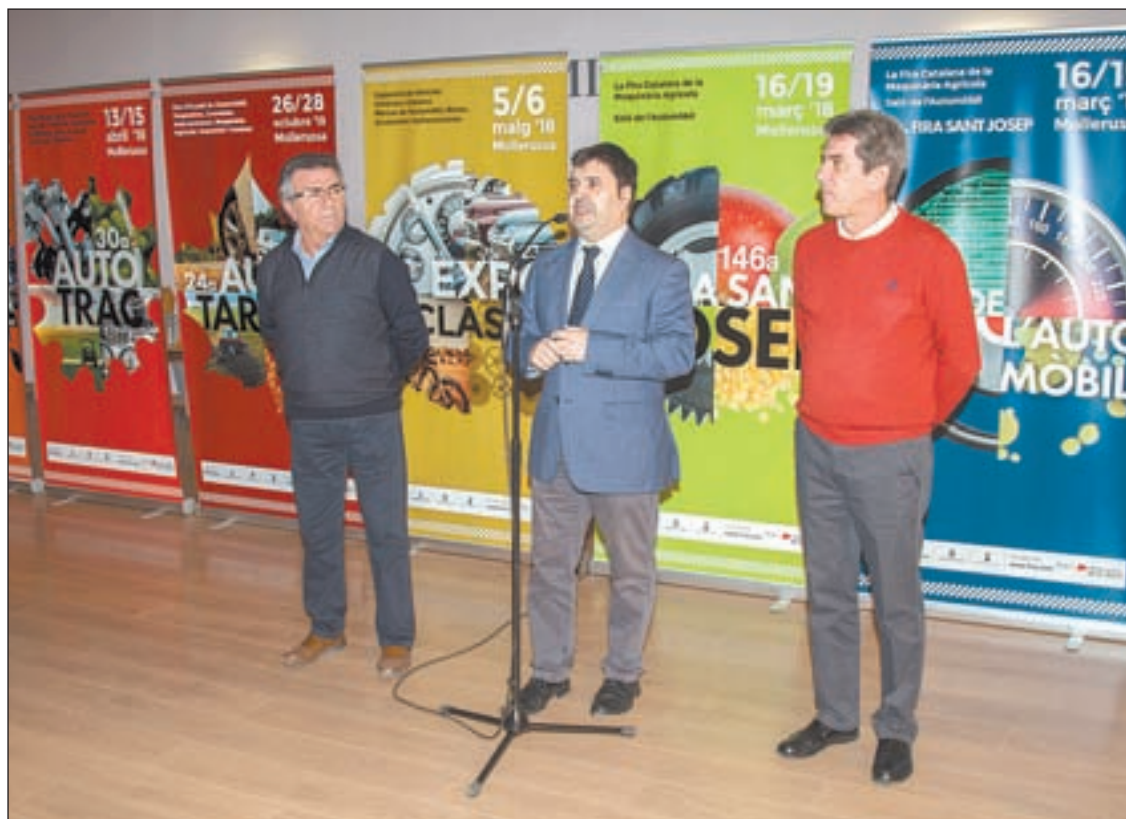
Durant la trobada amb els mitjans per presentar el calendari firal del 2018

Durant la tradicional trobada amb els mitjans de comunicació per presentar el calendari firal de l'any, Poldo Segarra va expli-