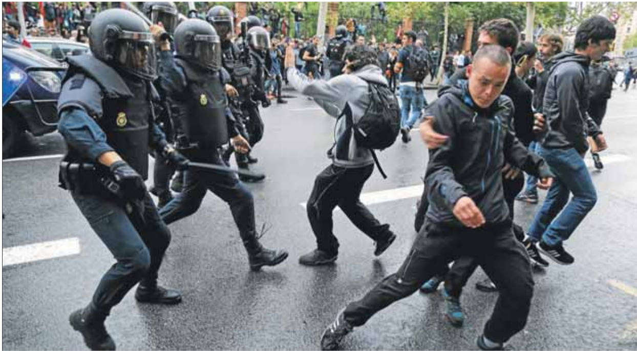
Agents de la policia estatal durant una càrrega al voltant de l'escola Ramon Llull el dia del referèndum