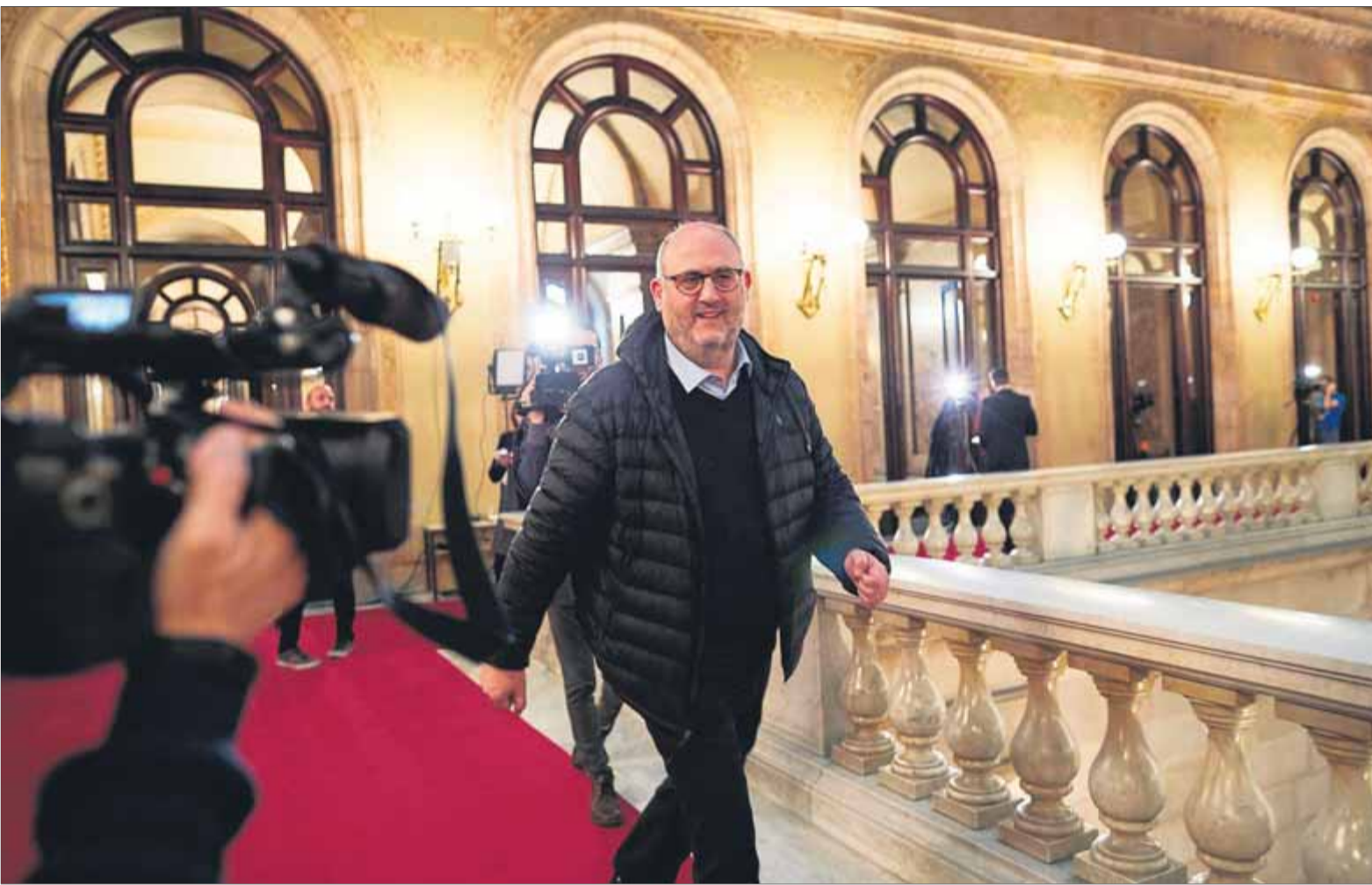
El portaveu adjunt de JxCat Eduard Pujol, als passadissos del Parlament