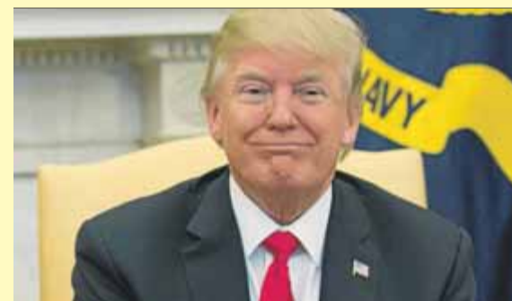
Donald Trump, ahir a la Casa Blanca