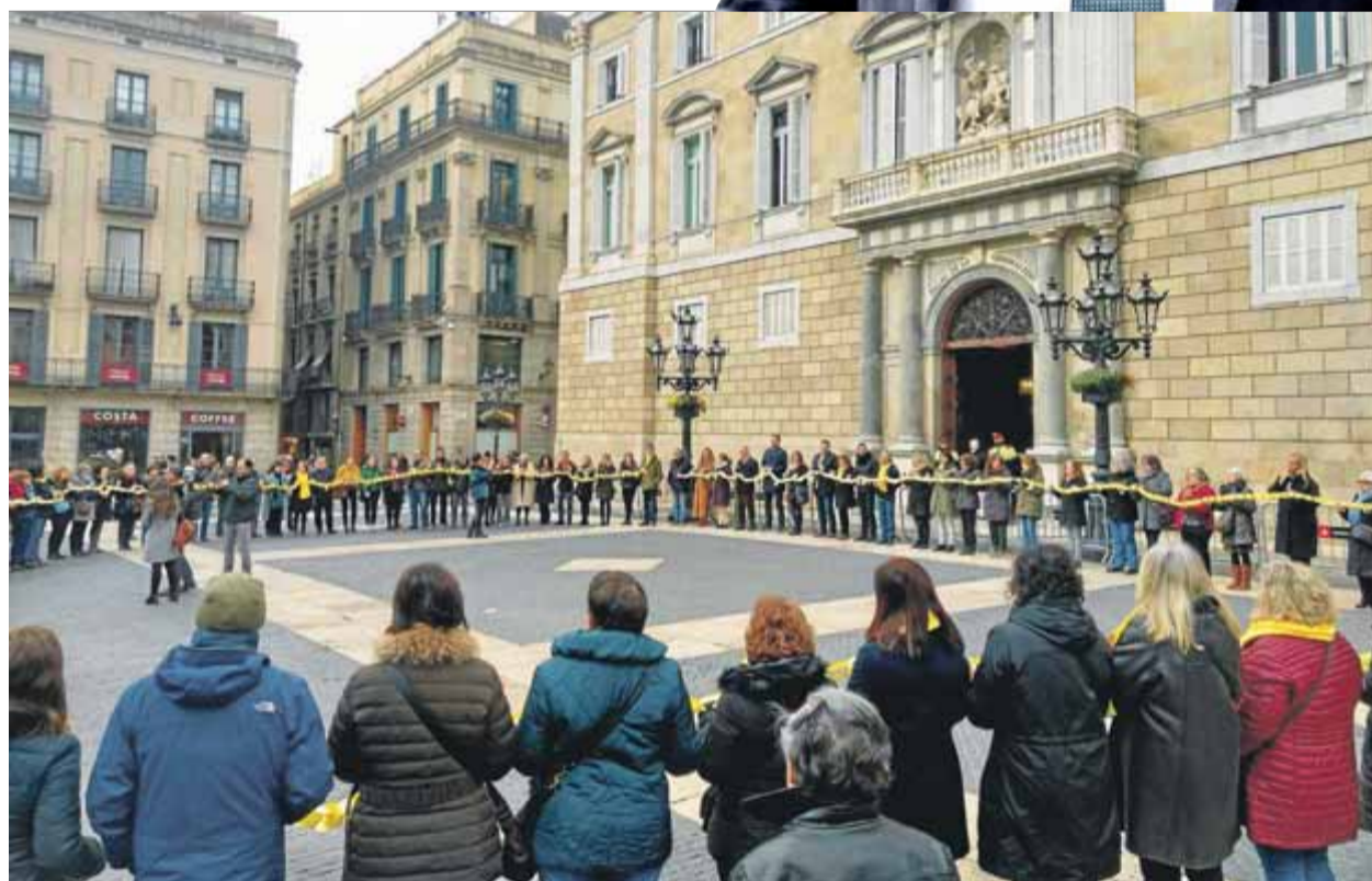
Treballadors públics encadenats amb llaços grocs, ahir a la plaça de Sant Jaume de Barcelona