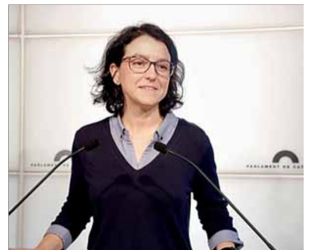
La portaveu del grup del PSC al Parlament, Eva Granados, en una imatge d'arxiu al Parlament

Mentrestant, els socialistes també han reclamat que es constitueixen les comissions que no són legislatives, com ara la relacionada amb la Sindicatura de Comptes per poder fer feina. ■