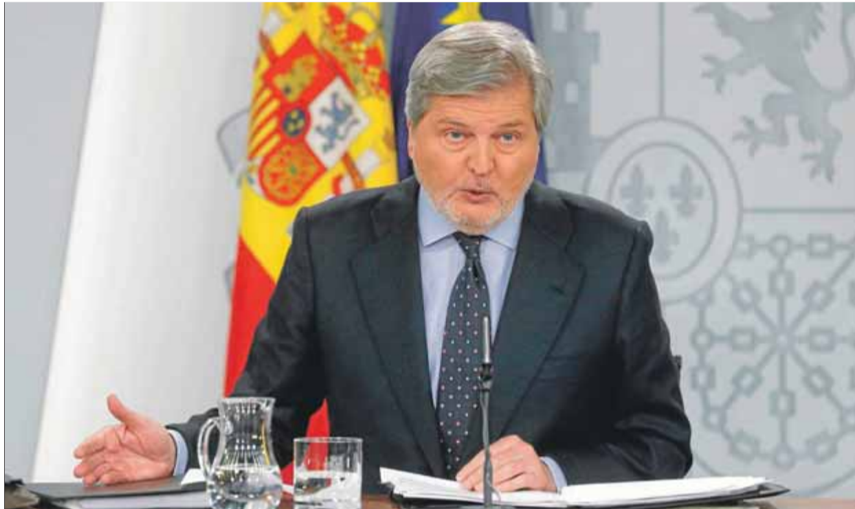
El portaveu del govern espanyol, Íñigo Méndez de Vigo, ahir en la roda de premsa posterior al Consell de Ministres

El que el dia abans era una evidència per al ministre de Justícia, Rafael Catalá —que el calendari de dos mesos per tornar a convocar eleccions va estrenar-se amb la data del ple ajornat—, ahir el ministre portaveu, Íñigo Méndez de Vigo, ja no ho veia tan clar que fos així i, de fet, garantia que La Moncloa farà cas del que digui l'informe dels lletrats del Parlament, que, pel que s'ha avançat, podrien concloure que fins al moment que no hi hagi una votació fallida, el rellotge no es posarà en marxa. Arran d'aquesta possibilitat, des de l'executiu espanyol s'intentava mostrar tranquil·litat; al cap i a la fi, segons recordaven, l'instrument del 155 no s'esgota fins que no hagi pres possessió del càrrec el nou govern. "I el que insisteixen a voler que es tregui són els que ara ho tenen tot bloquejat", subratllaven fonts properes a Mariano Rajoy. Així, doncs, i després d'assumir-se que potser no podran fer res per impulsar el rellotge, el següent pas ha estat recuperar la pressió a Inés Arrimadas perquè se sotmeti a la investidura, reclamant-li que Cs es posi en contacte amb