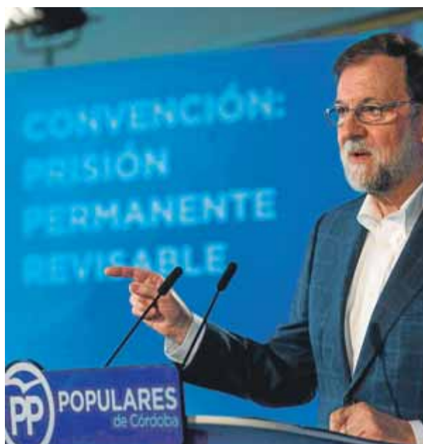
El president espanyol, Mariano Rajoy, ahir, a Còrdova

En aquest punt, el líder del PP va reivindicar el seu partit presentant-lo com “l’original del centredreta