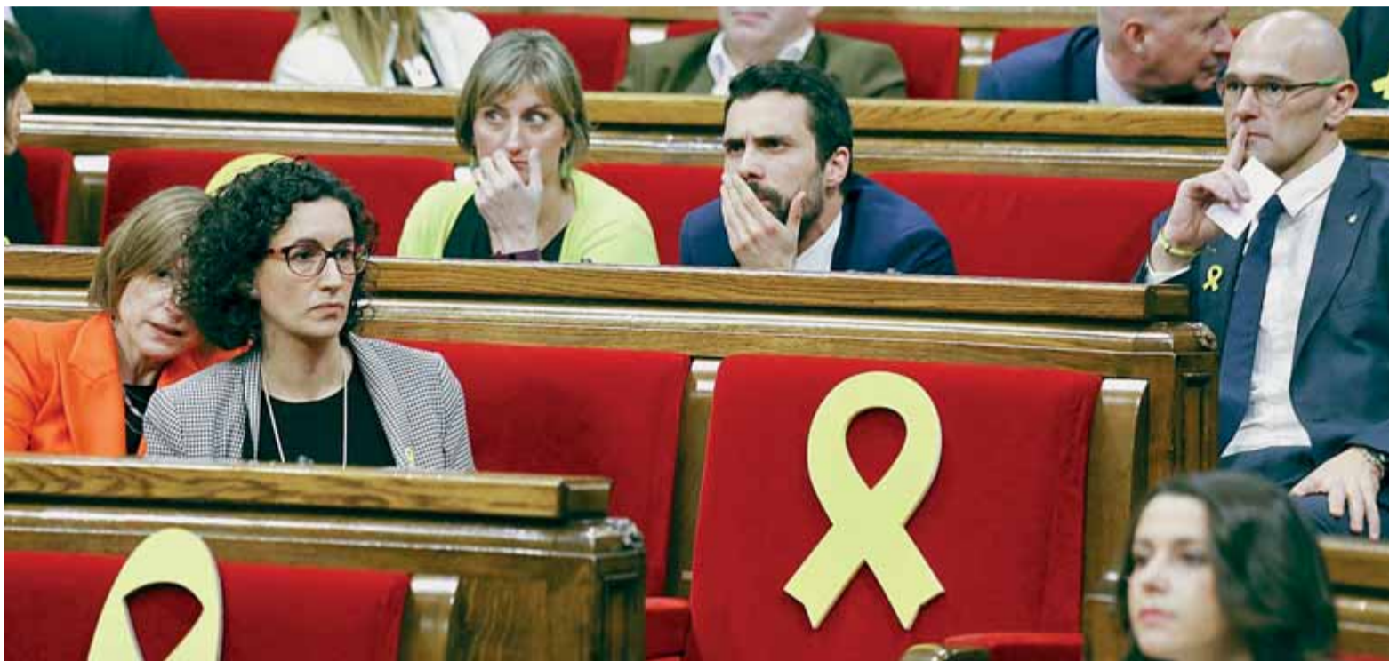
Ple de constitució del Parlament amb l'absència als escons del president Puigdemont, a Brussel·les, i el vicepresident, Junqueras, empresonat