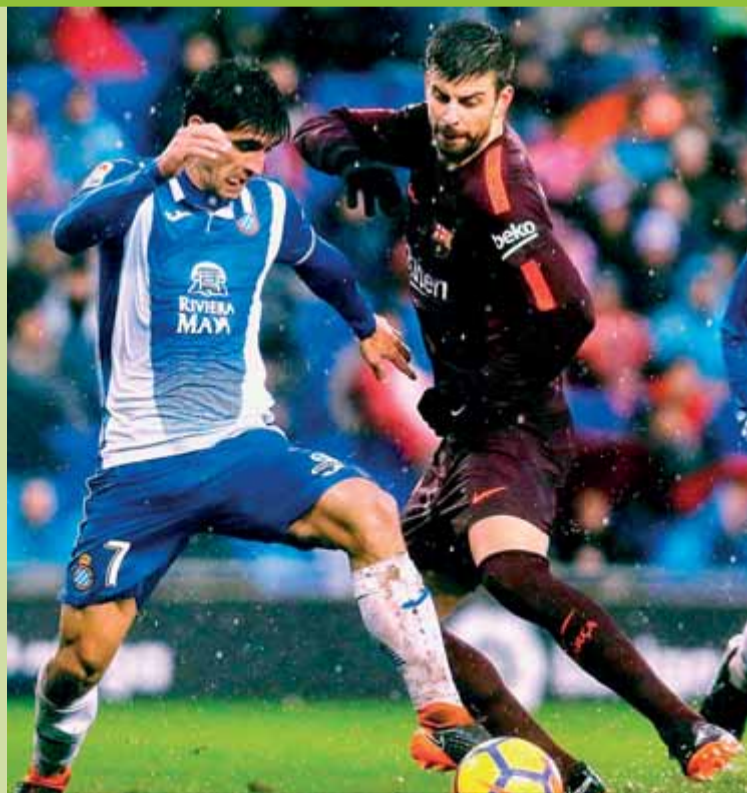
Gerard Moreno i Gerard Piqué lluiten per una pilota

Els blaugrana fa 22 jornades seguides de la lliga que no perden