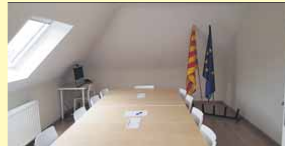
La sala de reunions a la casa de Waterloo ■ ELPUNTAUVITV