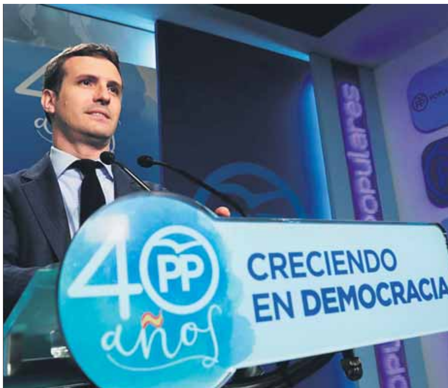
El vicesecretari de comunicació del PP, Pablo Casado, ahir en roda de premsa

Casado va fer aquestes declaracions després de la