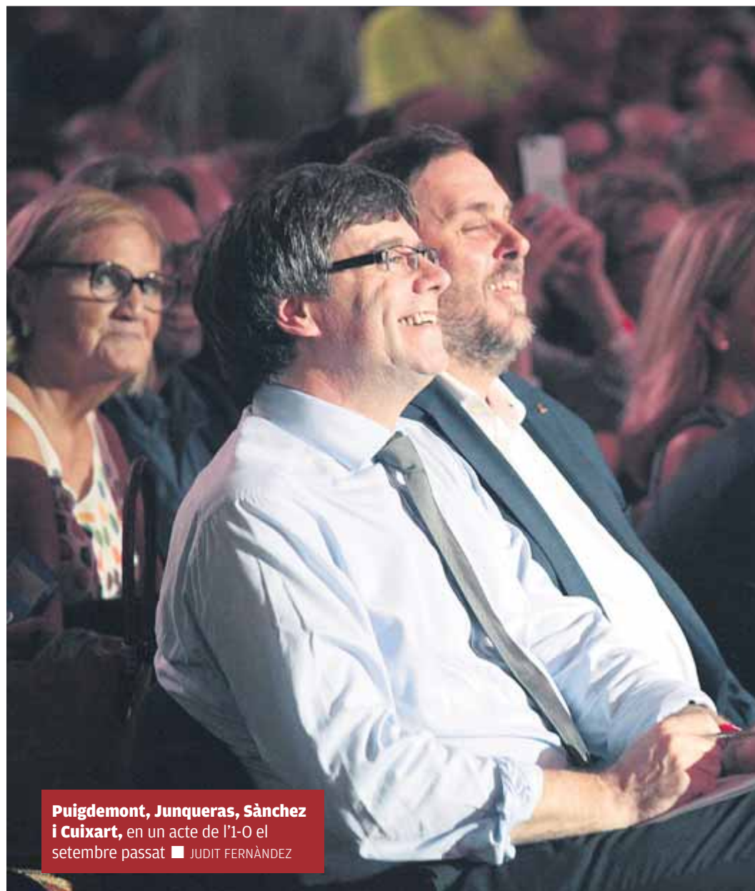
Puigdemont, Junqueras, Sànchez i Cuixart, en un acte de l'1-O el setembre passat

La defensa també censura que Llarena fonamentés la decisió de rebutjar el permís del número dos de JxCat sobre "pures intuïcions personals", que és com els advocats defineixen l'argumentació que fa referència als "possibles riscos per a l'ordre públic" que comportaria el trasllat de Sànchez, partint de la base que la conducció vigilada no garanteix un trasllat segur. "Quines són les seves evidències empíriques per valorar si existeix o no tal risc?", pregunten. Pel que fa al risc de reiteració de-