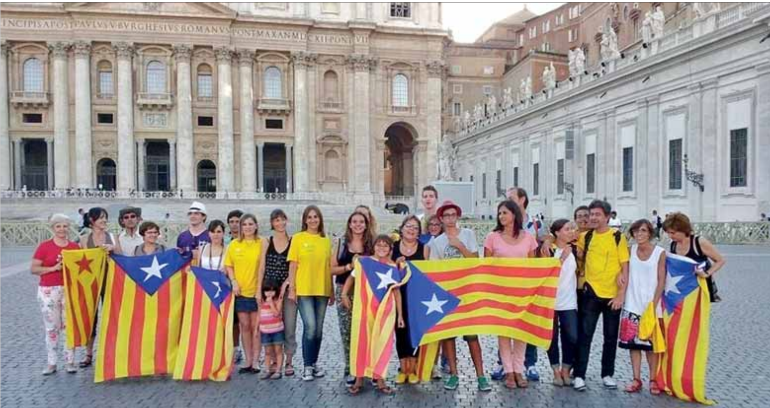
Un grup de catalans van fer la cadena humana amb estelades al Vaticà l'any 2013. A Roma fa anys que "la qüestió catalana" la tenen damunt la taula