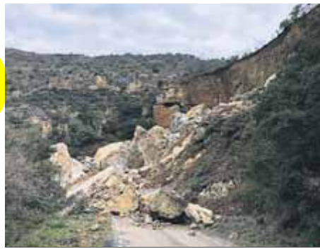
Les roques van colgar la LV-9124 ■ BOMBERS

Roques de grans dimensions sepulren la carretera a Castell de Mur, al Pallars Jussà