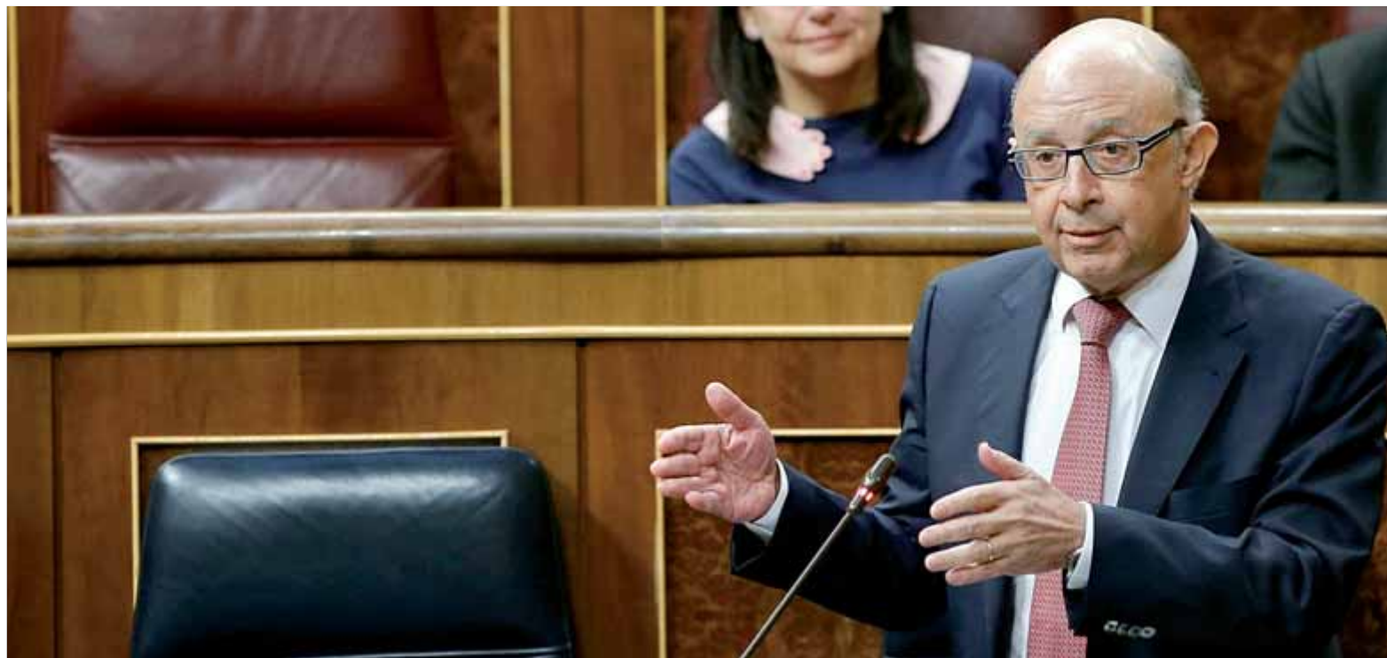
Cristóbal Montoro, ministre d'Hisenda, en la seva compareixença en l'última sessió del control al Congrés dels Diputats

■ El ministre d'Hisenda també admet que no hi ha finançament públic en les despeses de Puigdemont a l'exili ■ Defensa que l'Estat ha impedit pressupostàriament la independència