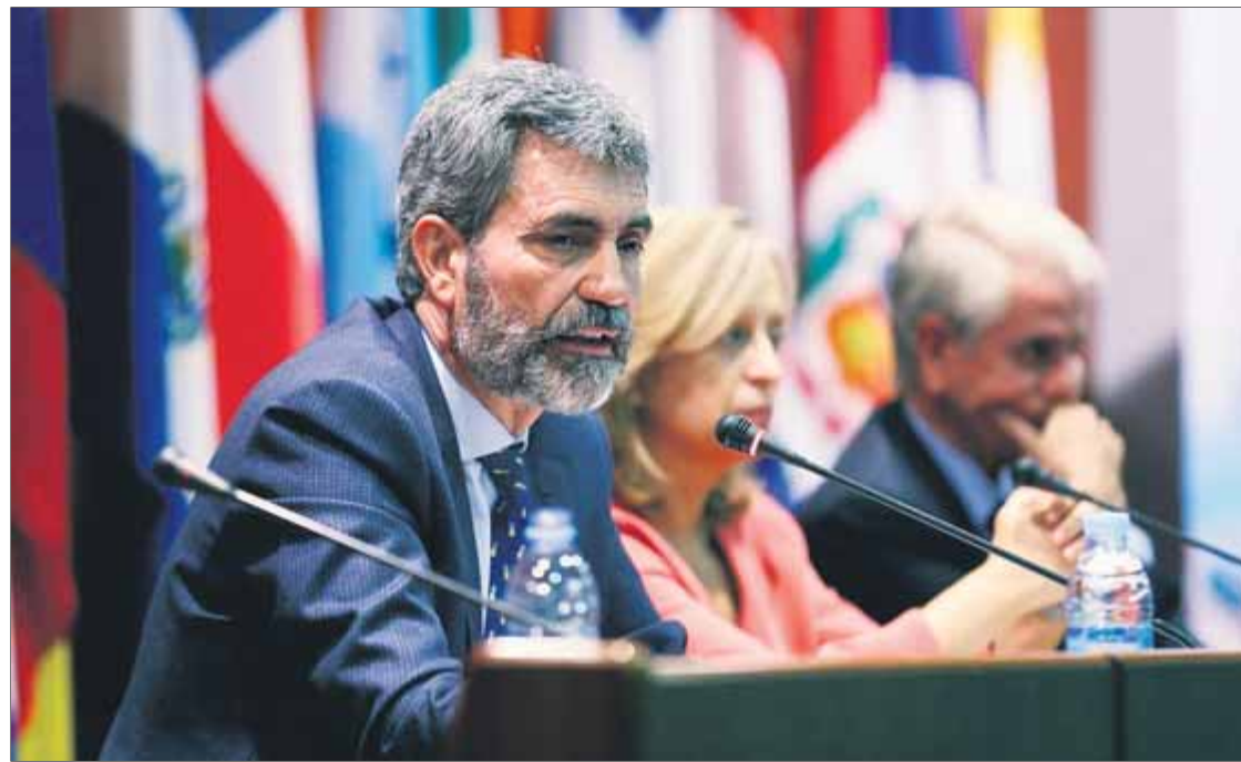
El president del Suprem, Carlos Lesmes, a l'Escola Judicial de Catalunya

Em van suspendre la primera convocatòria de dret penal –ho he d'acceptar–, però encara recordo els conceptes bàsics de la ciència. Treballàvem sobre un Codi Penal franquista i no sobre el del 2015. Era un codi que considerava delictes l'homosexualitat, per exemple, però que representava l'estat de dret d'aquell moment, com el del 2015 representa l'estat de dret actual. Aquest el configuren unes persones que tenen unes idees que es manifesten a través dels articles del codi. En qualsevol codi, alguns fets són claríssims: si un home mata la seva dona amb