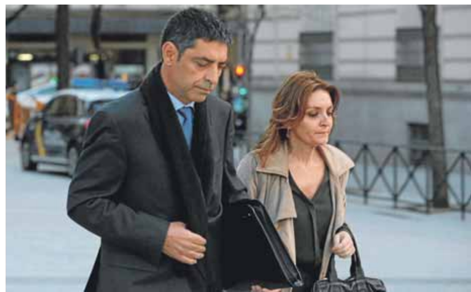
El major Josep Lluís Trapero, a la seva arribada ahir a l'Audiencia Nacional

El major insisteix a l'Audiencia Nacional a desvincular els Mossos de l'estratègia política del procés independentista