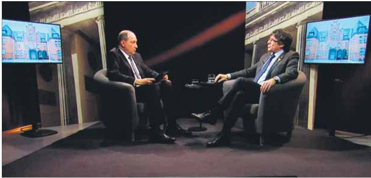
L'entrevista a Puigdemont de diumenge a TV3 va irritar els partits unionistes, però va tenir grans xifres d'audiència