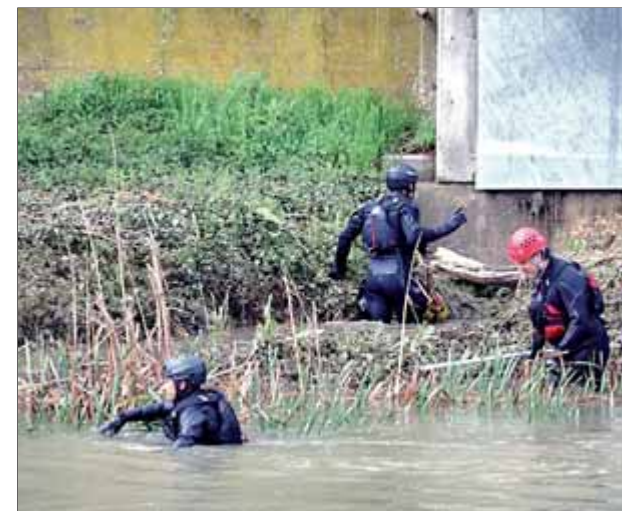
Membres de l'equip subaquàtic realitzant ahir al matí tasques de localització de l'home

de les unitats subaquàtiques dels bombers i els Mossos. Arran d'aquesta acció, el cabal del Llobregat va baixar —aquests dies va molt ple a causa de les importants pluges que han caigut— i això va fer més fàcil el rastreig de la zona on es va trobar el cos, situada a un quilòmetre i mig del centre. ■