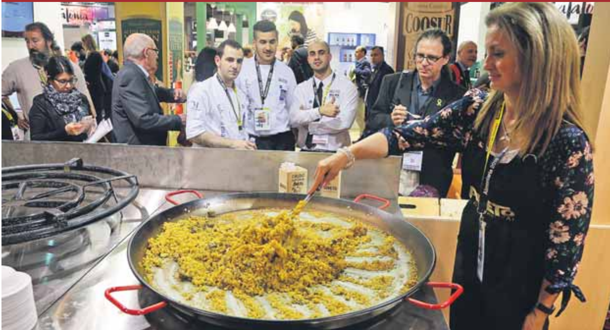
L'elaboració d'una paella, ahir al matí, en un dels estands de la fira