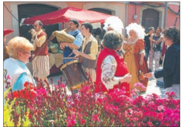
Unes 2.500 persones van visitar el certamen

Un incendi va cremar ahir 300 metres quadrats de borrhissol al Barranc de Riucós, situat al terme municipal de Tremp. Per altra banda, els Bombers van fer dues actuacions per incendis a Balaguer. El primer va tenir lloc en ser alertats d'un incendi que va cremar 5 metres quadrats de matolls i el segon va cremar 30 metres quadrats de rostolls.