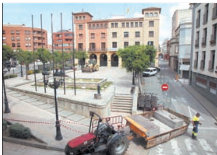
Les obres de millora de la plaça de l'Ajuntament ahir

L'Ajuntament de Mollerussa va començar ahir les obres de millora del nucli central de la ciutat per les places de Manuel Bertrand i la de l'Ajuntament simultàniament amb la retirada del mobiliari urbà i la delimitació de les zones de treball. Tot i això, està previst que no sigui fins avui que les màquines comencin les tasques de demolició del paviment actual.