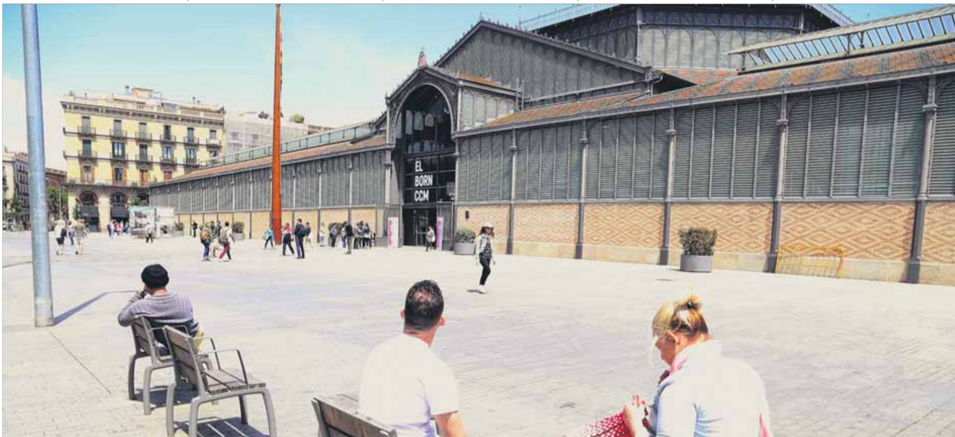
La gran esplanada del mercat del Born, ahir tancat al públic per festa setmanal, va ser durant tot el matí un discret anar i venir de ciutadans