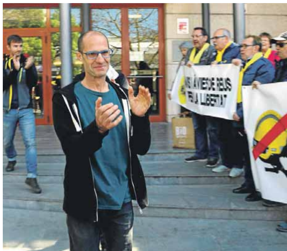
Dos dels bombers citats a declarar als jutjats de Reus reben el suport dels veïns

Segons va informar ahir un portaveu de la fiscalia, el ministeri públic ha optat per presentar directament un recurs d'apel·lació davant l'Audiència perquè rectifiqui la decisió del titular del jutjat d'instrucció 7 de Martorell, que la setmana passada va decidir investigar tres docents denunciats i arxivar el cas per a cinc més. El fiscal es remet en el seu recurs a la doctrina del Tribunal Europeu de Drets Humans, que estableix que no pot acordar-se l'arxivament d'un cas sense practicar prèviament diligències d'investigació per aclarir els fets. ■