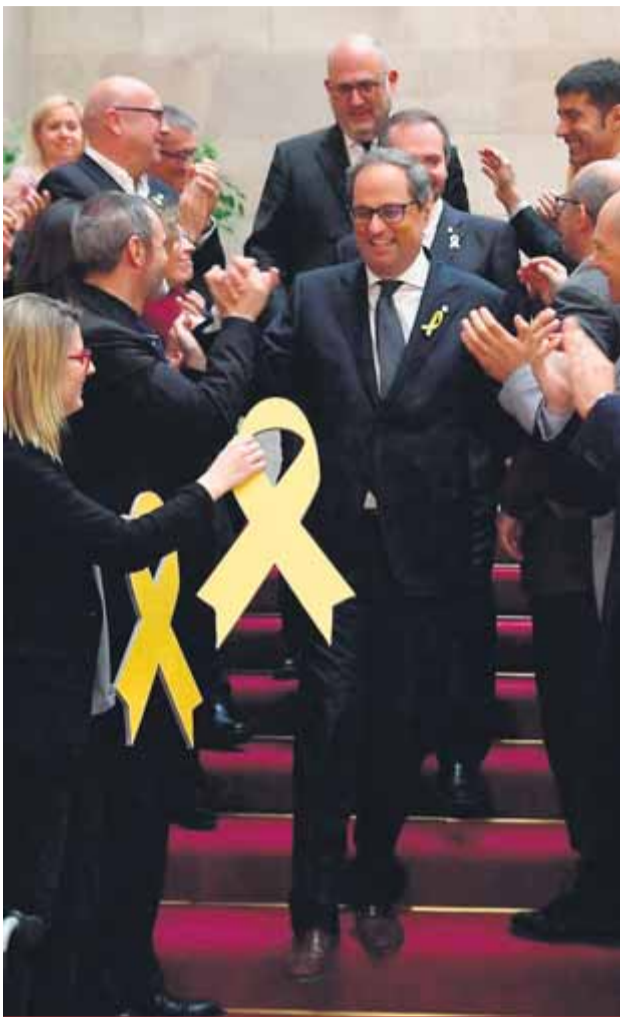
Llaços grocs en record dels presos i els exiliats