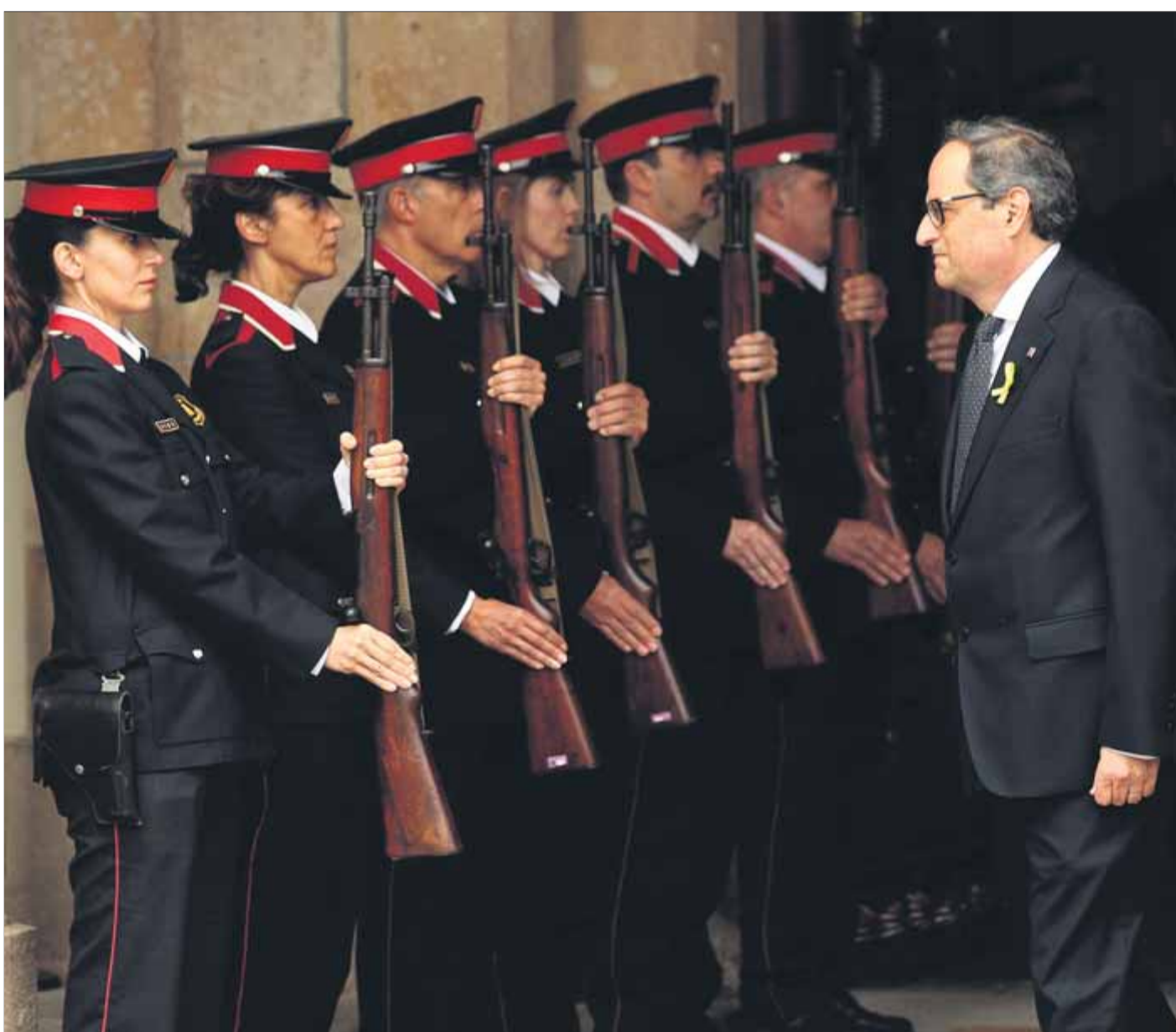
El nou president de la Generalitat, Quim Torra, passa revista als Mossos d'Esquadra en sortir del Palau de la Generalitat

TRIA • Quim Torra és escollit el 131è president de la Generalitat amb els vots de JxCat i ERC i l'abstenció de la CUP