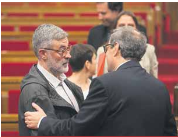
Torra amb Riera, de la CUP