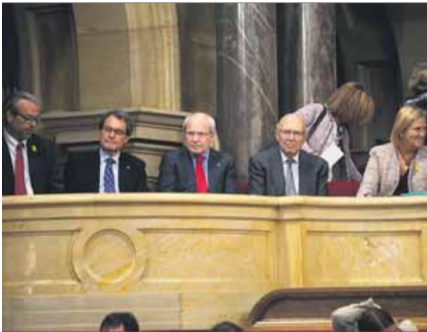
Benach, Mas, Montilla, Rigol i De Gispert ■ ORIOL DURAN