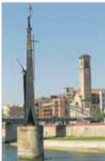
El monument franquista de Tortosa

La norma permetrà suprimir noms, treure monuments i anul·lar condecoracions de la dictadura tot i que els ajuntaments s'hi oposin