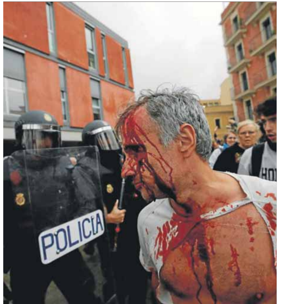
Un home ferit, per la policia espanyola a l'escola Mediterrània de Barcelona, l'1-0