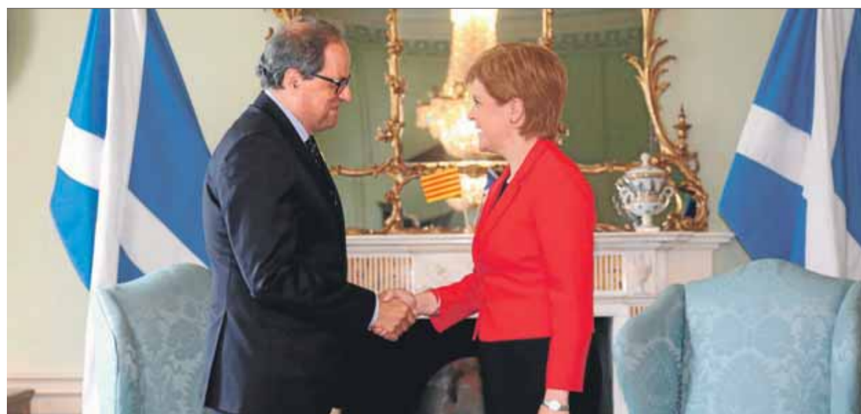
El president de la Generalitat, Quim Torra, estrena la mà a la primera ministra escocesa, Nicola Sturgeon