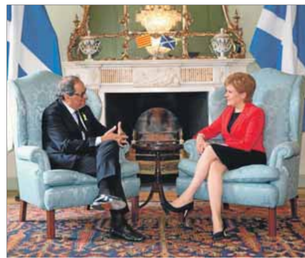
Quim Torra i Nicola Sturgeon conversen al despatx de la primera ministra escocesa

Els partits unionistes, per la seva banda, van coincidir a exigir ahir que s'apliqui la resolució i amenaçaven amb accions judicials si s'acaba duent al ple, un fet que, segons el líder popular Xavier García Albiol, seria "impropi" d'una democràcia. "És una sentència i cal complir-la, és una barbaritat que els independentistes hagin dit que la sotmetran a votació", deia també Inés Arrimadas, de Cs. En la mateixa línia s'expressava Miquel Iceta, que no troba que la sentència modifiqui les majories. Cs i PP coincidien que la llei estatal té rang superior al reglament del Parlament, extrem en què no estan d'acord els advocats. ■