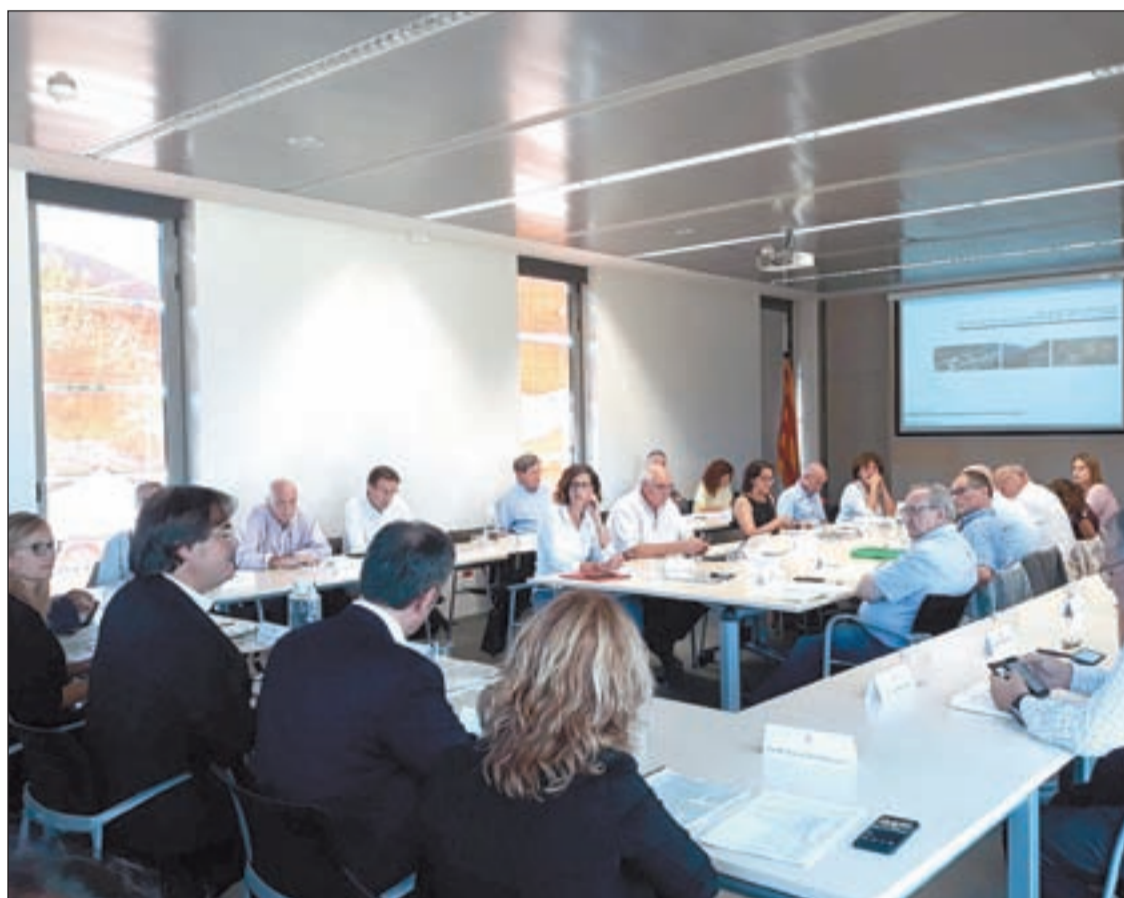
La Comissió Territorial d'Urbanisme es va reunir ahir a Tremp, al Pallars Jussà

Arran d'aquest nou Pla a l'àmbit de l'Alt Pirineu i Aran es revisarà 120 sectors de 24 municipis. A partir d'ara, durant la redacció del Pla, es concretarà quin tractament es dona a cadascun: reducció de l'àmbit, modificació, extinció i, potser, en algun cas no es pot fer cap tractament. De moment, s'analitzaran tots i a més d'entrada ja es suspèn la tramitació de llicències en 73 d'aquests 120 sectors, perquè es consideren especialment insostenibles.