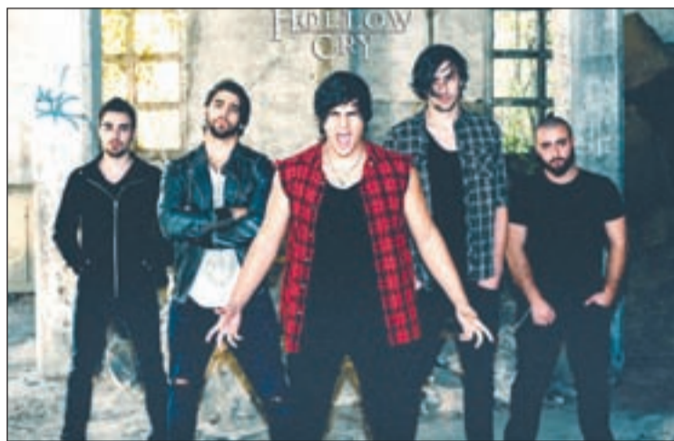
Hollow Cry acaban de estrenar el videoclip 'Last call'

Las influencias de esta formación van desde clásicos como Metallica hasta grupos de metal más actuales como Trivium. Pese a que su patrón musical más mar-