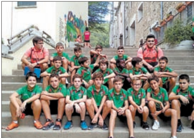
L'Aleví Preferent del Bordeta durant un amistós

En la divisió preferent, la segona jornada ens va deixar a FIF Lleida i a Mollerussa com a únics