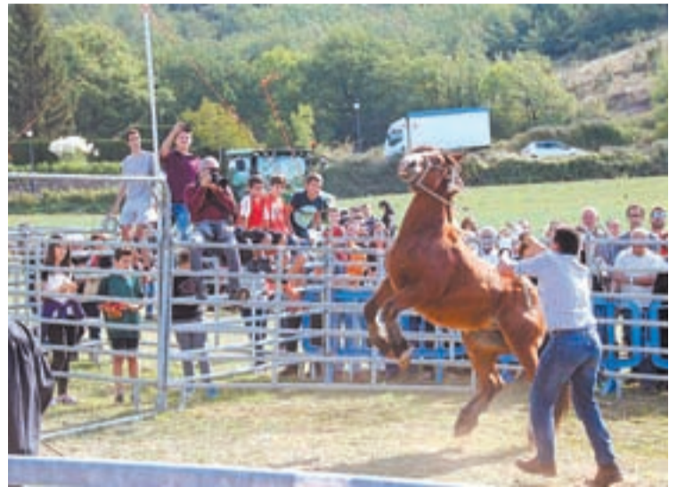
Una de les activitats de l'any passat a la Fira

I el diumenge 7 d'octubre tindrà lloc el 21è Concurs d'Animals de Raça Bruna dels Pirineus, amb més de 50 vaques de diferents races, d'una quinzena d'explotacions, la majoria del municipi. El mateix dia també s'exposen al-