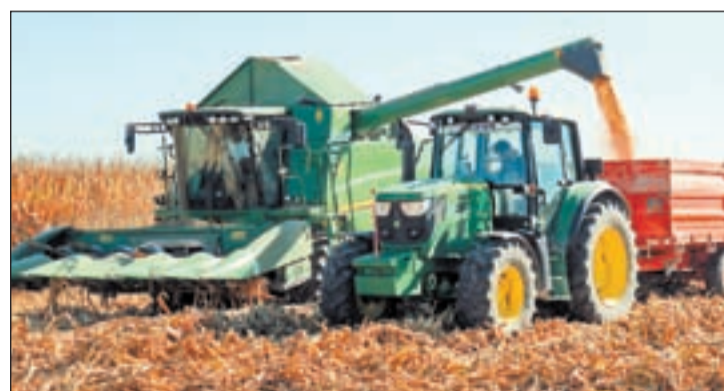
Maquinaria trabajando en el Pla d'Urgell

El gobierno francés liberó ayer una nueva osa eslovena en el valle de Aspe cuando todavía colea la polémica por los ataques de Goiat . | PÁG. 16