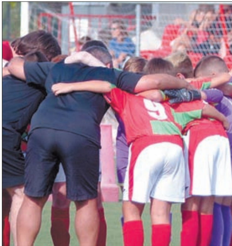
Imatges de l'Infantil B del Bordeta durant un partit de pretemporada

En la categoria Cadet, el primer líder és el Baix Segrià, que va derrotar a l'Escola F. Tremp per 7 gols a 2. L'Andorra es va quedar a només un gol d'obtenir el lideratge en aquesta primera jornada, ja