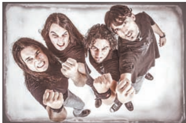
Hard Buds es una banda procedente de Girona

La Boîte recibe en concierto esta noche (22.00 horas. 10 euros) a dos conocidas bandas de hard-rock dispuestas a mostrar su evolución en esta nueva aparición pública.