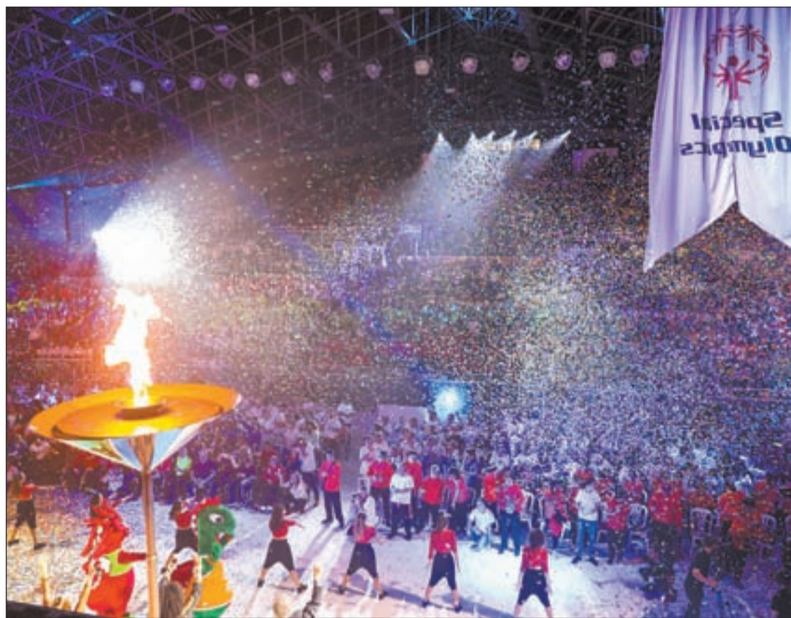
La capital andorrana acogió la gala de inauguración

► Son fruto de modelos municipales antiguos que se ven insostenibles PÁGINA 12