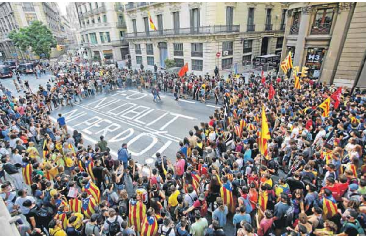
Pintada dels estudiants al davant de la Policia Nacional, a Via Laietana