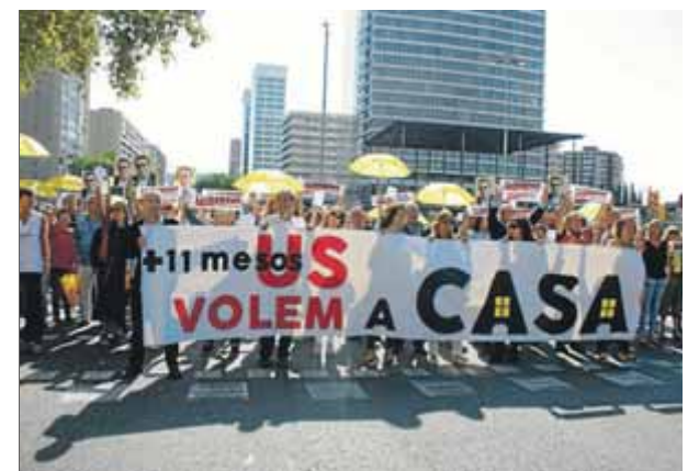
Els treballadors de la conselleria de Territori es van solidaritzar ahir amb els presos polítics i els exiliats

■ Concentracions davant les portes de la feina per reclamar la llibertat de presos i el retorn dels exiliats