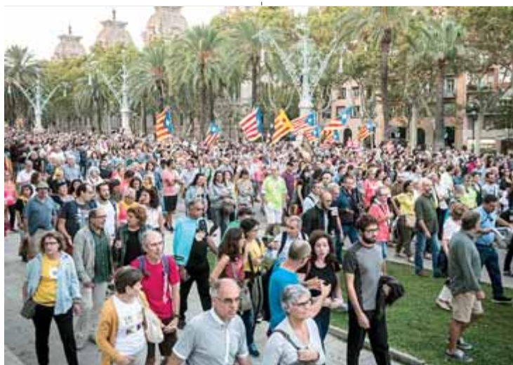
Una columna de manifestants ahir al passeig de Sant Joan

ra de la Policia Nacional, blindada amb tanques, va ser objecte de les consignes, i també de les burles, de la concentració espontània que s'hi va formar just al davant. Un any després, molts van voler venjar-se amb actitud sorneguera d'aquelles càrregues tan brutals, cridant a viva veu un A por ellos insistent. Això, mentre les furgonetes que custodiaven la zona s'enduien sonores esbrucades coronades amb el crit de "Buch dimissió!". Lluny queden, doncs, les escenes i els gestos d'afecció que l'independentisme dedicava al cos policial no fa pas gaire temps. Un any per ser exactes. El divorci ara és visible, explícit, fins al punt que alguns manifestants qualificaven els Mossos de "forces d'ocupació". Una tibantor ambiental que va anar pujant de to amb el pas de les hores, fins al punt que a la nit ja s'olorava la