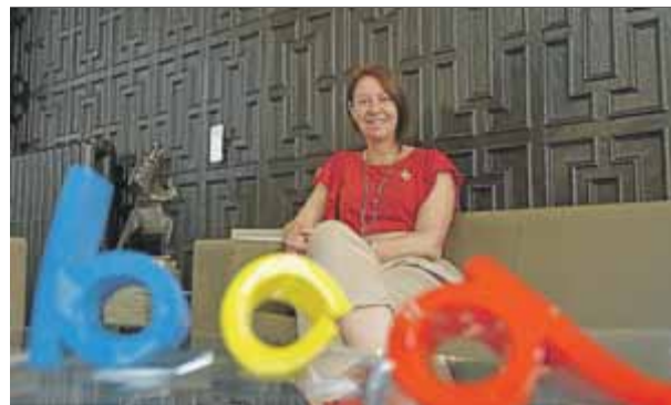
L'alcalde de Girona, al seu despatx