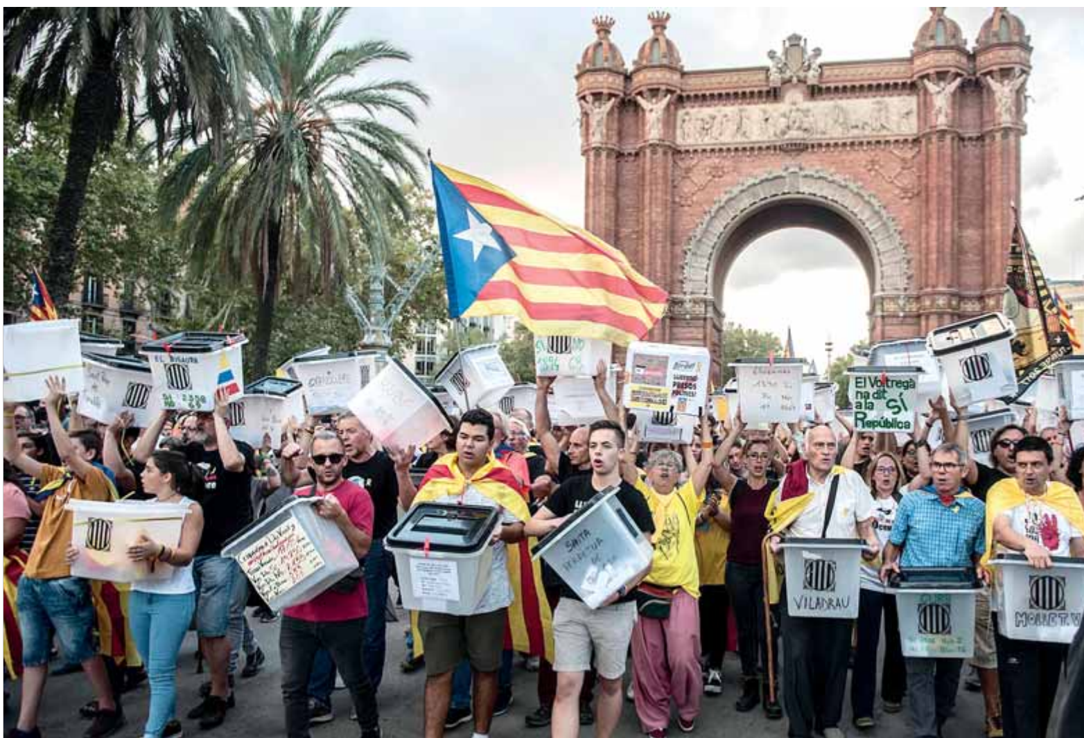
La capçalera de la manifestació, amb les urnes a l'Arc de Triomf