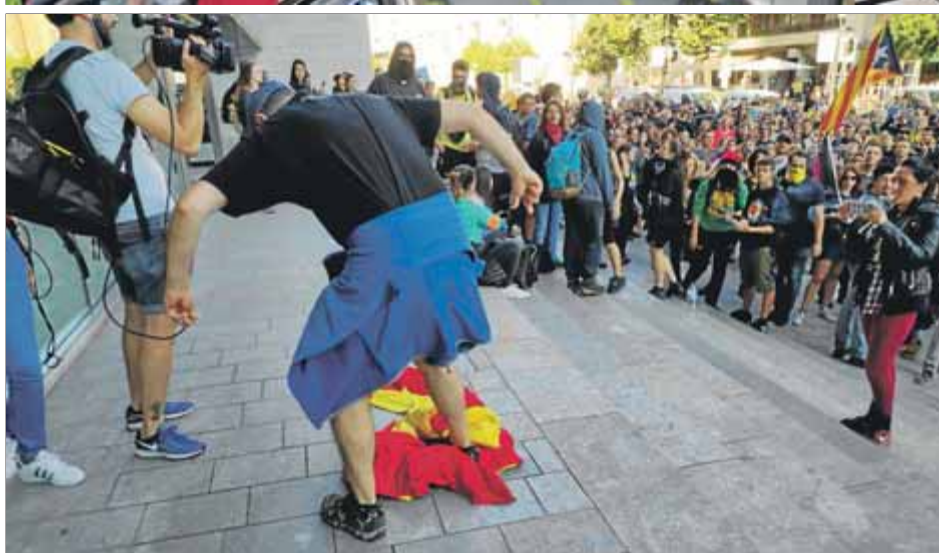
Manifestants ocupant les vies del tren de l'alta velocitat de Girona. A la dreta, desallotjant l'estació, i, a baix, un home trepitjant la bandera espanyola, que es va despenjar