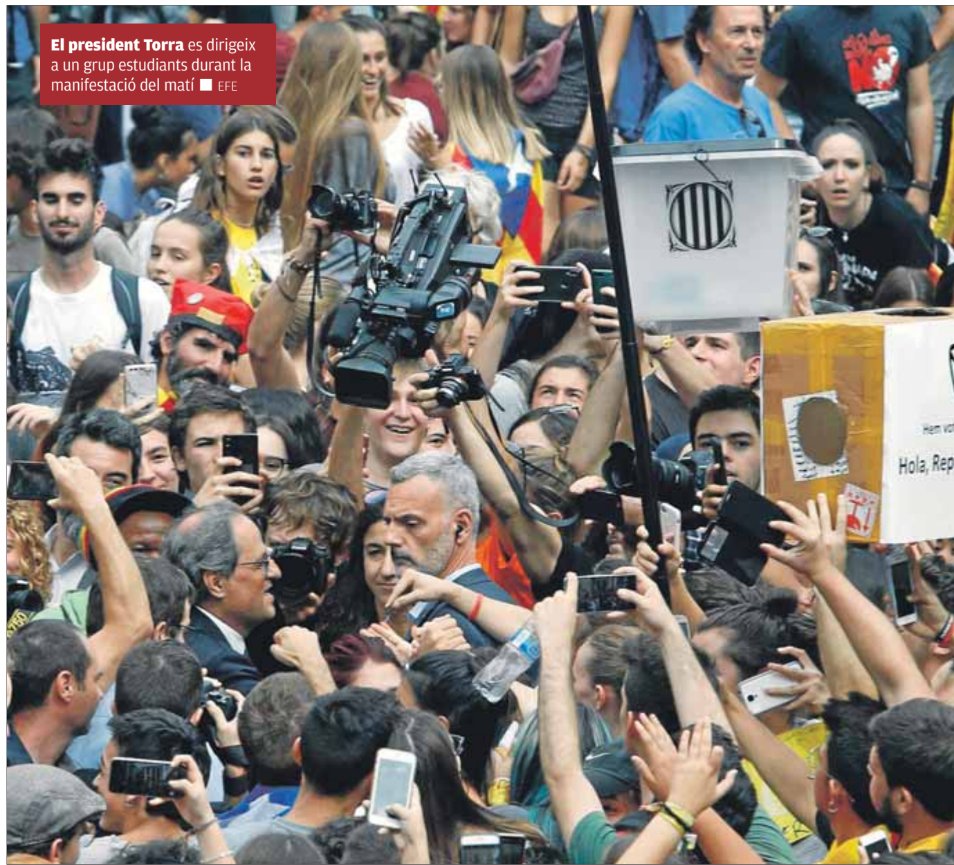
El president Torra es dirigeix a un grup d'estudiants durant la manifestació del matí

El compromís de Torra, hores abans, de tirar endavant la República i la seva petició als CDR perquè no deixin de "pressionar" el govern va provocar les queixes immediates i contundents dels partits a l'oposició. El PP i Cs les aprofitaven per demanar un cop més l'aplicació de l'article 155 i minar, així, el paper de Sánchez. El ministre José Luis Ábalos va ser l'encarregat de respondre a aquesta exigència assegurant que no hi ha motius per a l'aplicació del 155 i va exigir a aquests partits que, en cas contrari, expliquessin en base a quins supòsits l'aplicarien. Des de Catalunya, responia a la petició de més 155, el president Roger Torrent després de visitar els presos polítics al