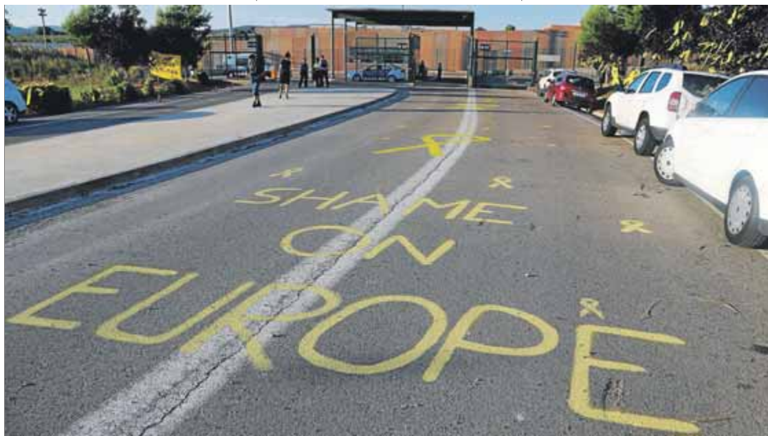
Pintades a l'entrada de la presó de Lledoners, a Sant Joan de Vilatorrada

La presó és un lloc de mancances. Les persones empresonades viuen sense la intimitat, els serveis de salut, la llibertat de moviments i l'alimentació saludable que la majoria dels que estan a l'altra banda donen per suposats. Però el pitjor és l'aïllament. Als reclusos se'ls separa de les seves famílies i de les persones