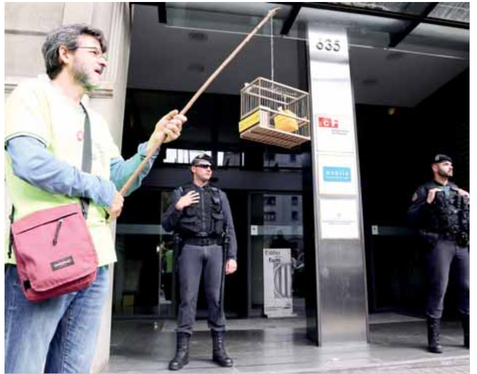
Agents de la Guàrdia Civil, en els escorcolls d'Hisenda, el setembre del 2017