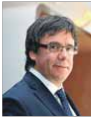
CARLES PUIGDEMONT PRESIDENT DE LA GENERALITAT

“El moment aconsella una mediació, que ha de ser internacional perquè sigui eficaç”