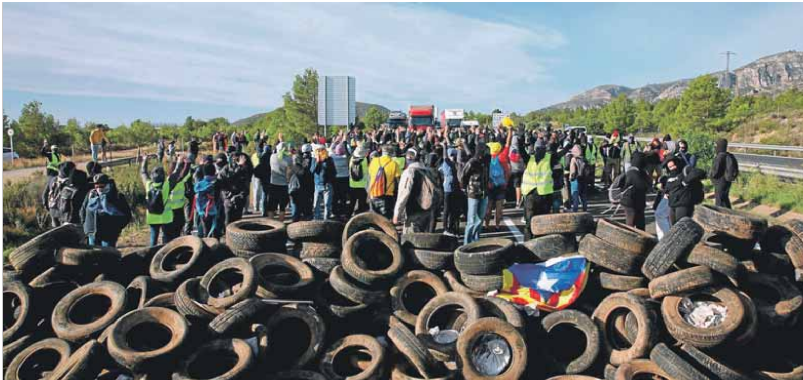
Un grup de CDR i una muntanya de pneumàtics vells impediè ahir al matí el trànsit per l'autopista AP-7 al seu pas per Vandellòs

■ Els activistes per la República protagonitzen accions similars a les que van portar a l'acusació de terrorisme contra dues persones ■ Tallen vies de tren i autopistes i aixequen barreres de peatge