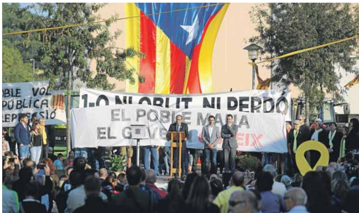
Sant Julià de Ramis va organitzar ahir una jornada reivindicativa i festiva que va incloure les votacions que fa un any no s'hi van poder fer. Moment del parlament del president Quim Torra

Des de l'exili belga, Carles Puigdemont es va desmarcar dels que aposten per "exercir la via de l'acció directa" promoguda pels CDR: "No és la meua opció." En una entrevista a RAC1, el 130è president de la Generalitat va assegurar que "mantenir la posició per esperar que hi hagi noves oportunitats no és una mala decisió", en contrast amb qui va ser la seva consellera d'Educació, Clara Ponsatí, exiliada a Escòcia, que va criticar l'excés de "retòrica" del govern i que no veu clar que l'executiu estigui avançant cap a la República. En canvi, el president del Parlament, Roger Torrent, creu que el govern "ha fet passos i en farà més" i que aquests passos seran "evidents". ■