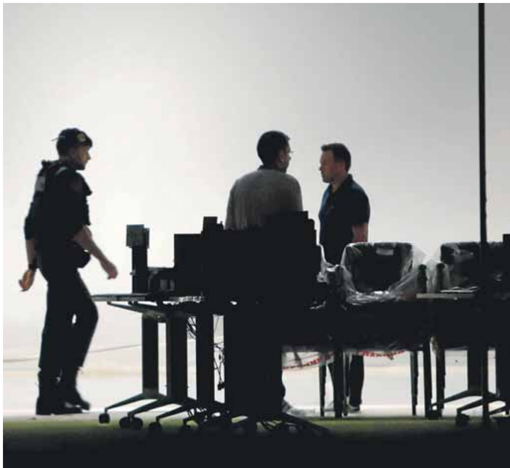
Agents de la Guàrdia Civil a l'interior del CTTI, ara fa un any

Un equip secret de programadors hi va estar treballant intensament durant els dies previs i el va pujar a servidors repartits per tot el món minuts abans de l'obertura dels col·legis. Veient que apareixien