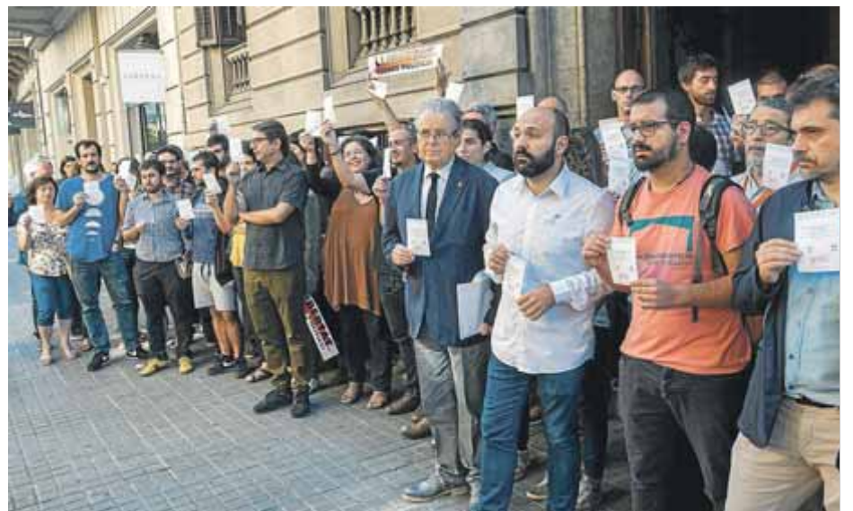
Els treballa dors d'Òmnium Cultural durant l'aturada d'ahir al matí