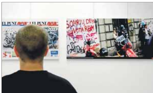
Un assistent a l'exposició '1 d'octubre' observant una portada del diari que es va publicar l'endemà de l'1-O

La Delegació de la Generalitat a la Unió Europea va ser escenari ahir de la inauguració de l'exposició 1 d'octubre , que inclou un recull de fotografies i portades de diaris catalans, espanyols i internacionals. La mostra té com a objectiu recordar què va passar en el referèndum d'auto-determinació celebrat a Catalunya ara fa un any, posant especial atenció en