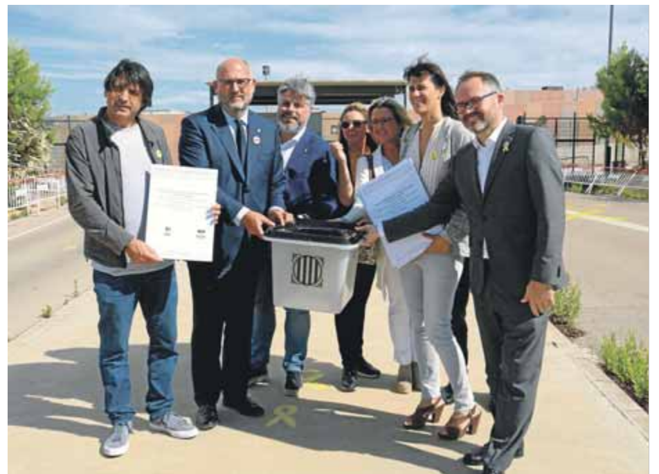
Diputats de Junts per Catalunya van visitar ahir Sánchez, Rull, Turull i Forn a la presó

Després de la visita a Lledoners, en unes declaracions als mitjans, el portaveu parlamentari de Junts per Catalunya va remar-