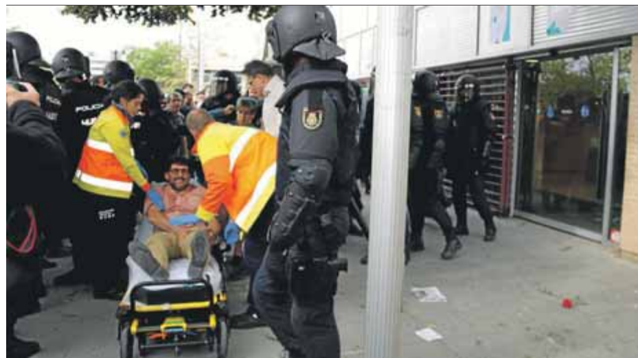
Un dels ferits per la policia espanyola al CAP de Caupton de Lleida, l'1-O

La jornada d'ahir i les posicions polítiques que es van poder escoltar tindran ressò avui a la cambra catalana en el debat de política general que comença a dos quarts de cinc de la tarda amb la intervenció del president Quim Torra. El compromís del govern per la República s'haurà de concretar en les resolucions que s'hauran de portar a aprovació en el ple de dijous al matí. ■