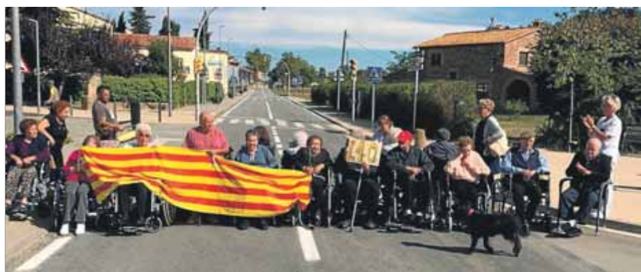
Un noi vota en una urna durant la manifestació d'estudiants a Lleida. A la dreta, els avis de la residència de l'Estany van 'tallar' simbòlicament una via amb poc trànsit