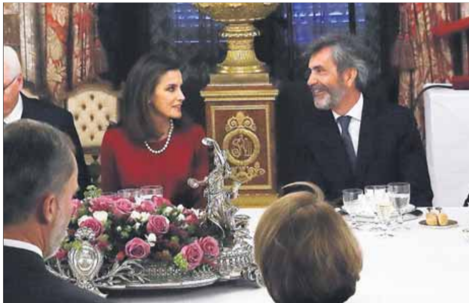
Carlos Lesmes xerrant amb la reina espanyola la setmana passada a Madrid