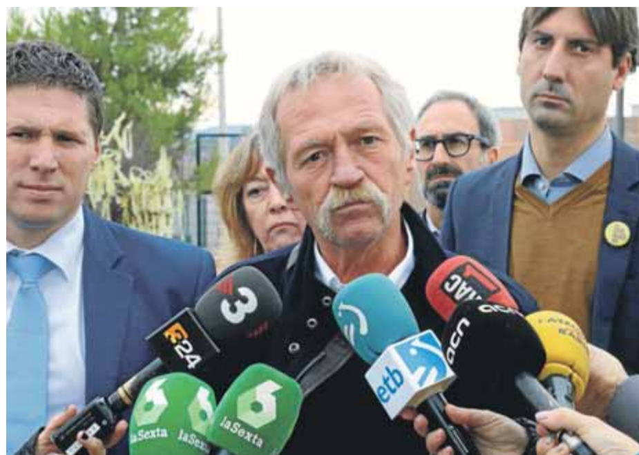
José Bové, amb altres eurodiputats, ahir a la sortida de la presó de Lledoners

“Estaran en una presó a més d'una hora de Madrid, traslladats cada dia a les cinc del matí en furgons i emmanillats per després