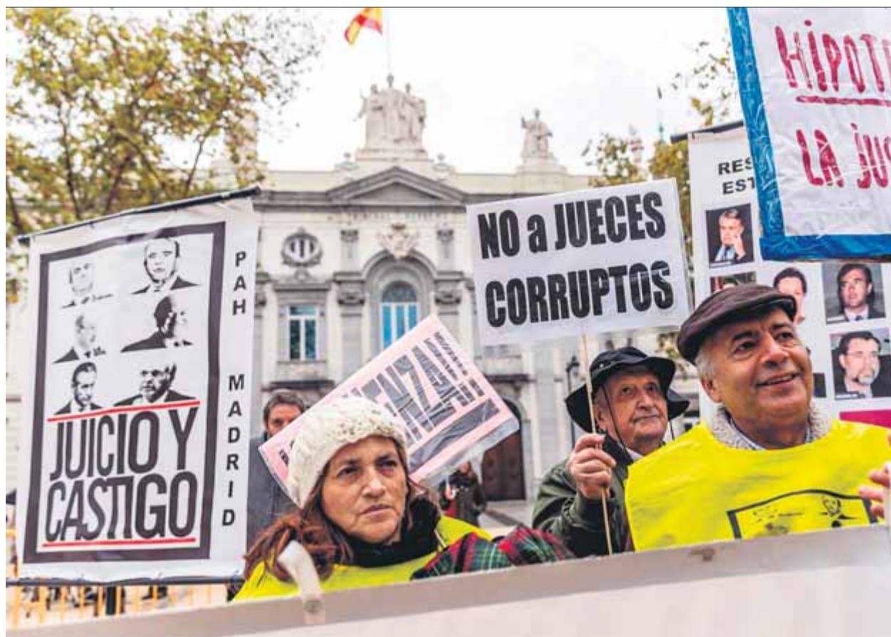
Manifestants, ahir, davant del Tribunal Suprem

DIVIDITS • El desacord entre els magistrats provoca un debat intens en el ple d'ahir