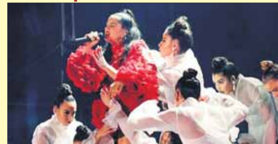
Rosalía, en una actuació recent