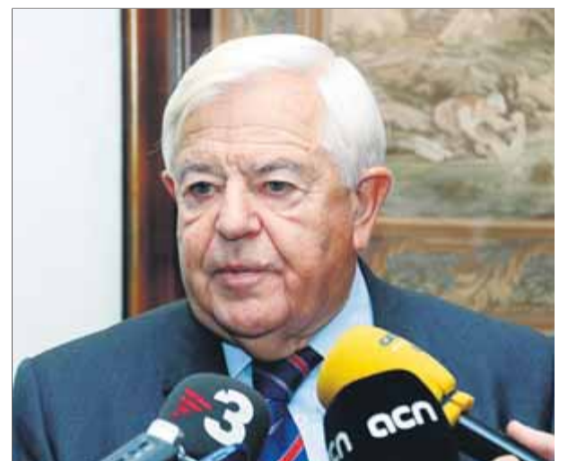
El primer president de l'Eslovènia independent, Milan Kucan, el 6 de desembre passat