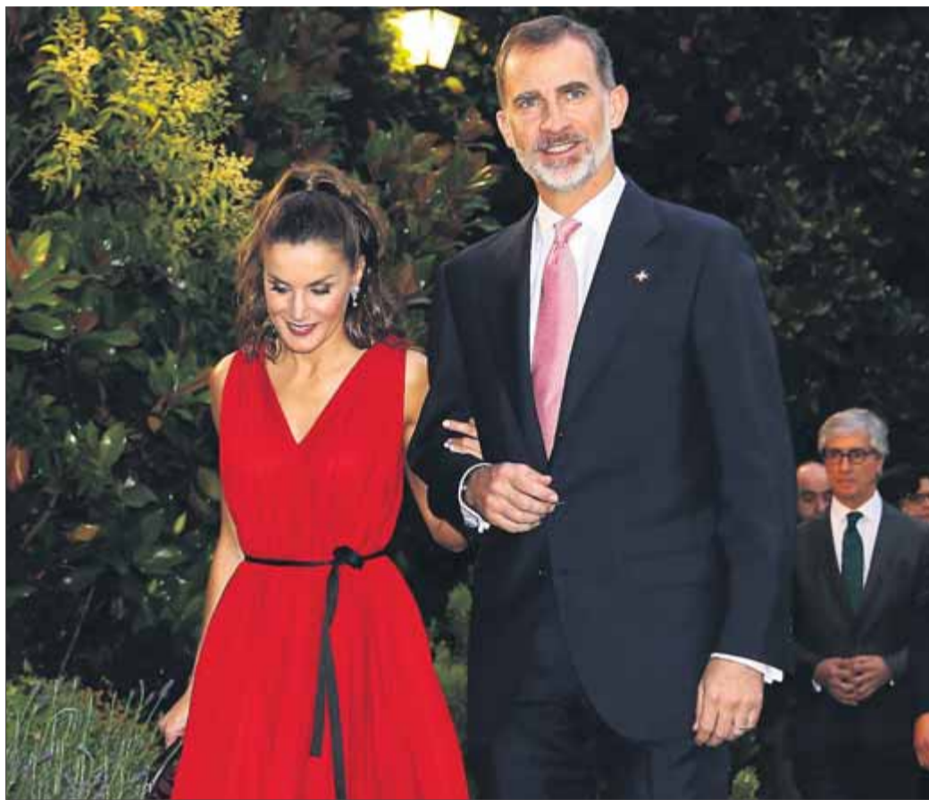
La reina i el rei espanyol durant l'entrega de premis de la FPdGi d'enguany a Vilablareix