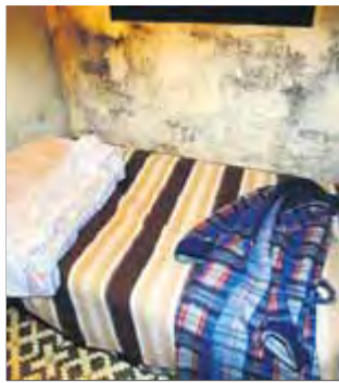
Infrahabitatge al Raval

Una de cada tres persones de la diòcesi de Barcelona no té un habitatge digne o segur, segons un informe de Càritas