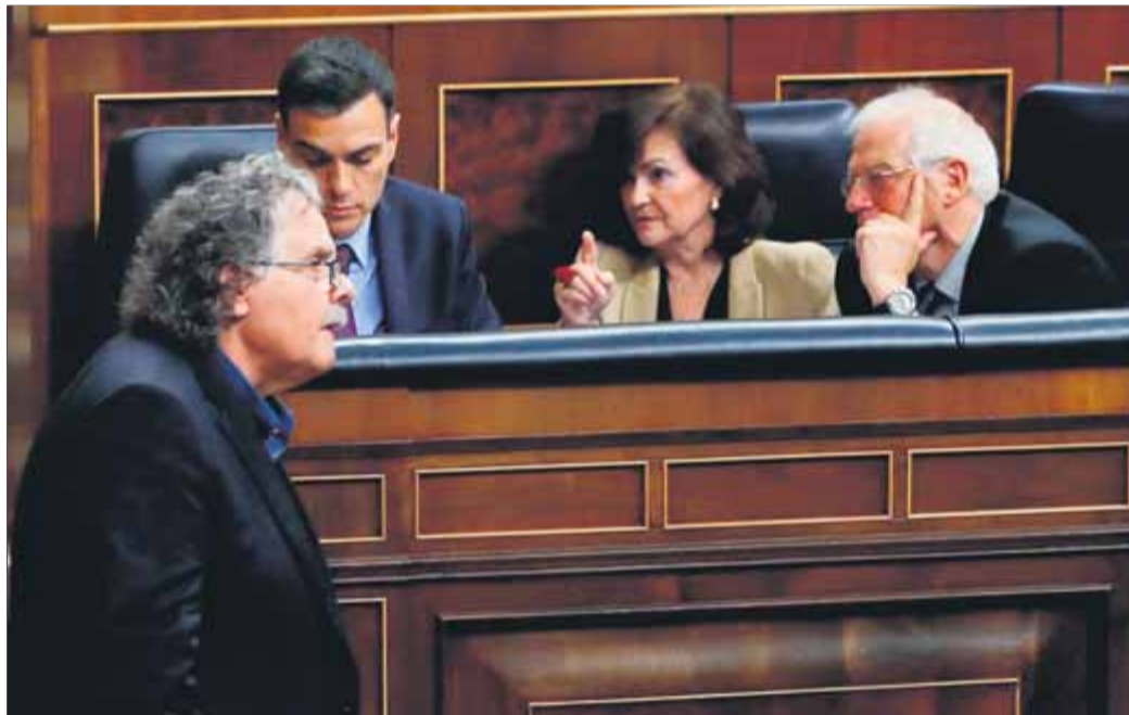
El republicà Tardà passa per davant dels escons de Sánchez, Calvo i Borrell al Congrés

Després d'aplicar la seva injecció de vacuna balcànica, Sánchez va barrejar l'escalivada i el fish and chips : els votants independentistes i els favorables al Brexit , segons ell, s'alimenten igual de "greuges inventats i manipulats" amb "un mateix patró d'enganys". "Mai seguiré