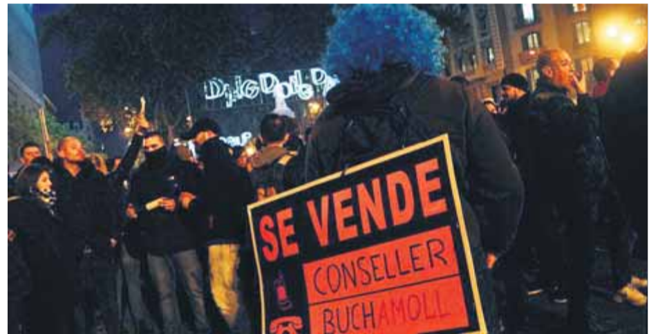
Un moment de la concentració dels Mossos davant la seu d'Economia