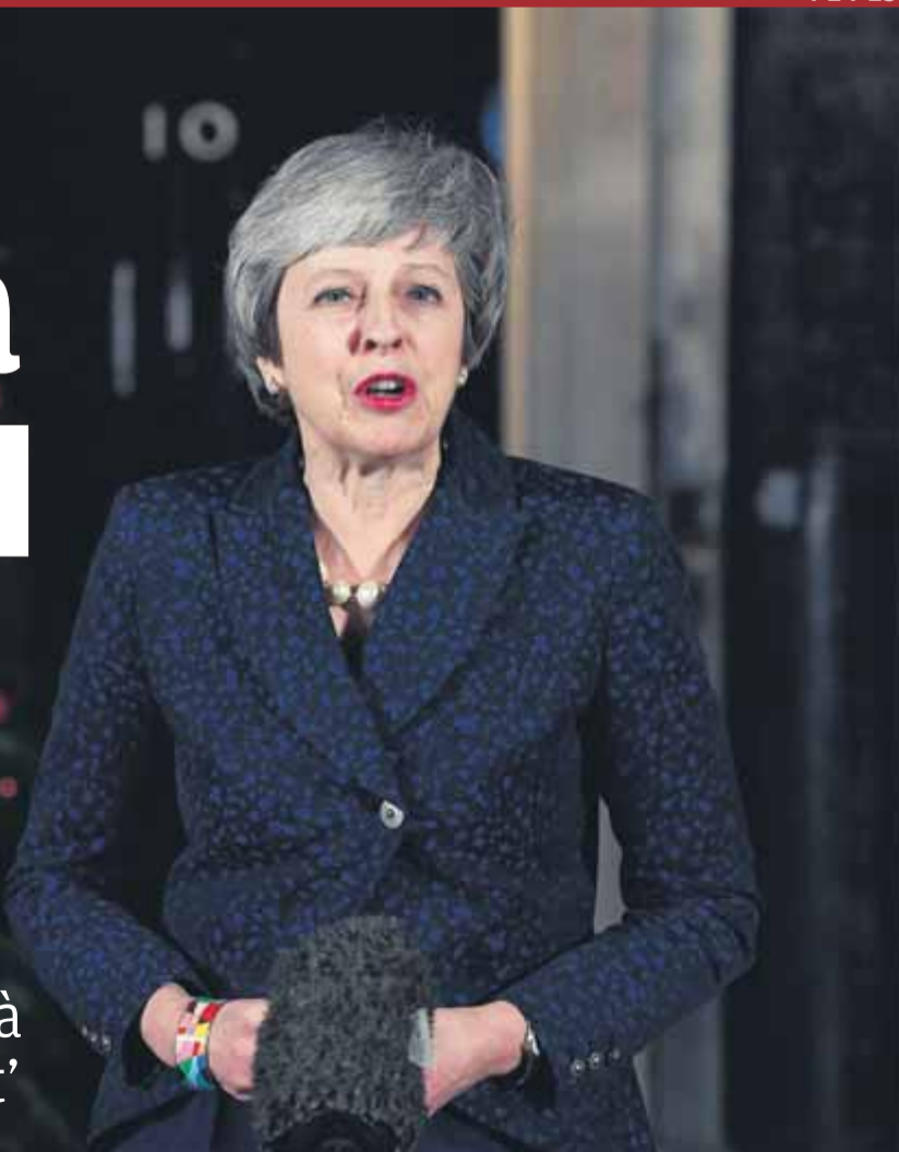
Theresa May, fent una declaració a la porta del 10 de Downing Street després d'haver superat la moció de confiança

Sobreviu a la moció del seu partit i continuarà liderant el 'Brexit'