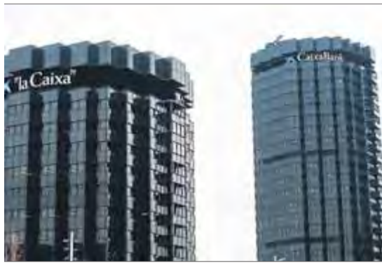
CaixaBank a la Diagonal de Barcelona