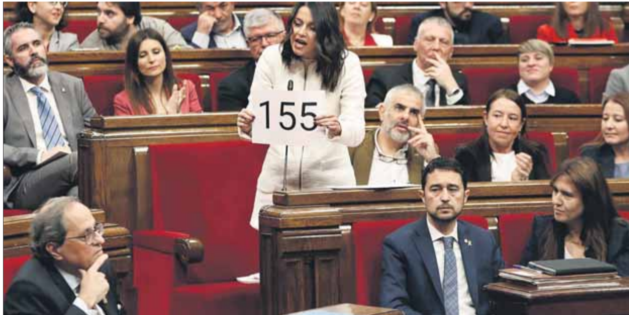
La cap de l'oposició, Inés Arrimadas, mostra un cartell amb el 155 al president, Quim Torra, ahir en la sessió de control ■ EFE

Per construir aquest relat, també s'ha aprofitat la crida de Torra a seguir la