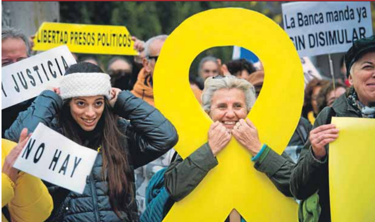
La concentració al davant de la seu del Suprem per mostrar el rebuig al procés penal contra els líders independentistes