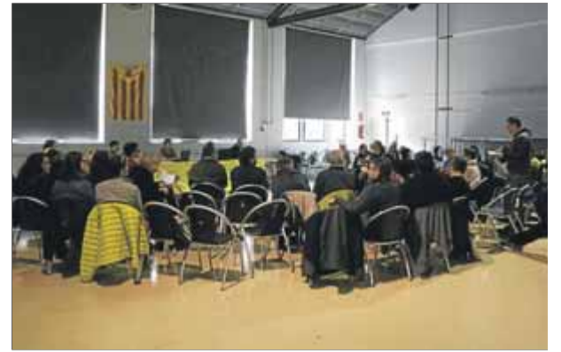
Participants en el consell nacional de la CUP a Artés, durant els debats