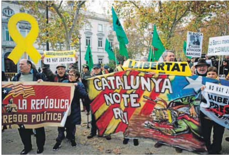
Manifestants al davant del Tribunal Suprem a Madrid, ahir

La plataforma denuncia no només la causa contra el procés català, sinó també altres casos com ara el de La Manada, la persecució de músics com per exemple Valtònyc o la no persecució dels crims franquistes. L'acte d'ahir és el primer que ha organitzat la plataforma No hi ha Justícia, a la qual ja s'han sumat 128 entitats i que s'ha creat per denunciar la politització de l'alta magistratura, la “persecució de la dissidència” i la vulneració dels drets humans, entre altres crítiques al funcionament judicial en casos com ara el procés sobiranista, els de lli-