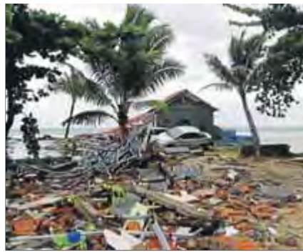
La platja de Carita, devastada

Un tsunami causat per una erupció volcànica fa més de 200 morts i un miler de ferits