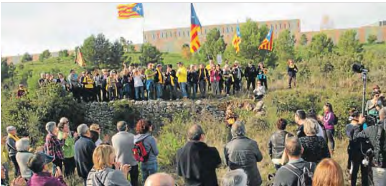
Part dels assistents, fent la volta al perímetre de la presó de Figueres

AUTORITAT · La consellera Artadi li reclama que exerceixi de cap de govern i no sigui "un titella de tot el que és l'Estat"