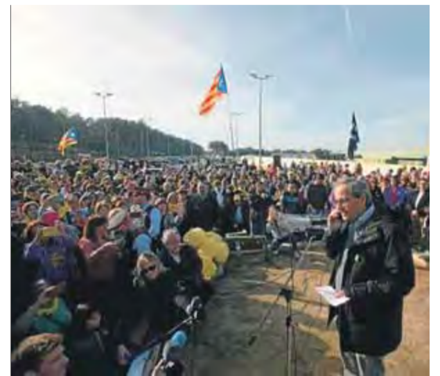
El president Torra llegint ahir les paraules de Carme Forcadell a tots els concentrats davant de la presó

convocats per Òmnium i l'ANC i amb el suport de Músics per la Llibertat s'han cantat diverses nadales, com ara El noi de la mare , Santa nit o Fum, fum, fum .