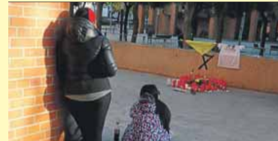
Ciutadans amb espelmes al lloc de l'assassinat ■ ACN