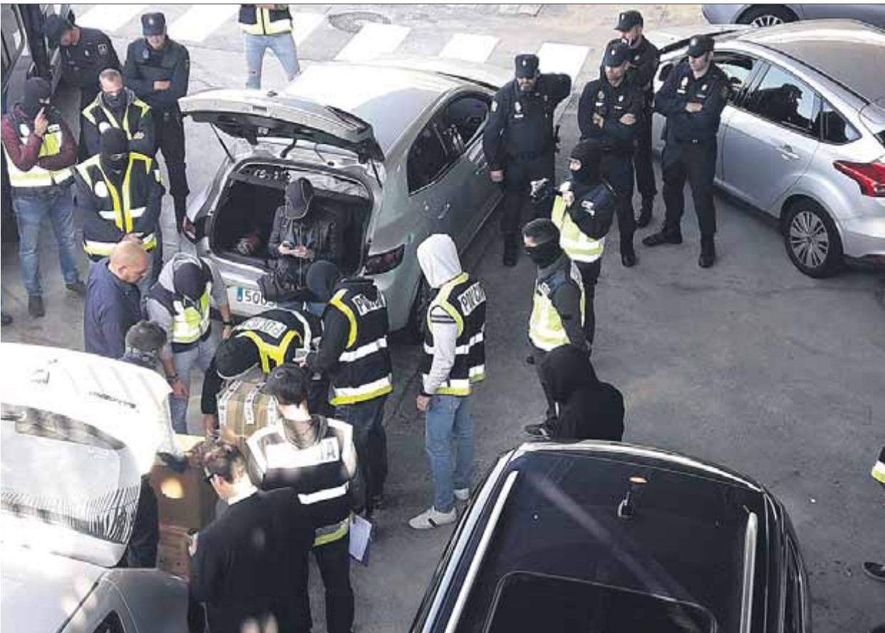
La policia espanyola va interceptar una unitat dels Mossos a la incineradora, el 2017 ■ SARA MUÑOZ