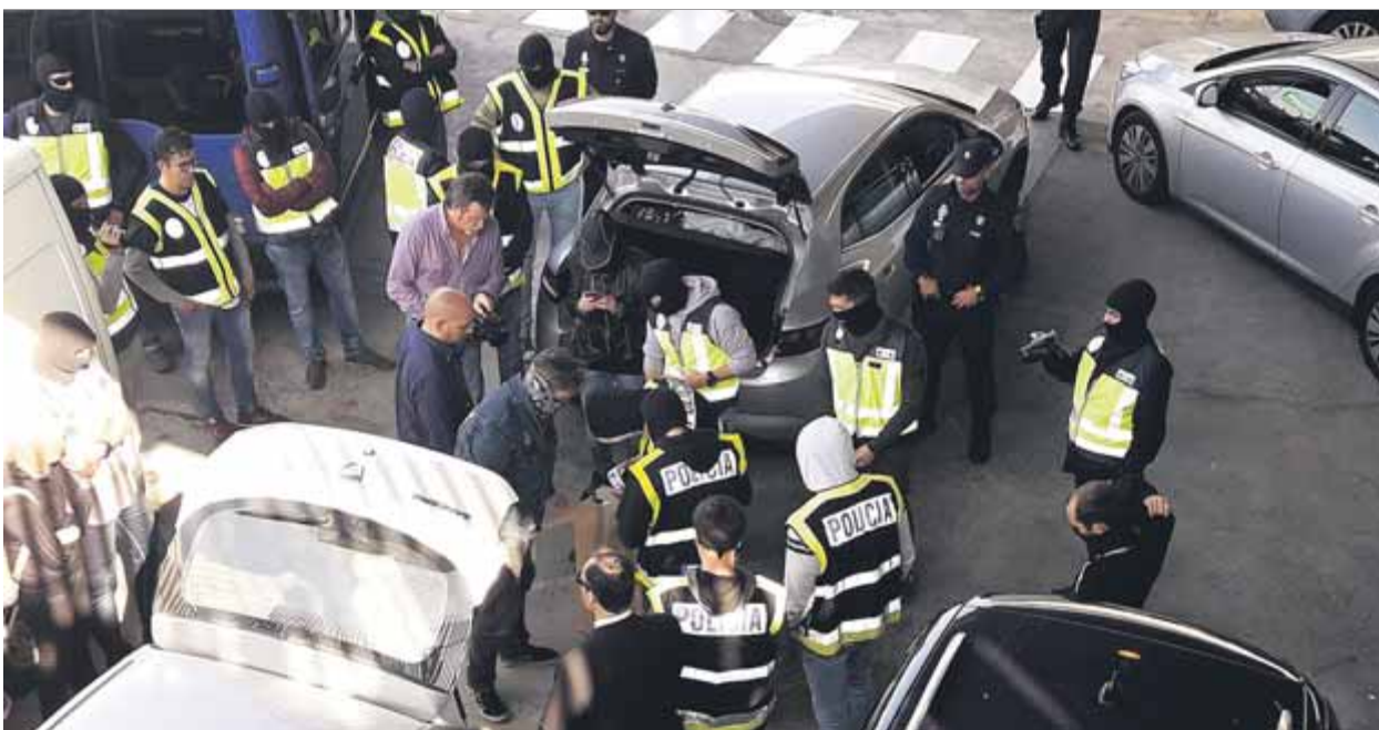
Un fort contingent de la policia espanyola envolta els cotxes dels Mossos que portaven a cremar documents ■ S.M.

JUSTIFICACIÓ • La investigació de polítics i periodistes buscava "protegir l'ordre públic"