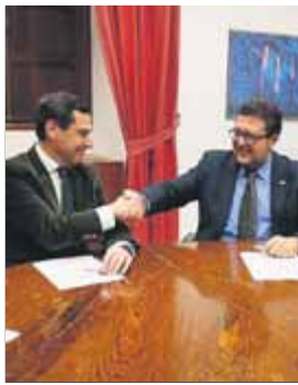
L'acord del PP i Vox

El popular Juanma Moreno pacta amb l'extrema dreta i serà el president de la Junta tancant l'etapa socialista de 36 anys