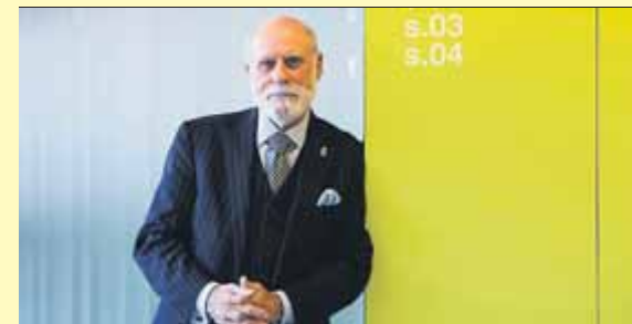
Vinton Cerf, a Barcelona l'any 2016