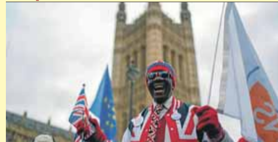
Un manifestant pel 'Brexit' davant del Parlament