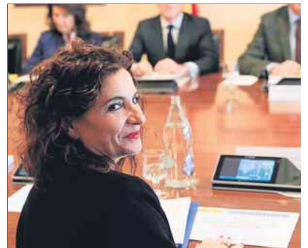
La ministra d'Hisenda, María Jesús Montero, la setmana passada a Madrid

que el camí és una ofensiva d'Estat i de publicitat durant el judici, si s'alinea amb les tesis d'Alfonso Guerra, potser hauria d'anar a buscar uns altres socis”, va alertar Artadi després de la reunió de l'executiu. El límit per presentar esmenes a la totalitat expira divendres de la setmana vinent. ■