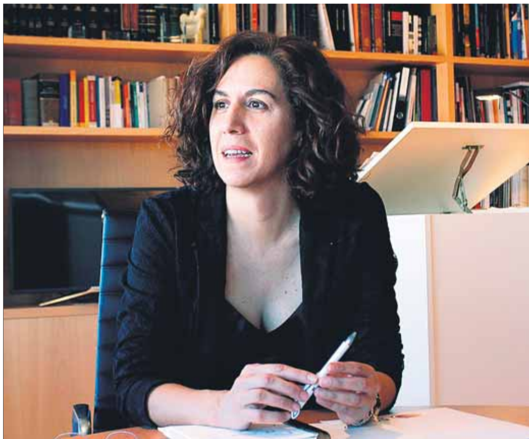
Irene Lozano és secretària d'estat d'Espanya Global

fensar la instrucció del jutge del Suprem Pablo Llarena, l'obsessió de Lozano va ser que Espanya Global tingués el simbolisme de ser el primer anunci de l'any 2019 a TVE després de les campanades. I no li va ser difícil, perquè TVE i Espanya Global tenen el mateix amo, que és l'Estat, és a dir, el contribuent. En contraposició amb la model Nieves Álvarez com a estandard triat per Espinosa de los Monteros, Lozano va escollir el jove actor Alejo Sauras per a un espot en què ell recita El Quixot en un teatre i provoca que cada espectador s'alci a