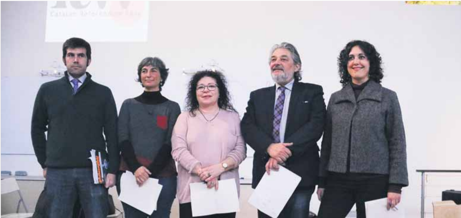
Els impulsors de la plataforma International Trial Watch van presentar ahir a Madrid les organitzacions que volen enviar observadors al judici

■ La plataforma International Trial Watch vol cinc seients en la vista de l'1-O per vigilar possibles vulneracions ■ El Tribunal Suprem calla i ho desvia al cap de premsa ■ Pérez Royo, Urías i Erri de Luca s'hi interessan