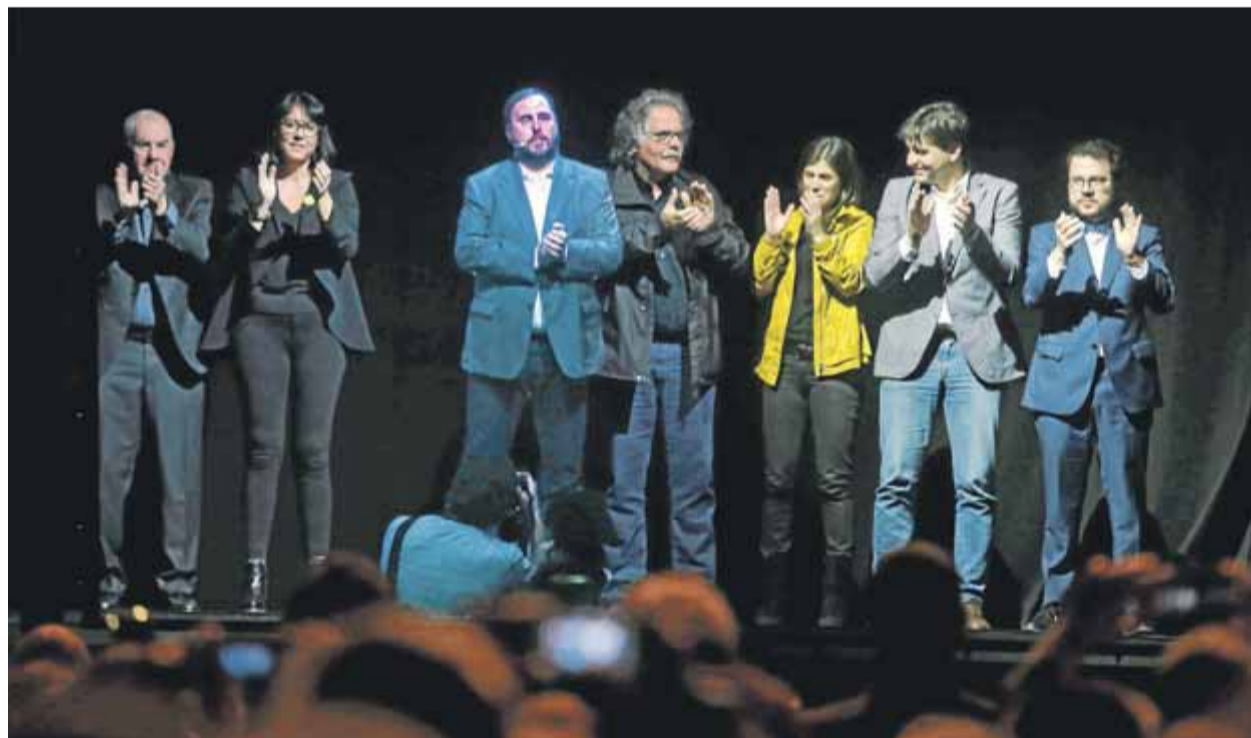
L'holograma d'Oriol Junqueras va ser present a l'acte d'ahir des de l'escenari, acompanyat de líders d'ERC

Els presos polítics seran traslladats a Madrid divendres