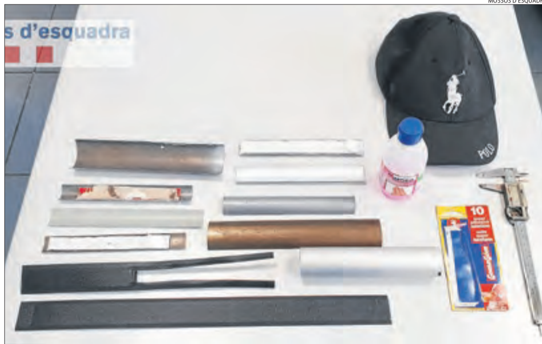
Material confiscat que el detingut tenia al seu domicili per manipular els caixers.