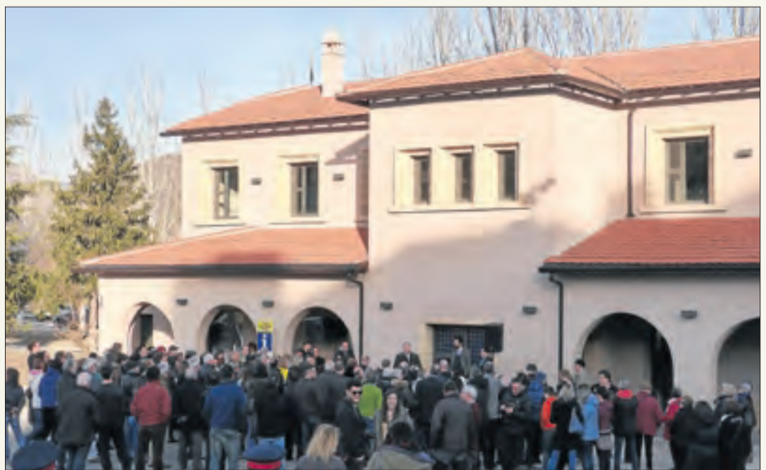
La remodelada estació de la Pobla que es va poder visitar dins de la jornada de portes obertes.

Ahir es van poder fer viatges des de qualsevol punt de la línia de tren de Lleida a la Pobla i es van organitzar activitats dinamitzades pel grup pallarès de teatre A Galet. La jornada continua avui amb un