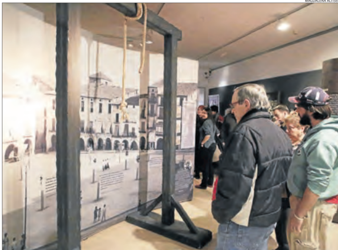
L'exposició 'Se'n parlave i n'hi havie' podrà visitar-se fins al proper dia 24.

Pau Castell. El manuscrit, que ha tardat més de dos anys a veure la llum, aborda el tema des de dos vessants clarament diferenciats però que es complementen perfectament. Primer tracta la bruixeria des d'un punt de vista històric, en el qual mostren les dades recollides després de la investigació d'arxius històrics on es troben per exemple, judicis perfectament documentats que es van celebrar durant els segles XV a XVII. I d'altra banda, inclou el vessant de la memòria etnogràfica, és a dir, trasllada els relats de diverses persones d'avançada edat de diferents comarques de Ponent, que, mitjançant entrevistes, van explicar la seua experiència o la dels seus familiars respecte a la bruixeria. La jornada de presentació va acabar amb una taula redona en la qual l'equip encarregat de realitzar les entrevistes va explicar la seua experiència i a quines conclusions van poder arribar amb la informació obtinguda. Així, tots van