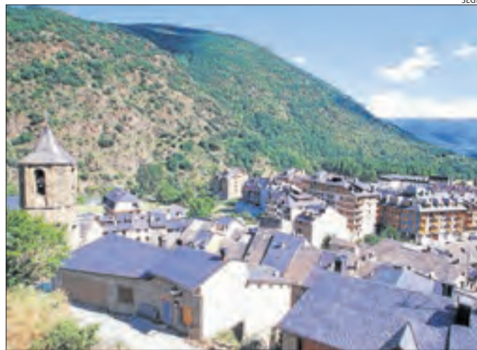
Imatge d'arxiu de la població del Rialp, al Sobirà.