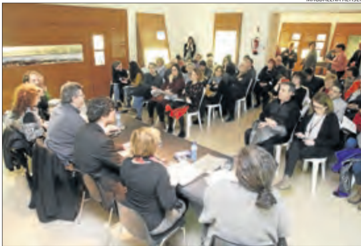
Moment de la taula redona ahir al Museu de la Noguera.

El Museu de la Noguera acull també fins al proper dia 24 l'exposició amb el mateix nom en la qual el públic pot veure des d'amulets de protecció fins a documents de judicis per bruixeria.