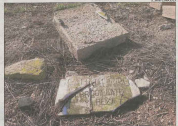
Les lloses han aparegut totalment destrossades.