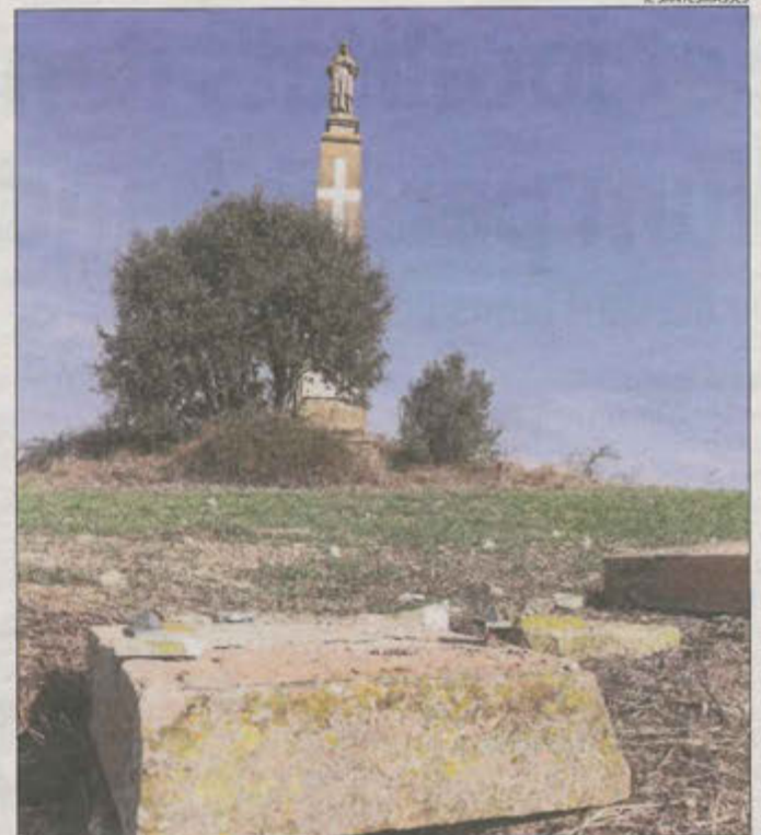
Imatge del monòlit amb el Sagrat Cor.