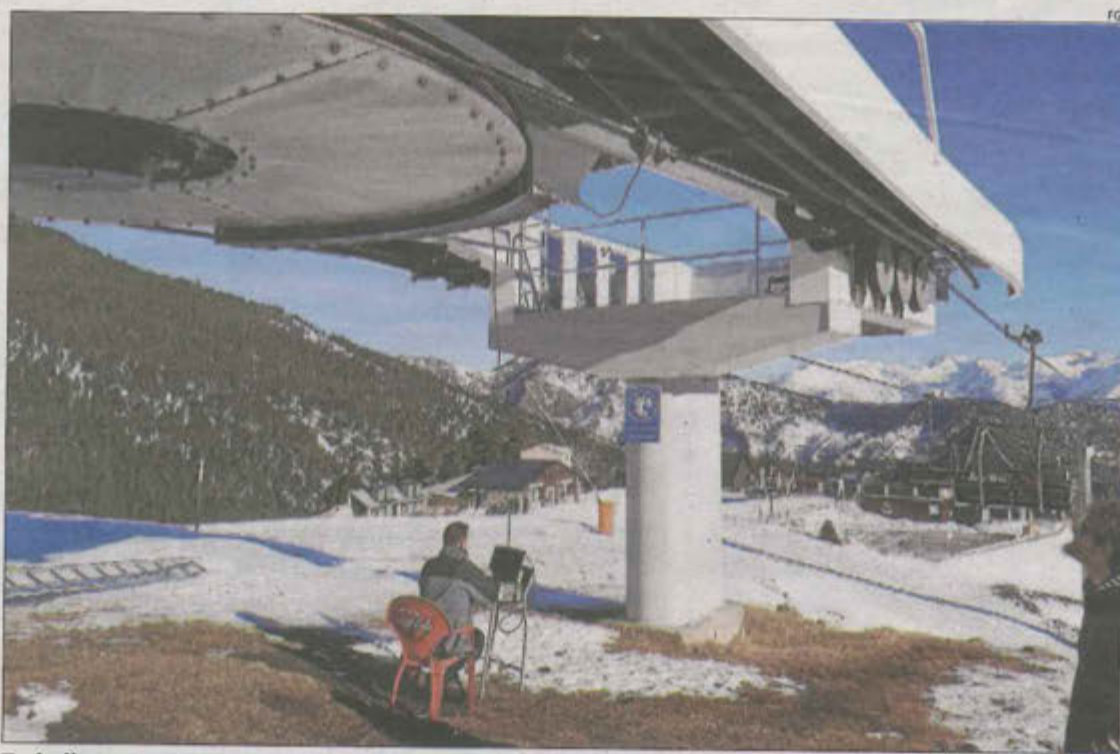
Treballs per comprovar l'estat del telecadira la Roca d'Espot, la setmana passada.

El trajecte de les llevaneus serà d'una mica més d'1,5 qui-